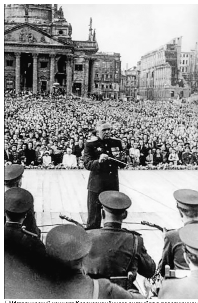
Исторический концерт Краснознамённого ансамбля в поверженном Берлине 18 августа 1948 года. Он вошёл в историю как «праздник жизни на руинах».