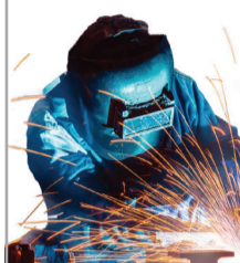
График работы 5/2. Гражданство РФ, РБ.