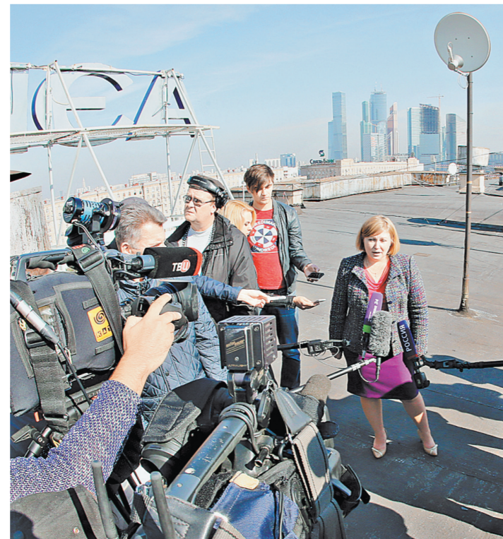
Елена Неверова: В 365 домах капремонт начнется в этом году.

Но особенно нравятся горожанам танцы в парках, где можно научиться также бесплатно танцевать все: от классического вальса и танго до современных хастла и рок-н-ролла. Всего же летом танцевали 150 тысяч москвичей. «Но есть одна проблема, которую мы не можем решить, — признался глава департамента. — Женская часть жалует, что у них нет пар. — Поэтому от имени москвичек я усиленно приглашаю старшее поколение москвичей — приходите танцевать!»