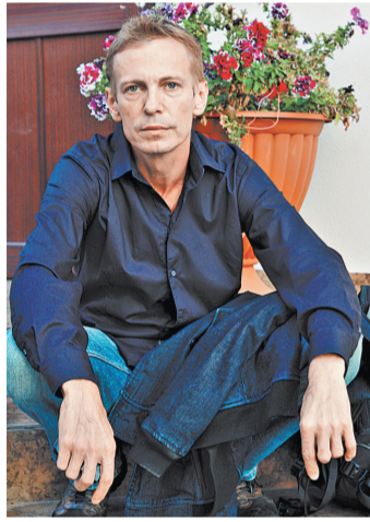
На этот раз Шарунас Бартас снял обрет личный фильм-исповедь.

Молчаливые крупные планы и здесь наиболее удались. Сценария почти не было, он все время менялся. Работа в основном шла импровизационная: все герои фильма реплики говорили из сердца. Философия, по которой