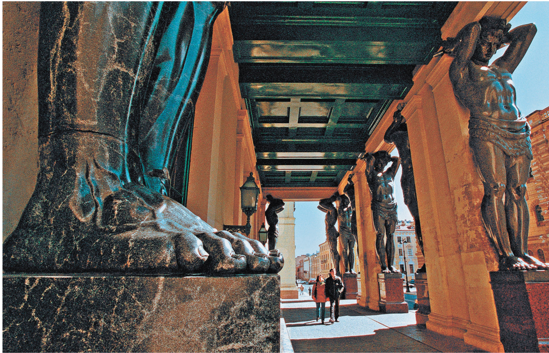
Ну мы-то знаем, что Эрмитаж лучший музей в мире, хоть ему и присвоено имя «лучшего в России».