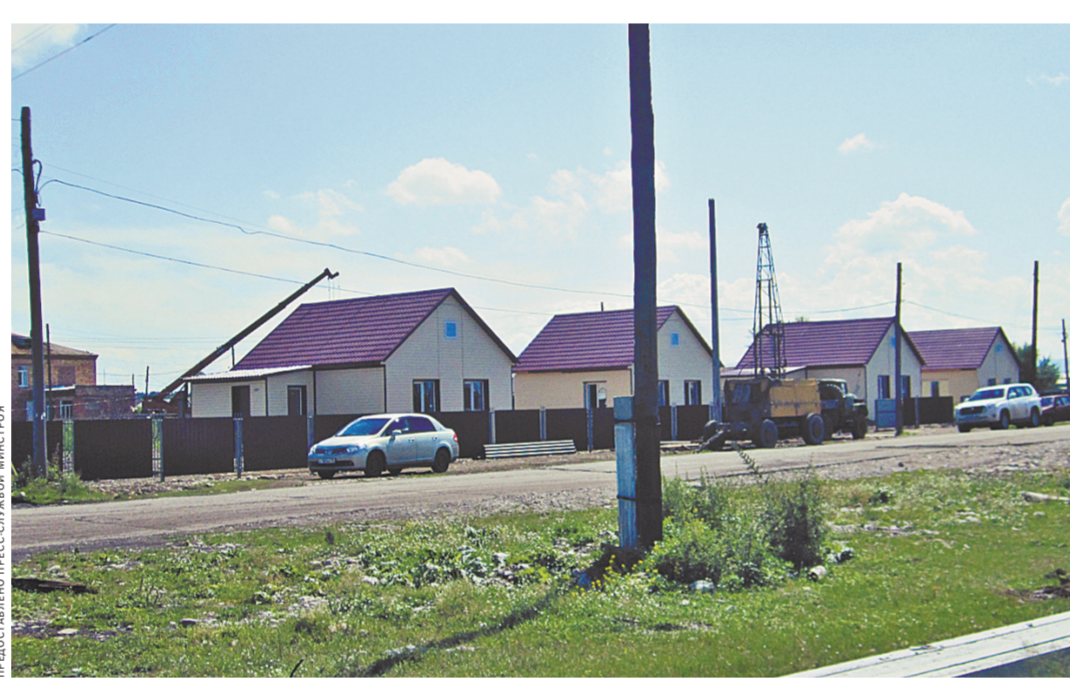
Многие новые дома в Хакасии и Забайкалье удалось сделать благоустроеннее, чем старые, сгоревшие.

страдавших, а обеспечить их крыши над головой. Каждая семья получает метры по установленной государственной норме. На уровне правительства РФ было принято решение строить новое жилье в пострадавших регионах по нормам — 33 кв. м для одиноких граждан, 42 кв. м на семью из 2 человек и по 18 кв. м на каждого члена семьи из трех и более человек, но не более общей площади утраченного жилья, за исключением некоторых случаев. В этот раз было решено предоставить дополнительные льготы многодетным семьям.