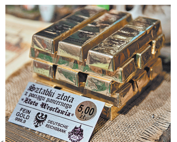
В магазинах Польши уже началась продажа сувениров, стилизованных под золотые слитки из «сокровищ нацистов».

В Польше царит «золотая лихорадка», и уже есть ее жертвы