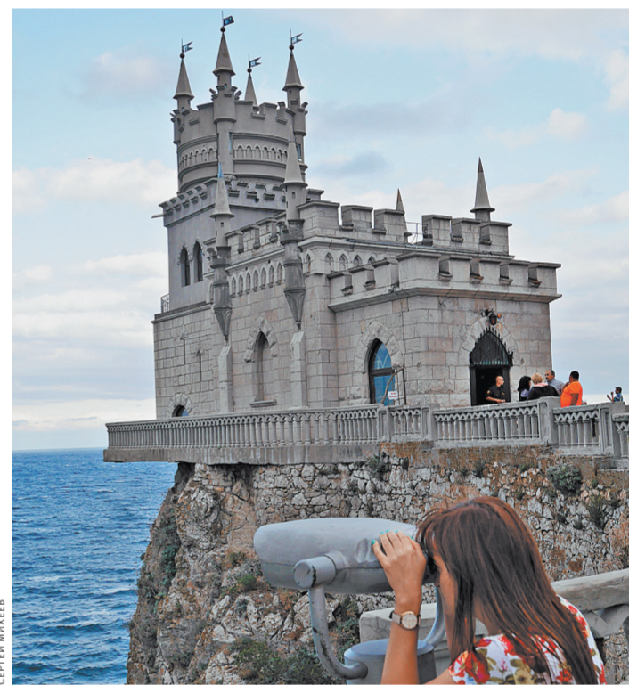
«Карта гостя» поможет осмотреть достопримечательности со скидкой.

Фоторепортаж смотрите на сайте www.rg.ru/art/1165072