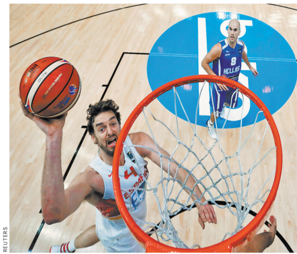
Остановить испанцев на пути к полуфиналу греческие баскетболисты не смогли.