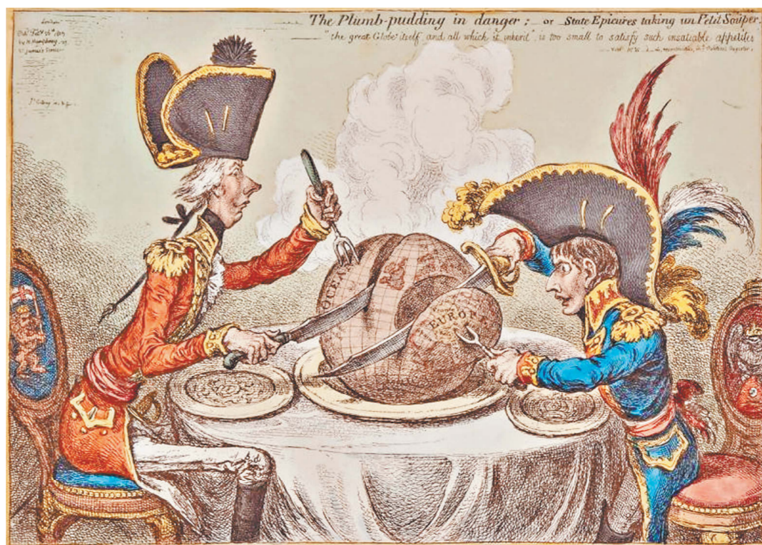
Карикатура Джеймса Гилрея «Рождественский пудинг в опасности...» (1805). Уильям Питт и Наполеон делят мир.