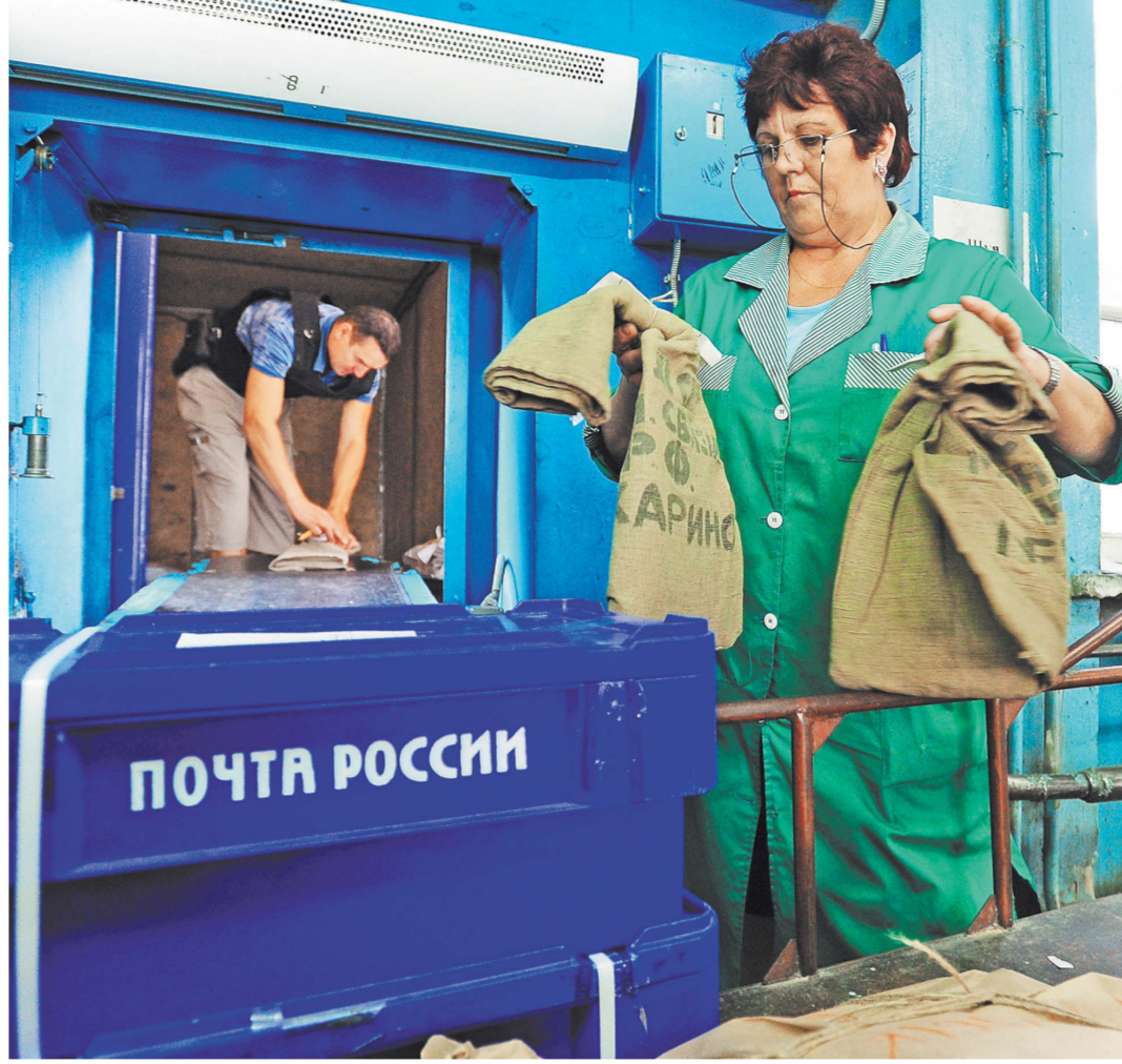
Претензии к качеству почтовых переводов должны рассматривать в течение месяца.

Исключение: претензии по почтовым отправлениям и почтовым переводам денежных средств, пересылаемых в пределах одного населенного пункта. Для таких жалоб сохранен пятнадцатидневный срок ответа.