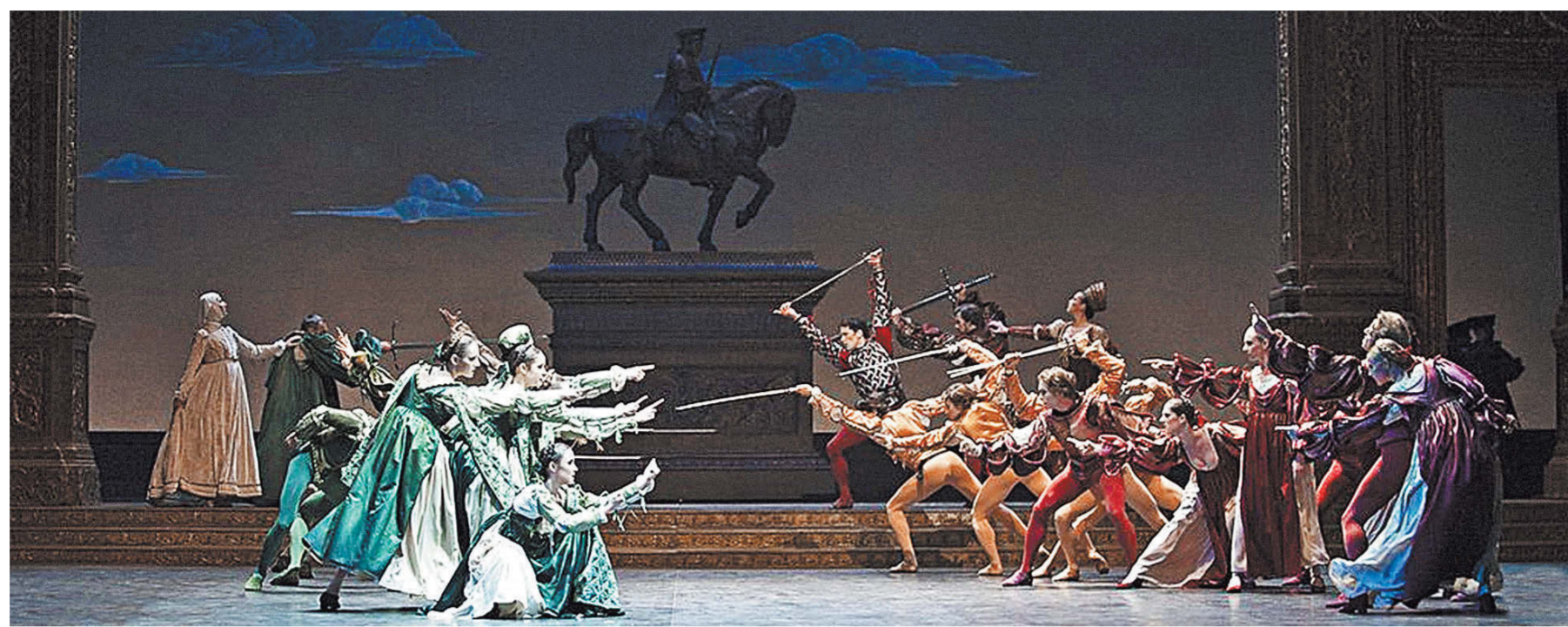
В Opéra Bastille возобновили «Ромео и Джульетту» Рудольфа Нуреева.