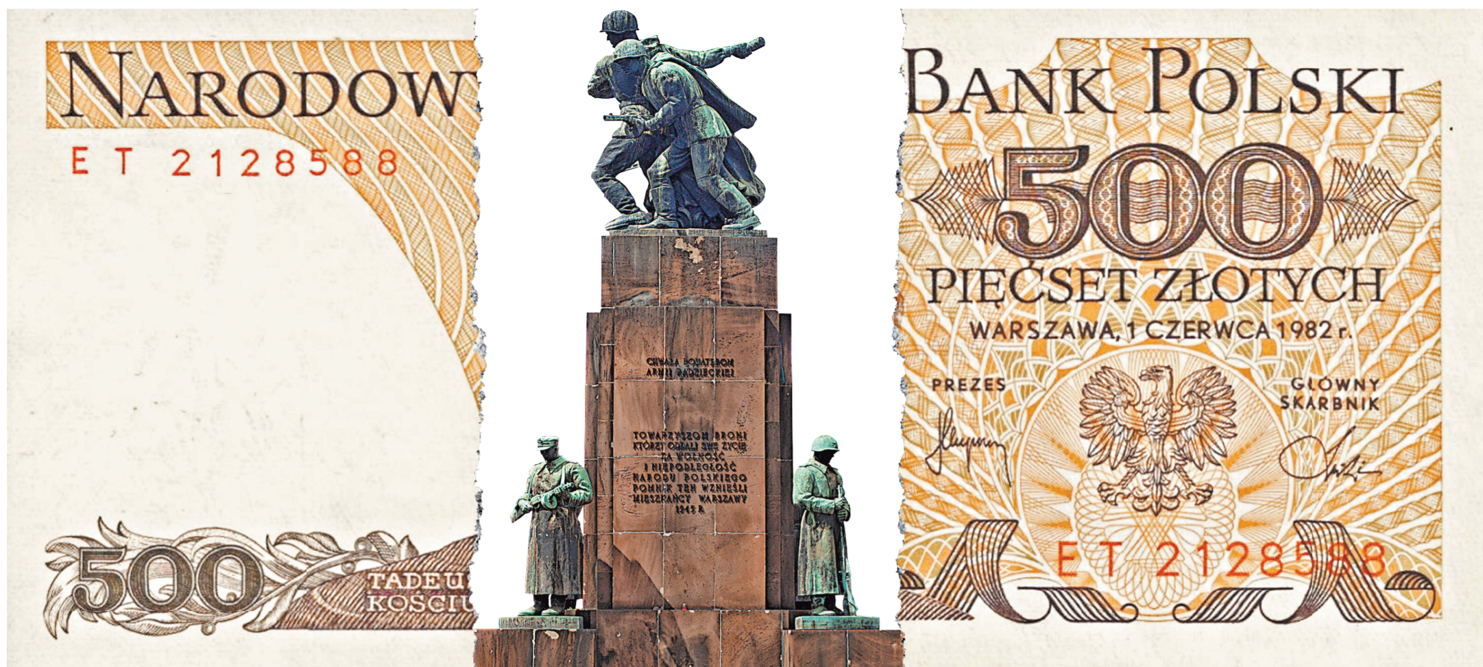
Вслед за памятником «Боевому братству», за который вступались жители Варшавы, в Польше могут быть демонтированы еще более 500 монументов советским воинам, спасшим страну от нацизма.