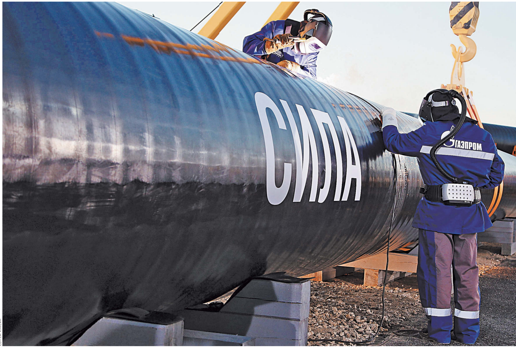
Зависимость от «трубы» — это ахиллесова пята российской экономики, инвестиции должны способствовать ее диверсификации.