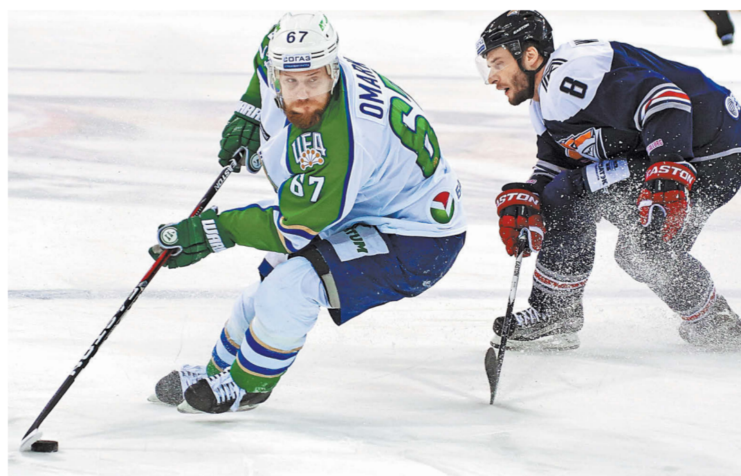
После двух изумительных семиматчевых серий сил на очередной подвиг в противостоянии с «Металлургом» у «Салавата Юлаева» не хватило.

разговаривать и на эту тему», — сообщил «РГ» глава селекционной службы сборной Алексей Жамнов. В то же время он подчеркнул, что Знарок беседовал с Дацюком во время февральской поездки в США, и 37-летний форвард дал предварительное согласие. Что касается сборной России, стартовавший вчера сбор завершится матчами против Норвегии в рамках Европейского Кубка вызова, которые пройдут 8 и 10 апреля в Санкт-Петербурге. 14 и 16 апреля наши в том же турнире сыграют в гостях со словаками, а ближе к концу месяца подопечные Знарка проведут матчи в Евротуре против шведов и финнов. Ну а первым соперником россиян на чемпионате мира станет Чехия 6 мая.