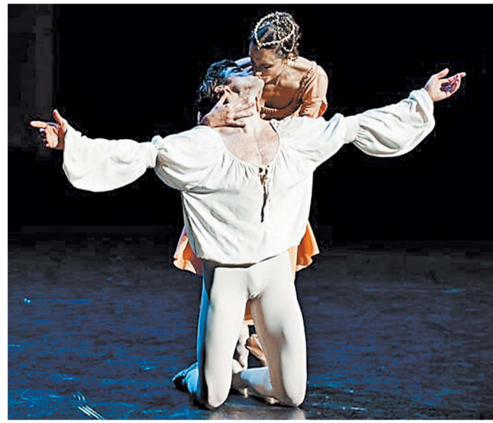
В «Ромео и Джульетте» танцовщики каждый номер исполняют с отдачей.

Постановка «Семь сонат» не стала для Парижа знакомством с Алексеем Ратманским — он уже ставил здесь «Наму» с Дианой Вишневой в главной роли, не говоря о гастролях Большого театра с его «Светлым ручьем», «Пламенем Парижа» и «Утраченным иллюзиями». Однако сейчас это не просто приглашение (кстати, в преддверии нового полнометражного эксклюзива, который ждет от хореографа Opéra de Paris): «Семь сонат» Ратманского встроены в вечер американской хореографии, где идут балет Джорджа Балачина и Джерома Роббинса, выходящих из России, то можно увидеть в этом подпольном фестивале российской хореографии.