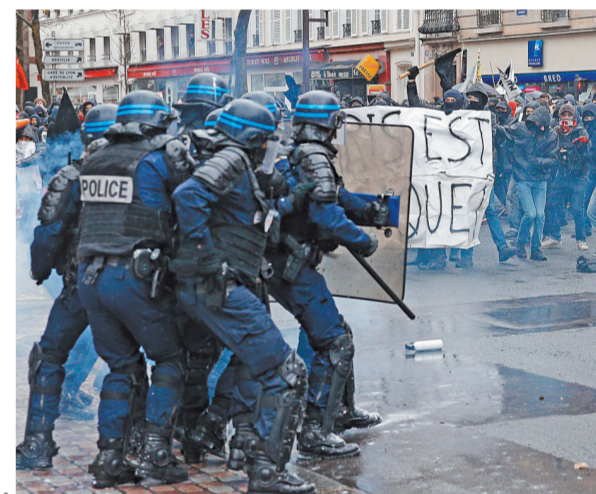
В Париже агрессивно настроенные манифестанты забросали полицейских петардами и дымовыми шашками.