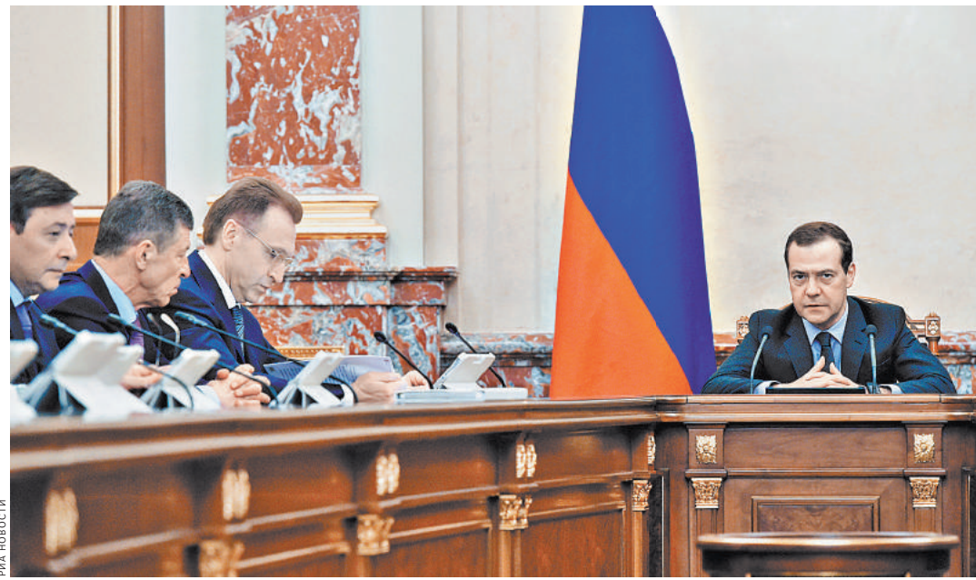
Премьер потребовал принять меры для исправления ситуации с отстающими госпрограммами.

Проект позволит производить 300 машин в год, но при повышенном спросе мощности будут наращиваться. Как сообщалось, автомобили на платформе «Кортеж» будет выпускать Sollers на мощностях ОАО «Ульяновский автомобильный завод». Работки «Кортежа» придутся и для создания других моделей авто — отечественные автомобилестроители смогут использовать их при проектировании собственных машин.