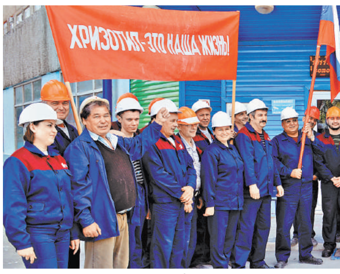
Запрет на использование хризотила под надуманными предлогами привел бы к ликвидации десятков тысяч рабочих мест по всей стране.

Хризотил-асбест широко используется в качестве ингредиента в целом ряде изделий, таких, как шифер, водопроводные трубы, огнезащитные покрытия, тормозные колодки, уплотнительные кольца и опоры для автомобилей. Благодаря уникальным физико-химическим свойствам и волокнистому строению изделия на основе минерала отличаются