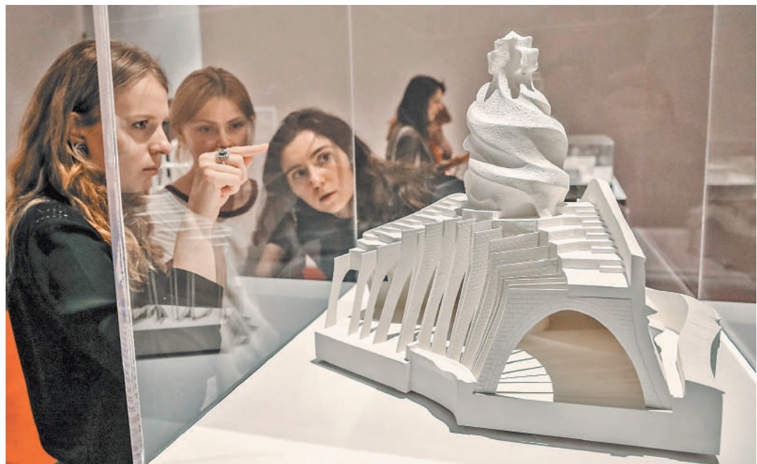
Гипсовые модели шедевров Гауди помогают рассмотреть их изнутри.

Удобней сидеть, легче дышать и передвигаться. Вот в этих дубовых стульях и диване из Дома Бальо (чуть ли не единственных на выставке, которых касалась рука мастера, под его наблюдением их вытачивали барселонские мебельщики) тело не затекает, мастер создал «обтекающие» тело сиденья и спинки. В спроектированные Гауди вентиляционные шахты тут можно заглянуть, на выставке стоят уменьшенные модели труб, «надеть» на них архитектором купола не мешали