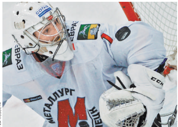
В следующем сезоне новокузнецкий «Металлург» ждет понижение в классе.