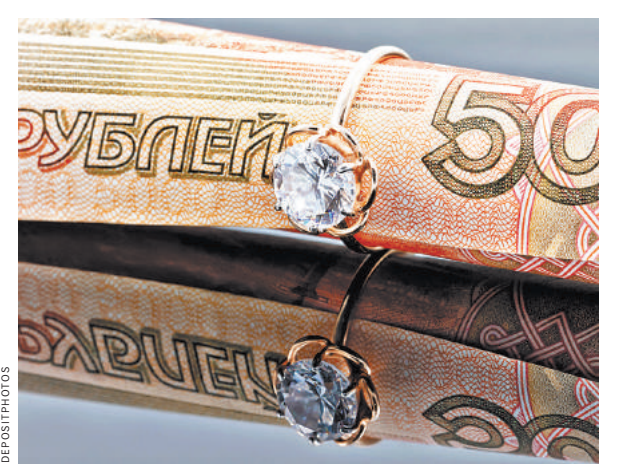
70 процентов покупателей предпочитают оплачивать заказ курьеру, чтобы убедиться в целостности украшения.