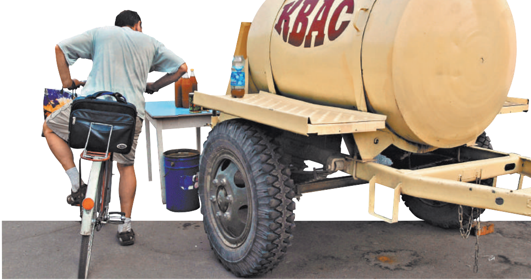
Летом спрос на квас растет, недобросовестные изготовители напитка этим пользуются.

Что касается обязательных требований безопасности, лишь в трех случаях выявлено несоответствие кваса по микробиологическим показателям: в образцах «Аппетитно Круглый Год», «Букет Чуваши» и «Суздальские напитки» были обнаружены превышения обязательных норм на содержание дрожжей и плесени.