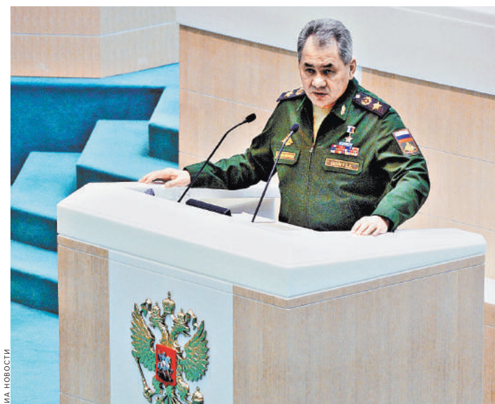
Министр обороны уверен, что программа модернизации Вооруженных сил будет выполнена в срок.

и техникой не ниже 70%. Это сохраняет позиции России как наиболее развитого в военном отношении государства», — уверен Шойгу. Он также подвел итоги операции российских ВКС в Сирии: Россия, располагая более скромными ресурсами, чем за-