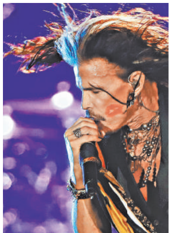
Кто бы поверил, что Стивену Тайлеру исполнилось уже 69? На сцене певец двигался так же лихо, как в 1973-м, когда у Aerosmith вышел дебютный альбом.