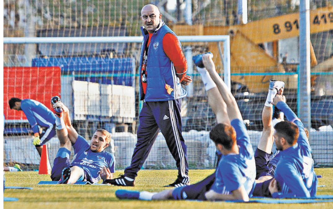
Матч с Венгрией станет восьмым для российской сборной при Станиславе Черчесове.

Согласно запланированному графику игроки Станислава Черчесова уже завтра вылетят в австрийский Инсбрук. Оттуда россияне отправятся в местечко Нойштифт (регион Тироль. — Прим. авт.), что в получасе езды от Тироля. Здесь сборники будут заниматься до 3 июня, когда предстоит вояж в Будапешт на третий контрольный матч в нынешнем году против Венгрии. Ну а последнюю встречу перед Кубком конфедераций наши футболисты проведут 9 июня в Москве против Чили.