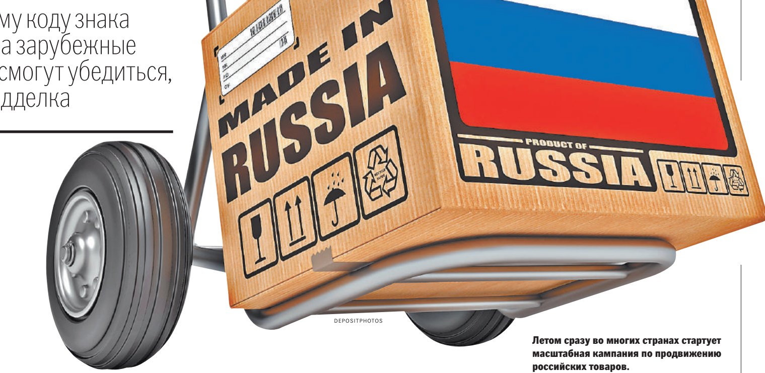
Летом сразу во многих странах стартует масштабная кампания по продвижению российских товаров.

Сертификация будет состоять из двух этапов: проверка деловой