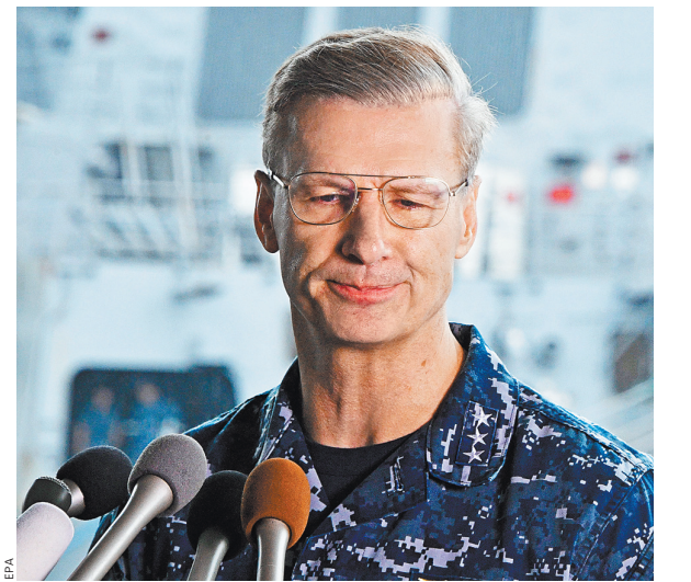
В сентябре уволенный с позором вице-адмирал Джозеф Окойн должен был официально уйти в отставку.

Фоторепортаж с места аварии эсминца на сайте rg.ru/art/1441435