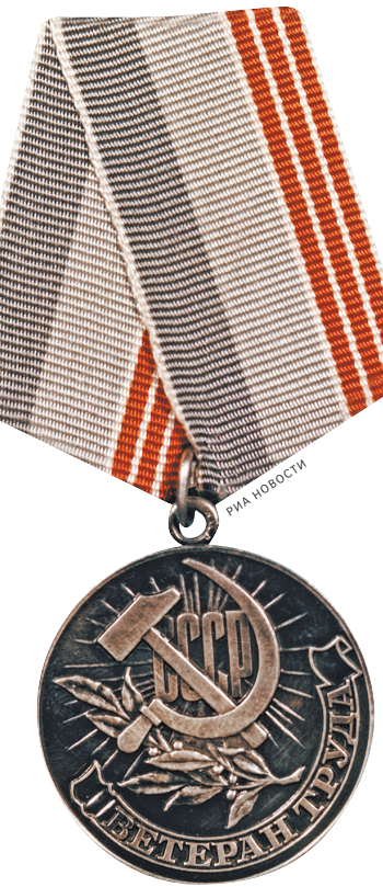
Сегодня ветеранам труда медалей не дают, зато льгот больше. Но получить звание стало труднее.

Кроме того, если государственный человек принимает знаки отличия от общественных организаций, партий, международных организаций и даже государственных органов власти (непрофильных для его деятельности), то может возникнуть конфликт интересов, чиновник перестает быть нейтральным лицом, он приобретает лояльность к конкретным организациям, что в итоге будет вредить госслужбе. Прежнее правило, позволяющее