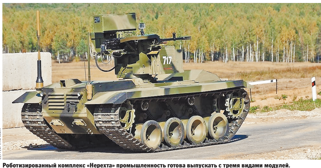
Роботизированный комплекс «Нерехта» промышленность готова выпускать с тремя видами модулей.

Была информация, что все три роботизированных комплекса прошли боевую обкатку в Сирии. В Минобороны России это официально не подтверждают. Зато известно, что комплекс «Нерехта» участвовал в показательном бою, устроенном на военно-технической форуме «Армия-2017».