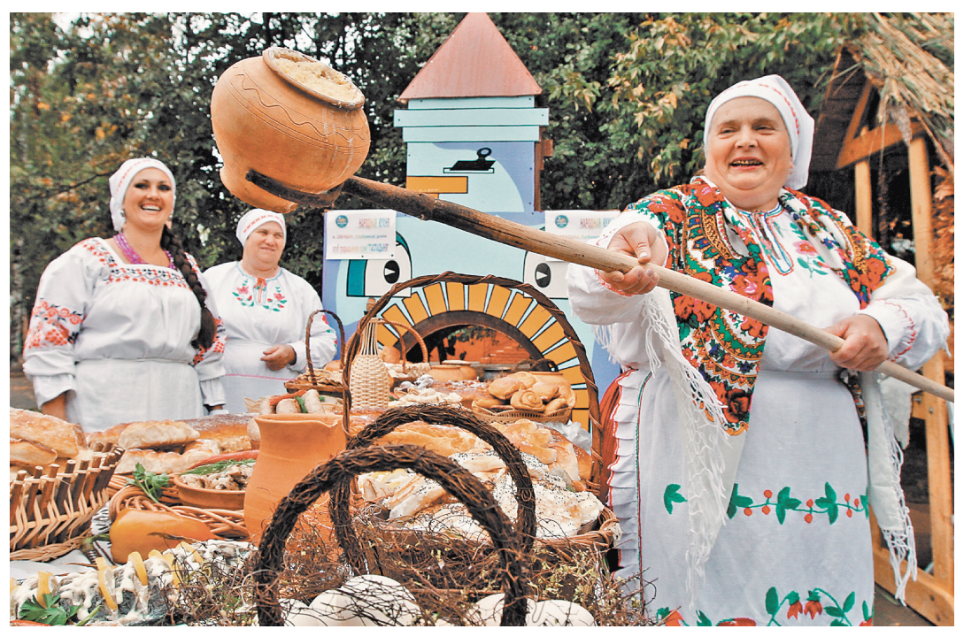
Это Дожинки! Каждый год в Беларуси выбирают столицу праздника и всем миром доводят город до блеска.

Есть в Беларуси праздник — «Дажинки». Праздник урожая. Каждый год выбирают город — «столицу» праздника. И доводят его до блеска. Даже строят ледовые дворцы и бассейны. Как вам эта традиция, Григорий Алексеевич?