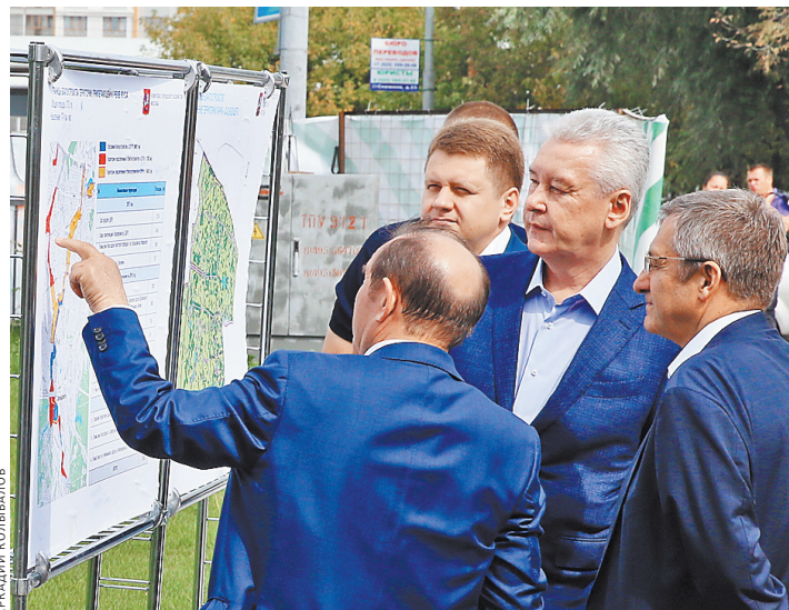
Сергей Собянин убедился, что в парке будут созданы условия для комфортного отдыха.

Как рассказали мэр, одновременно с парком благоустроивается и территория вокруг реки Яузы. «Последовательно несколько лет превращаем богом забытую и запущенную территорию в одно из самых красивых мест города, — сказал он. — Около 70 га сделали, в этом году сделаем еще порядка 80 га. В целом эта территория будет насчитывать около тысячи гектаров». Территория огромна, вокруг нее проживает около миллиона человек, заметил Собянин.