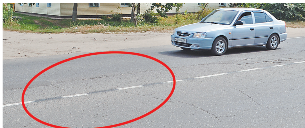
Самодельные «художники» решили исправить ошибку в разметке. За это им теперь грозит штраф.

Нашлись в Сердобке находчивые граждане, которые взяли лично провести работу над ошибками и поверх белой краски на асфальте нанесли черную, превратив сплошную линию в пунктирную. Однако подобное самоуправство тоже карается штрафом.