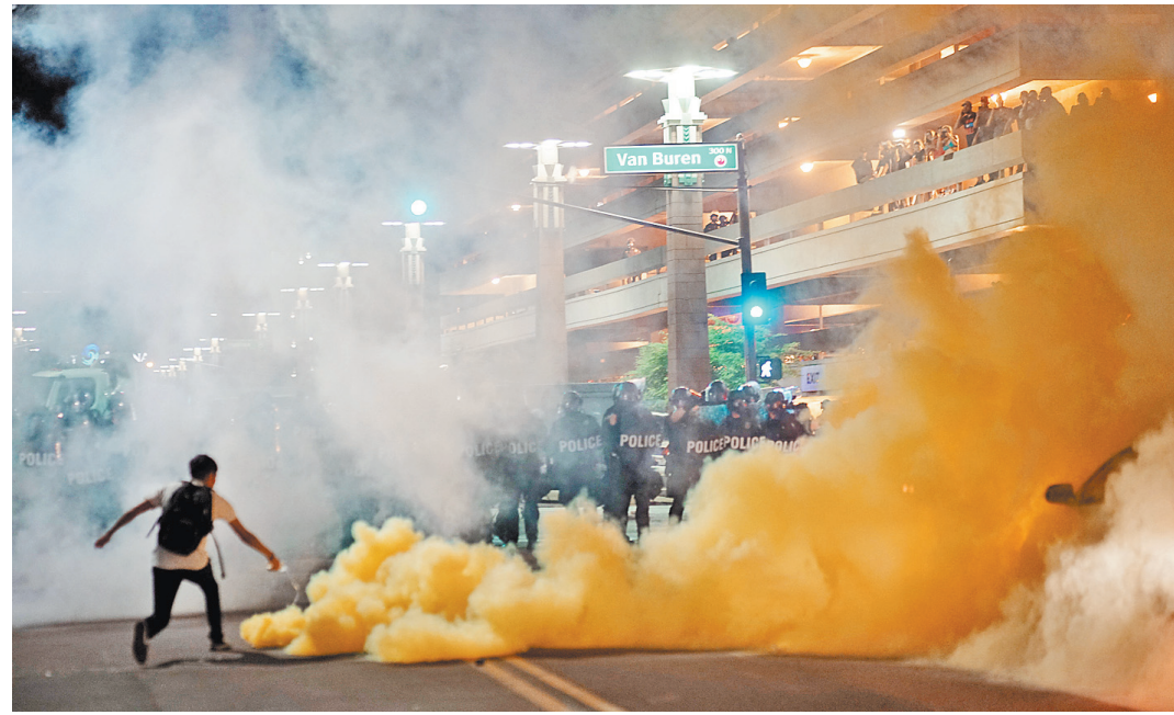
Полиция разогнала активистов, которые хотели сорвать выступление Трампа в Финиксе.

Тем не менее в поправке в закон об ассигновании на разведку, принятой комитетом по разведке сената США 14 июля, содержится требование к администрации Трампа предоставлять конгрессу отчет. В нем должно указываться, какая информация будет передаваться российской стороне. Именно сенаторы, а не Трамп, в конечном счете и будут решать, стоит ли Вашингтону в дальнейшем сотрудничать в сфере кибербезопасности с Москвой и нужно ли организовывать подобную рабочую группу.