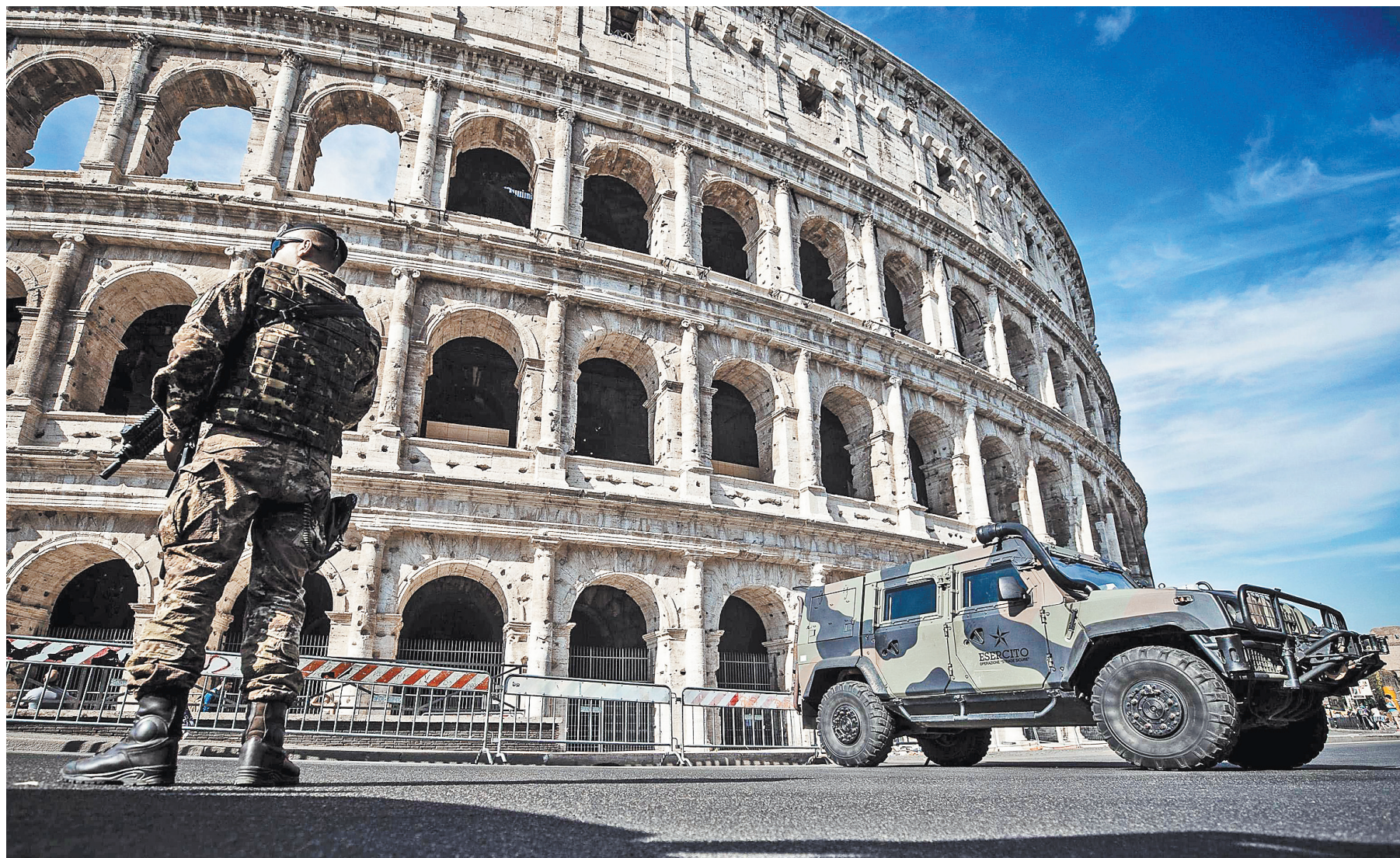
После терактов в Барселоне власти Италии оградил легендарный Колизей барьерами и усилили его охрану карабинерами.