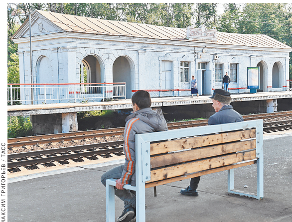
Исторический павильон остался только на фотографиях.

Между тем павильон на Рабочем Поселке можно восстановить. В «Архнадзоре» успели произвести обмеры и сделать подробную фотосъемку.