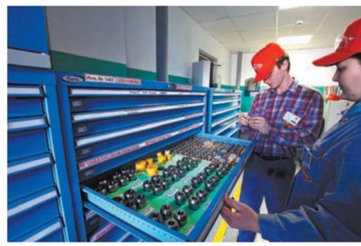
Хранение инструментов на складе.

нала — условия, которые позволяют полностью реализовать потенциал каждого отдельного сотрудника и коллектива компании в целом. Для бизнес-партнера — удовлетворенность в широком смысле слова качеством продукции и услуг компании, качеством ее инновационных решений, коммуникаций с ним, партнерских отношений. Для всей компании — ее процветание, развитие и стабильность на рынке. Для общества — вклад НПФ «Пакер» в процветание России и глобальный мира.