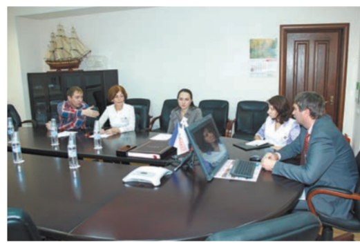
Фонд взаимопомощи — работники объединяются на добровольных началах для оказания взаимной товарищеской материальной помощи.