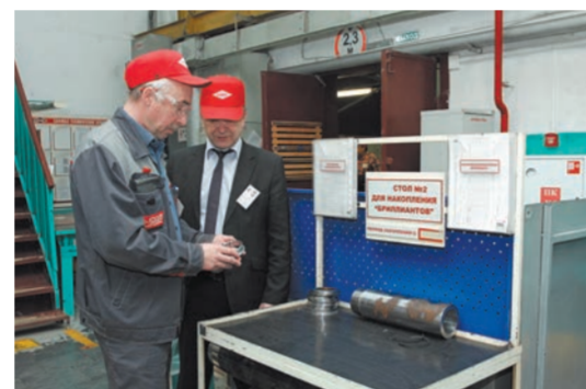
Стол для накопления «Бриллиантов». Обсуждение причины возникновения брака.