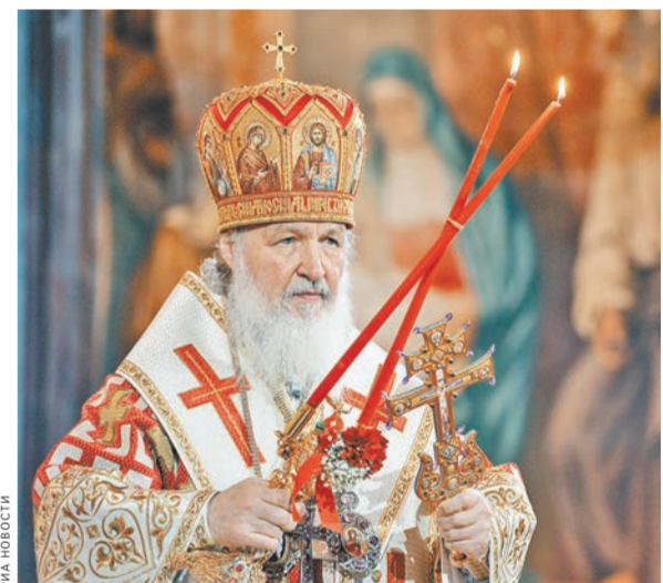
Патриарх Кирилл: Хорошо постичь хоть в малой мере то, что произошло почти две тысячи лет назад в лоне гроба Господня.

Воскресение Господа Иисуса — главное содержание христианского послания миру. Только благодаря Голгофской жертве, неразрывно соединенной со славным Воскресением, обретают смысл и ценность все человеческие деяния, направленные к Источнику всякого блага. Жертва Христова стала ответом на предпринимавшиеся людьми разных культур и традиций попытки поиска Живого Бога, ибо, по слову Священного Писания, Господь «нелицеприятен, но во всяком народе божащийся Его и поступающий праведно угоден Ему», и Он хочет, чтобы все спаслись и достигли познания истины. Эти напряженные усилия воплощали в себе чаяния и надежды миллионов людей, в разные времена тщетно искавших возможность преодолеть свое плачевное состояние и обрести подлинную «жизнь и жизнь с избытком».