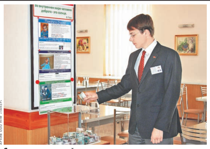
Ящик для пожертвований.

на торжественной церемонии вручения Книги благотворителей и Благодарственных писем Республиканского Фонда возрождения памяти истории и культуры Республики Татарстан, январь 2016 год.