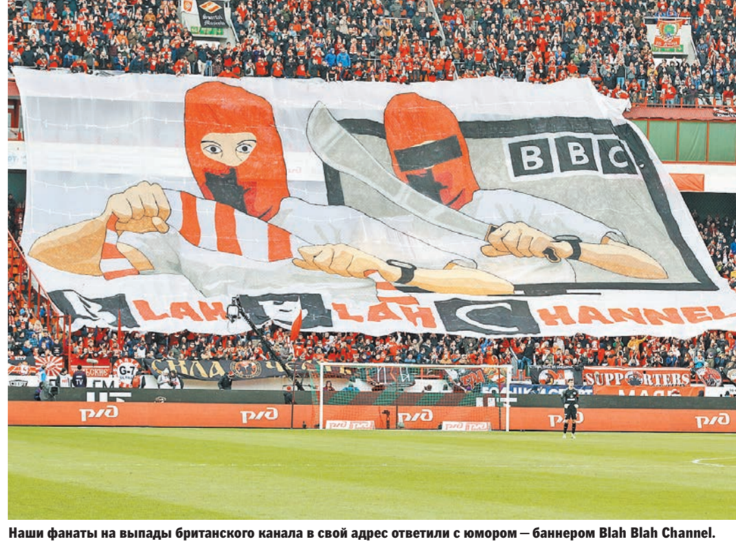
Наши фанаты на выпады британского канала в свой адрес ответили с юмором — баннером Blah Blah Channel.