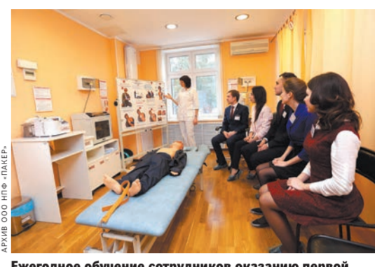
Ежегодное обучение сотрудников оказанию первой помощи.