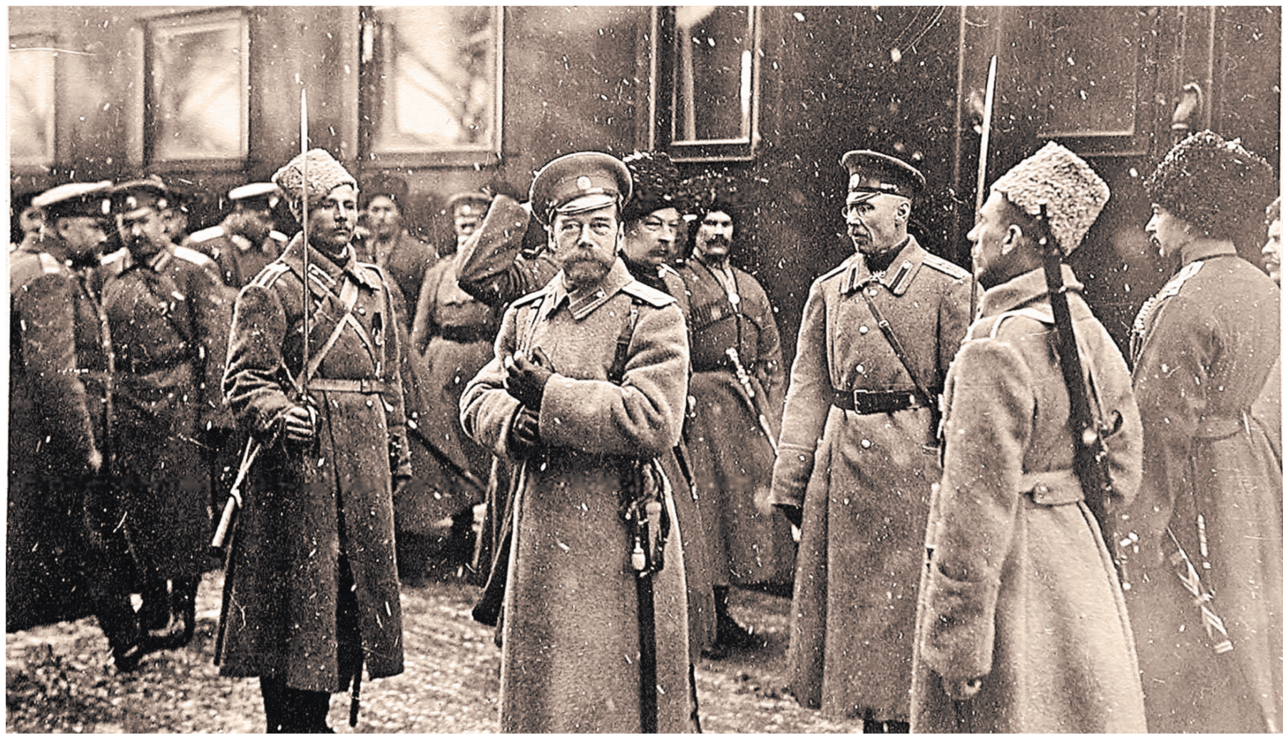
1916 год. Император Николай II в районе Двинска. Об отречении еще нет речи.