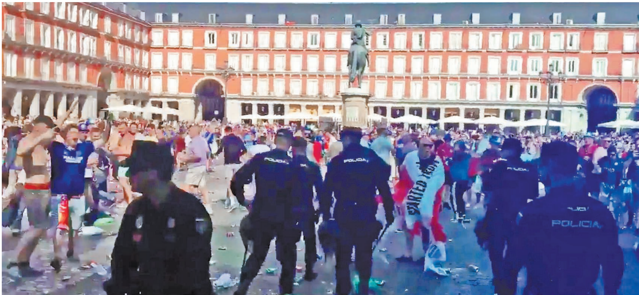
«Мирные и прогуливающиеся по улицам Мадрида болельщики английского «Лестера», как назвал их канал ВВС, по свидетельству очевидцев оказались хулиганами, которые вели себя как настоящие свиньи, устроив погромы.