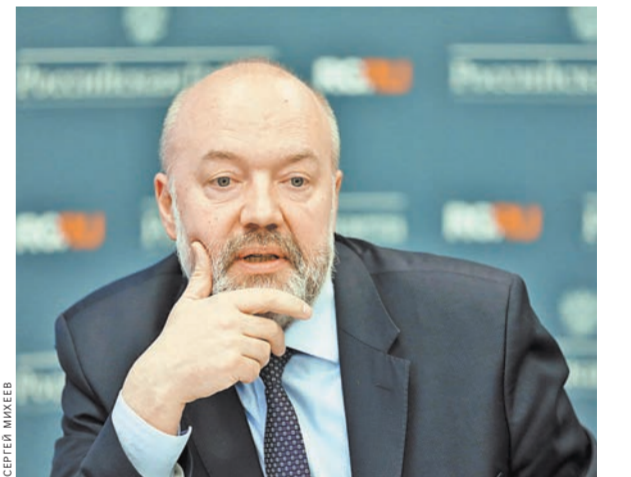
Павел Крашенинников передал денежный сертификат присужденной премии реабилитационному центру для детей.

Павел Крашенинников стал одним из первых министров юстиции новой России, а затем уже на протяжении 17 лет возглавляет Комитет Госдумы по законодательству. Он избран председателем Ассоциации юристов России, принимал активное участие в разработке базовых российских законов и кодексов, является автором более 160 научных работ. В их числе следует назвать литературные произведения, такие как «12 апостолов права» — книга о выдающихся юристах России. Примечательно, что первая глава книги посвящена Державину. А в Новгороде госуниверситете прошла презентация его книги «Времена и право». Павел Крашенинников является почетным доктором университета, выступает здесь с лекциями, участвует в семинарах и конференциях со студентами. Уникальный труд охватывает временной период с XXI века до н.э. — от Древнего Востока до античности и от Средневековья до первых кодифицированных актов XVIII — XIX веков. Принимая награду, Павел Крашенинников передал денежный сертификат новгородскому реабилитационному центру для детей и подростков с ограниченными возможностями.