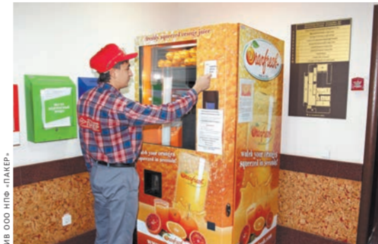
Аппарат по изготовлению апельсинового фреша.