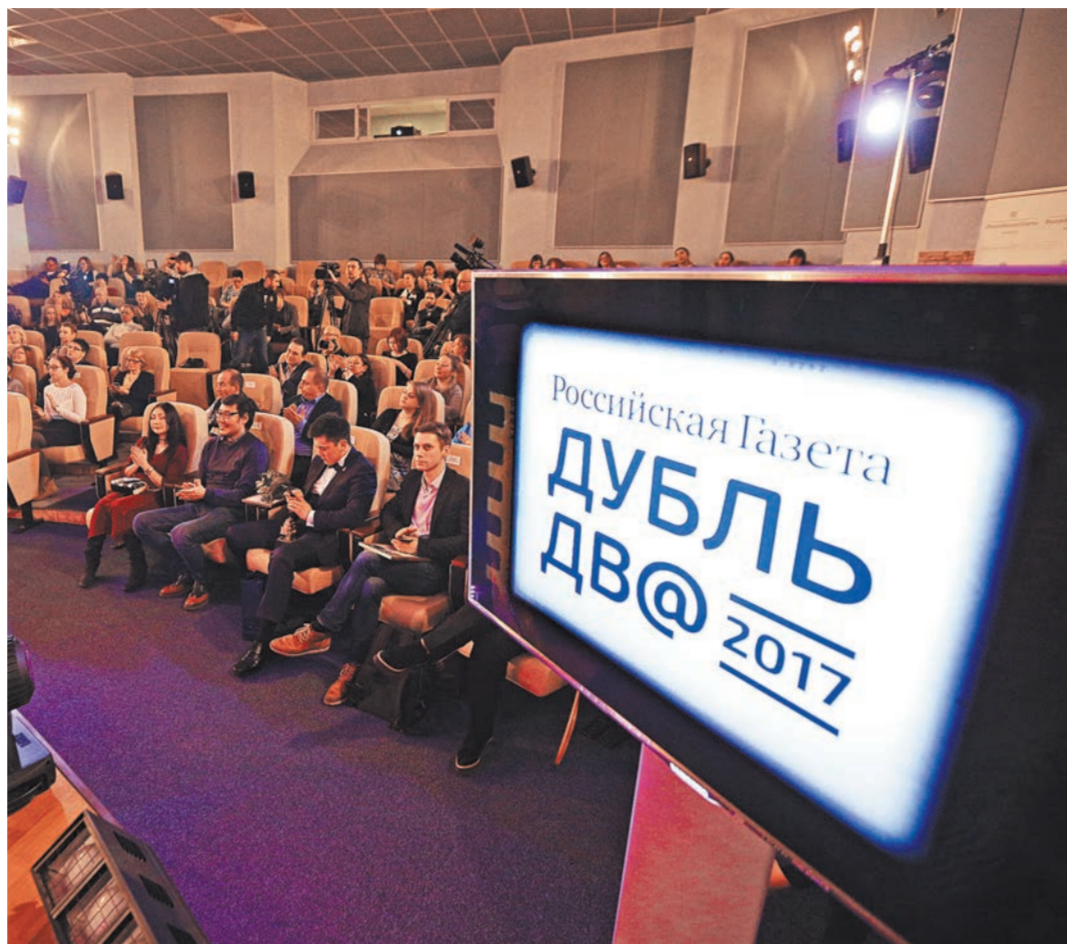
Российский фестиваль стал международным — его программу смотрели в редакции «РГ» и 84 странах мира.