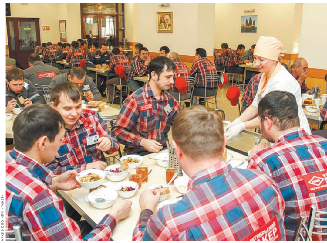
Вкусный и полезный обед для сотрудников предприятия.

но создавать хорошие привычки, — сказал однажды известный исследователь «феномена успеха» писатель Альберт Грей, — тогда плохие привычки бессознательно. Идеальный порядок в цехах и офисах, современное оборудование мировых производителей, фирменная спецодежда на каждом работнике, немедленное «дравствуйте!» к незнакомому человеку — уже с первых минут пребывания в «Пакере» замечаешь, как красота и обустроенность компании по всем прави-