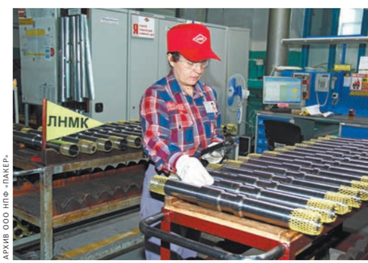
Лаборатория неразрушающих методов контроля.