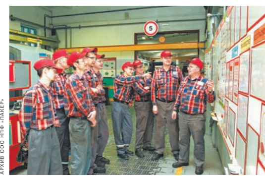
Обсуждение проблем в рабочей группе.