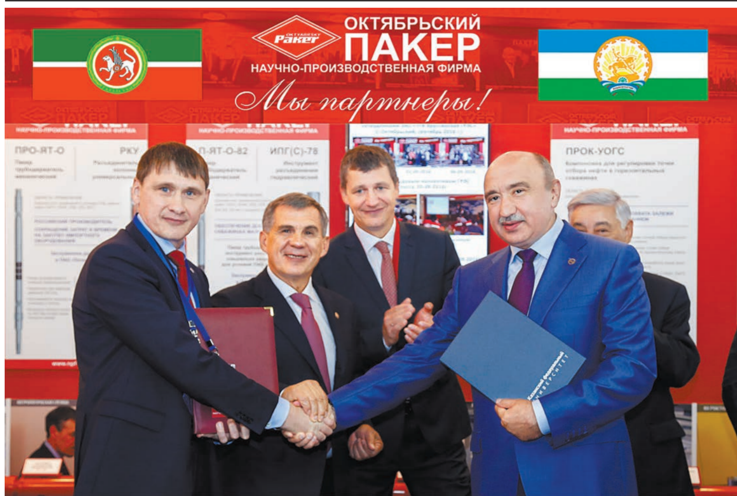
Подписание партнерского договора Казанского (Приволжского) федерального университета и НПФ «Пакер».