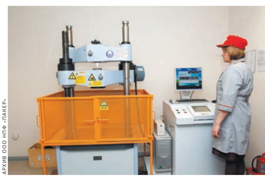
Центральная заводская лаборатория.