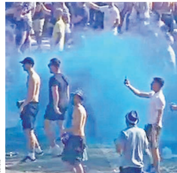
По фактам стычек с полицией десятков зачинщиков беспорядков с английскими паспортами были арестованы. Их имена занесут в «черный список», и в ближайшие годы выезд на футбол этим персонажам будет запрещен.

Павел Зарудный Британские фанаты вновь громко заявили о себе. Во время выездного матча 1/4 финала Лиги чемпионов между мадридским «Атлетико» и английским клубом «Лестер» фанаты с туманного Альбиона устроили погром на главной площади города, а после прибытия на место полиции вступили в рукопашную с представителями сил правопорядка. Корреспондент испанского издания «Мундо deportivo» сообщает, что англичане во время столкновений вели себя вызывающе, скандировали лозунги: «Испанские ублюдки, помните, что Гибралтар наш!». Также на любительском видео, которое попало в Интернет, можно увидеть, как находящиеся «под газом» «болельщики» поют песню времен Второй мировой войны: «10 немецких бомбардировщиков...» «Большинство из тех, кто дрался с полицией, вели себя как настоящие свиньи. Это не имеет ни-