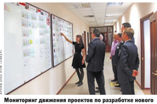
Мониторинг движения проектов по разработке нового продукта.