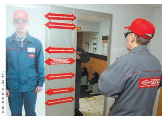
Стандарт использования спецодежды.