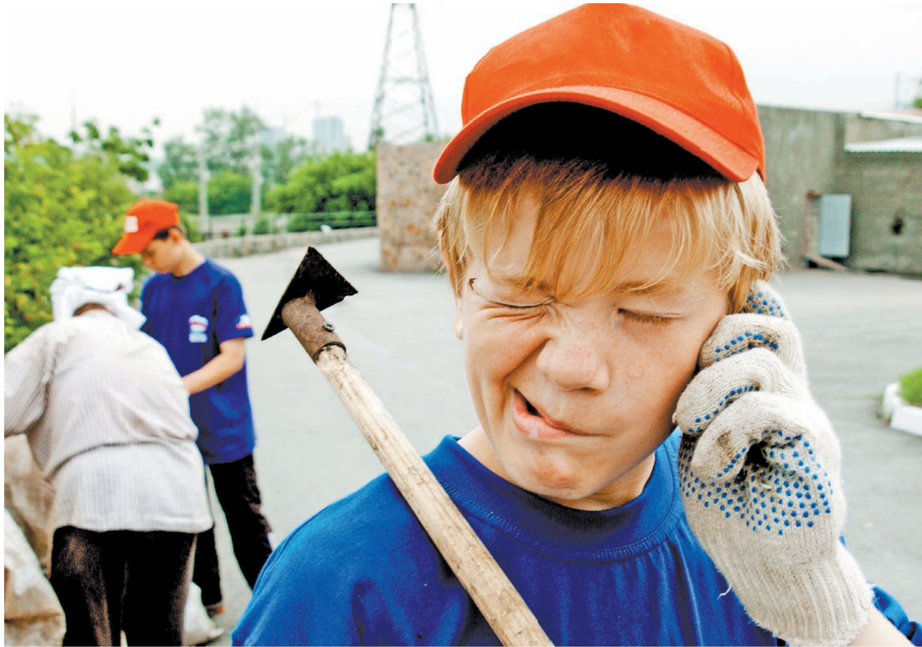
Виталий Школьников / ТАСС

1 Большинство ребят принимают на работу, не заключив с ними трудовой договор, показало исследование, проведенное НИИ. И не направив их на предварительный медосмотр. Кроме того, дети часто работают больше положенных по закону часов. И периодически их привлекают к тяжелому и опасному труду, на работы, которые законодательством запрещено выполнять несовершеннолетним.