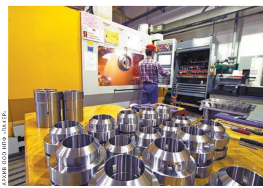
Участок станков с ЧПУ.