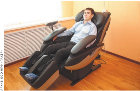
Медпункт предприятия оснащен современным оборудованием.