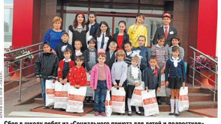
Сбор в школу ребят из «Социального приюта для детей и подростков».