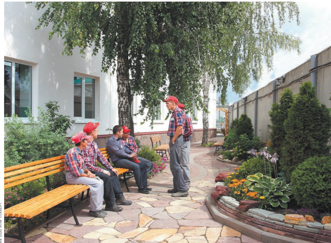
Летний сад для отдыха сотрудников на территории предприятия.

Какие же конкретные результаты должна дать процессная модель НПФ «Пакер», включающая более десятка ключевых бизнес-процессов? Их четыре. Для перес-