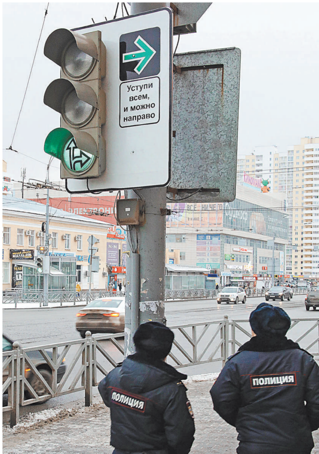
Новые экспериментальные знаки вызывают недоумение и у стражей порядка.