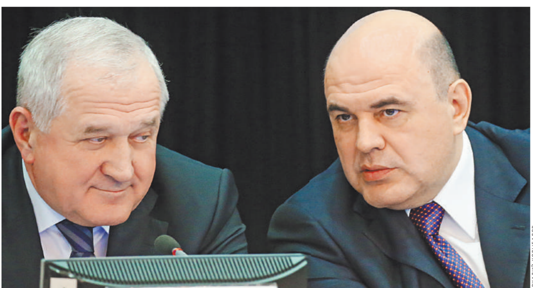
Михаил Мишустин (справа) и глава ФТС Владимир Булавин отметили эффективность совместной работы двух ведомств.