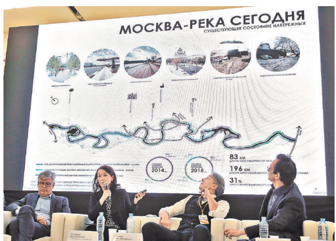
В Манеже архитекторы дискутировали, как обустроить берега Москвы-реки, большей частью занятые промзонами.

Смотрите фотогалерею на сайте rg.ru/sujet/1560