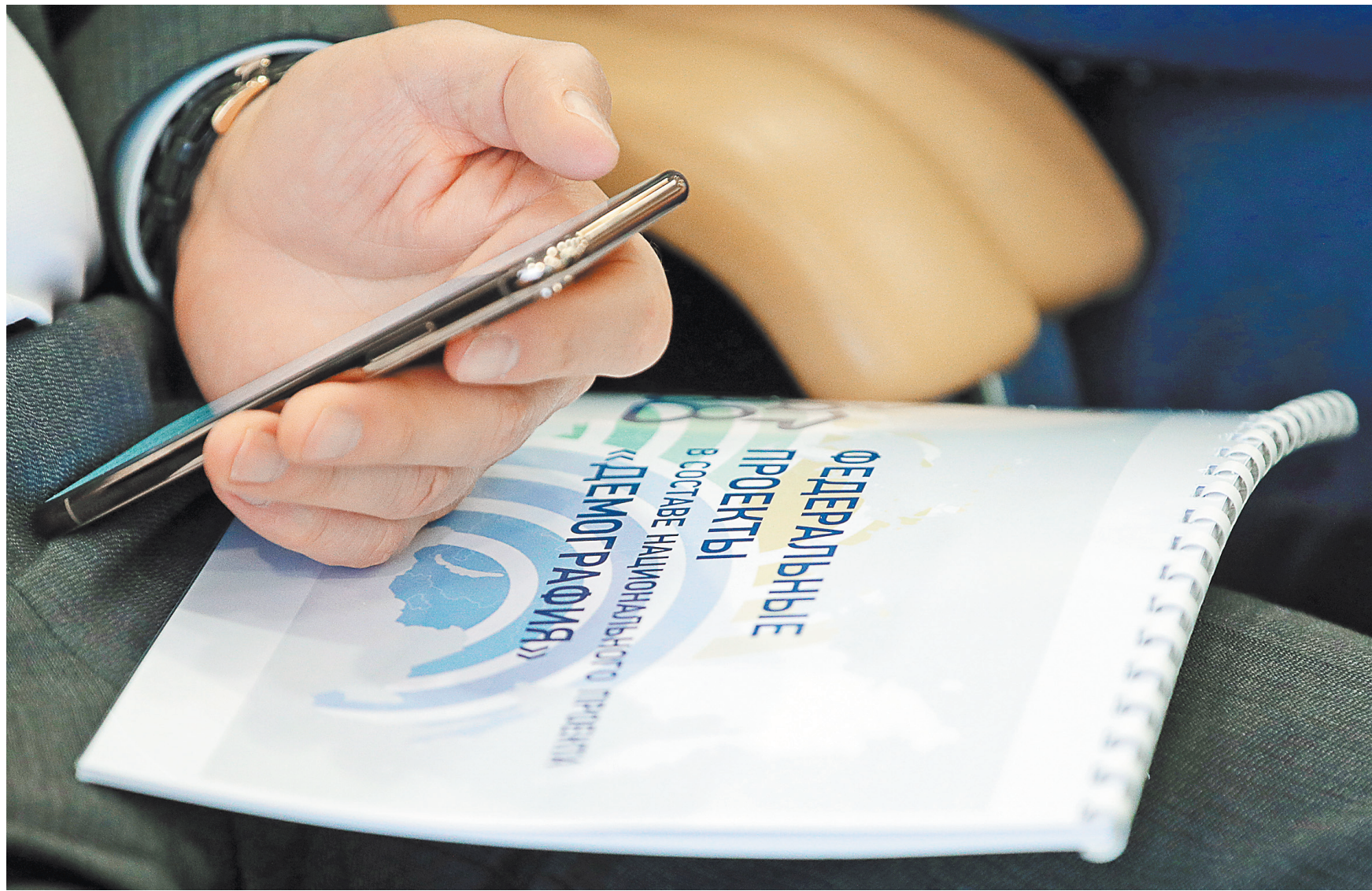
Сергей Ковалев