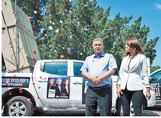
Такие пикапы с муляжами зенитных батарей использовала в агитационных целях партия «Авода», чтобы доказать свою способность обеспечить людям «социальный железный купол».

С высокой вероятностью создание коалиции пойдет по традиционному пути сохранения