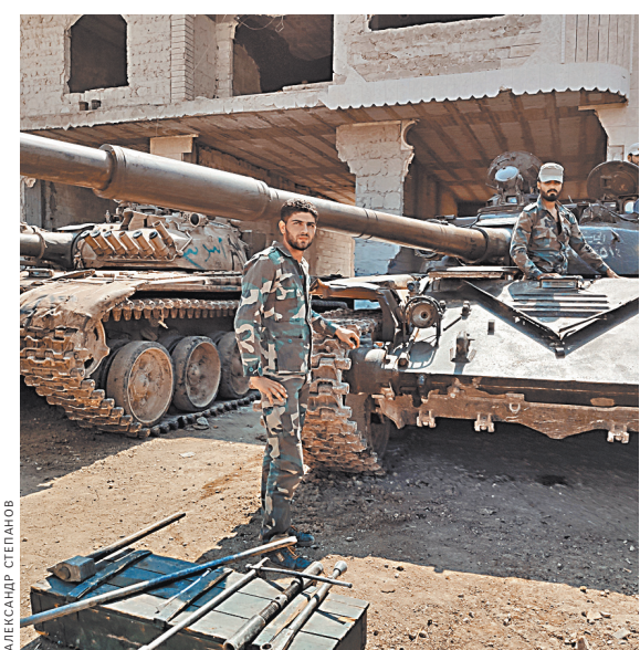
Рутинная лубя война: после боя сирийские танкисты в освобожденном Хан-Шейхуне приводят в порядок технику и оружие.

Возле десятка танков кипит работа. Сирийские военные чистят пулеметы, проверяют ходовую танков и моторные отсеки. Четверо танкистов, вооружившись банником, отчищают ствол от нагара. Затем смазывают