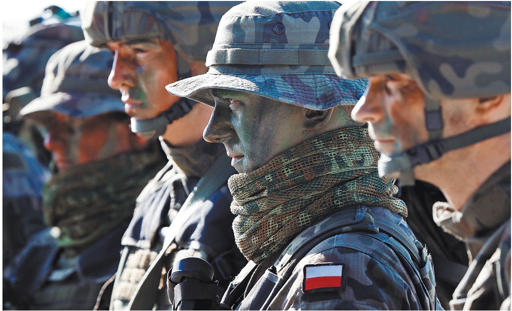
Специалисты считают, что модернизация польской армии носит «фасадный характер».