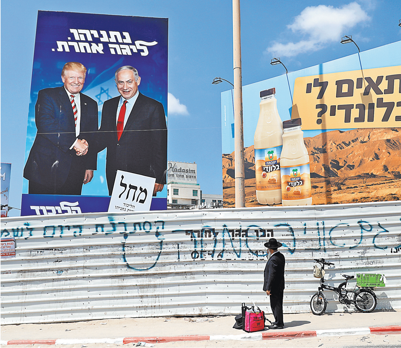
Жмущий руку Нетаньяху президент Трамп не смог помочь партии премьер-министра Израиля стать первой на выборах.

Однако самым большим сюрпризом на состоявшихся выборах стал успех партии «Наш дом — Израиль» во главе с Авидором Либерманом. Она почти в два раза (с 5 до 9 мандатов) улучшила прежний результат и теперь от того, к кому применит ее лидер, зависит, какое — правое или левое — у Израиля будет правительство. Либерман уже объявил торг за свою поддержку открытым. Речь не идет о должностях — глава «Наш дом — Израиль» уже побывал в прошлых кабинетах и министром иностранных дел, и министром обороны. Поэтому он уверен, что «весомый» пост получит и в новом правительстве. Куда важнее для Либермана, какая из политических сил, маящая его под свои знамена, выполнит требование «Наш дом — Израиль» о введении в школах ультраортодоксов общеобразовательных предметов. Это требование, воспринятое в штыки религиозными партиями, уже привело к развалу пре-