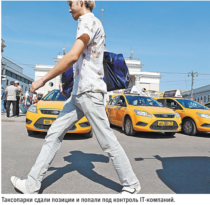
Таксопарки сдали позиции и попали под контроль IT-компаний.

По данным исследования Discovery Research Group, за первые шесть месяцев 2019 года российский рынок агрегаторов такси показал стремительный рост. Сейчас его объем оценивается более чем в 174,2 миллиарда рублей, притом что за весь 2018 год он составил 290,5 миллиарда рублей.