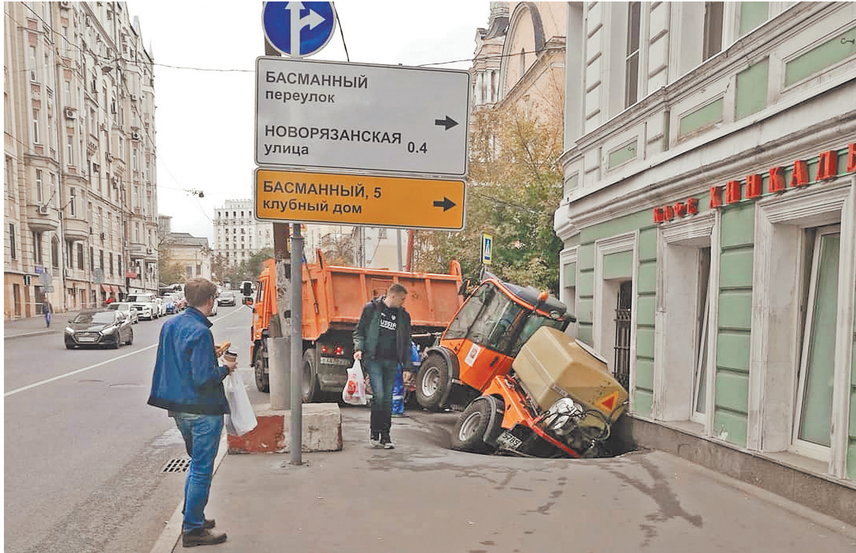
В центре Москвы на Новой Басманной улице вчера провалился асфальт. Провал площадью примерно 1 квадратный метр произошел на тротуаре, когда по нему ехала небольшая уборочная машина. Судя по всему, покрытие не выдержало тяжести спецтехники. В пресс-службе префектуры Центрального административного округа столицы «РГ» рассказали, что причиной провала могло стать подтопление грунта в результате дождей. Коммунальные службы вытащили застрявшую машину и приступили к ремонту аварийного участка тротуара.