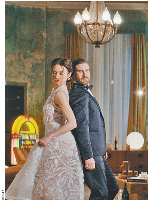
Супружеская пара вселяется в дом, а в нем — волшебная комната, исполняющая все желания.

У персонажей фильма «Комната желаний» налицо серьезные проблемы с головой, а именно с тем, что внутри нее происходит, — об этом вы тоже наверняка догадались. Режиссер Кристиан Волькман тринадцать лет назад сделал отчаянный фантастический нуарный мультфильм «Ренессанс» с Дániелом Крайгмом на озвучке, а больше с тех пор вроде бы ничего такого и не делал, кроме музыкальных клипов для ZAZ (французской певицы, а не завода, где «запорожцы» производят). И «Комната желаний» — такое фантастика, где-то немножко научная, возможно. Хотя вообще многим напоминает легендарный шедевр Томми Вайсо — далеко не одним лишь оригинальным заголовком. Знаете ли, когда в фильме звучит фраза «Ты использовала комнату, чтобы получить ребенка?», это на некоторые мысли наводит.