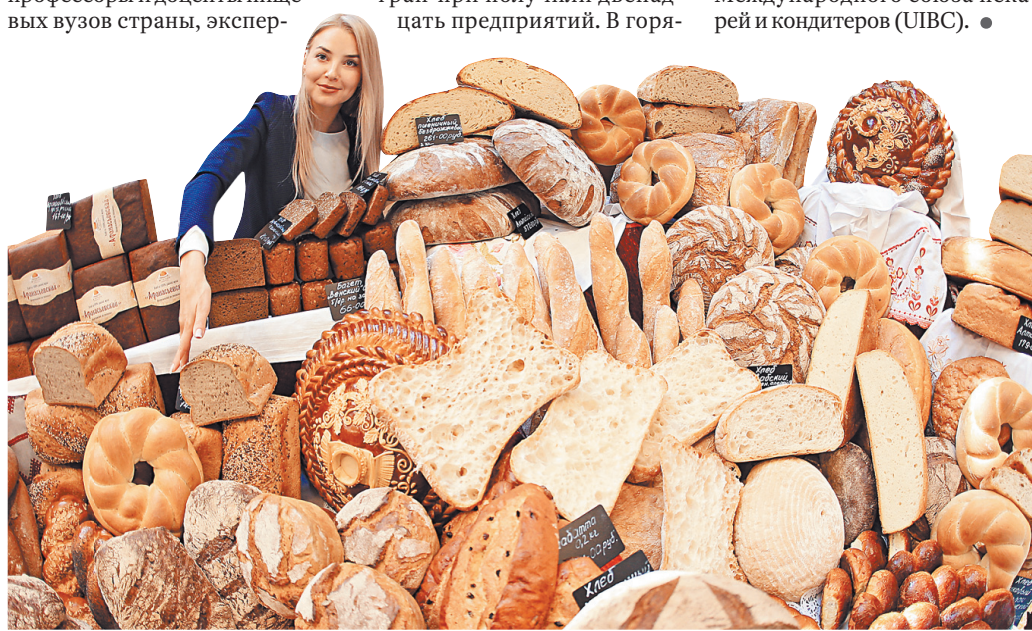
На форуме будет чему удивиться — пекари представляют десятки сортов вкуснейшего хлеба.

чую дюжину вошли хлебопеки из Владимира, Твери, Калининграда, Краснодара, Самары, Ижевска, Санкт-Петербурга, Орла, Нижнего Новгорода, а также подмосковных Пушкино и Королева. Свое мастерство хлебопеки из разных стран и областей будут показывать все четыре дня форума «Хлеб, ты — мир». Но это уже конкурс пекарей, а не сортов хлеба. В мероприятиях форума примут участие представители организаций потребительской кооперации, малого, среднего и крупного бизнеса из более 70 субъектов Российской Федерации. На форум приедут делегации из 50 стран мира, руководители крупнейших международных кооперативных организаций и объединений из Европы, Америки и Азиатско-Тихоокеанского региона. В рамках форума пройдут 71-й Конгресс Международного союза пекарей и кондитеров (UIBC).