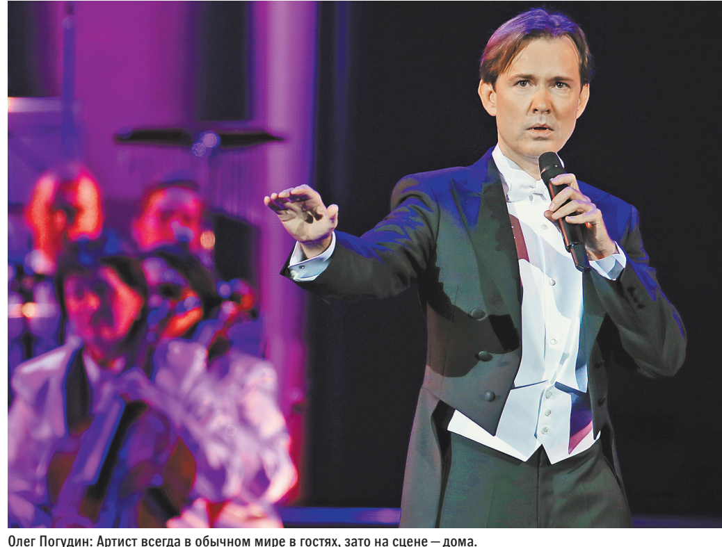
Олег Погудин: Артист всегда в обычном мире в гостях, зато на сцене — дома.

— о лучших премьерках читайте на сайте rg.ru/culture