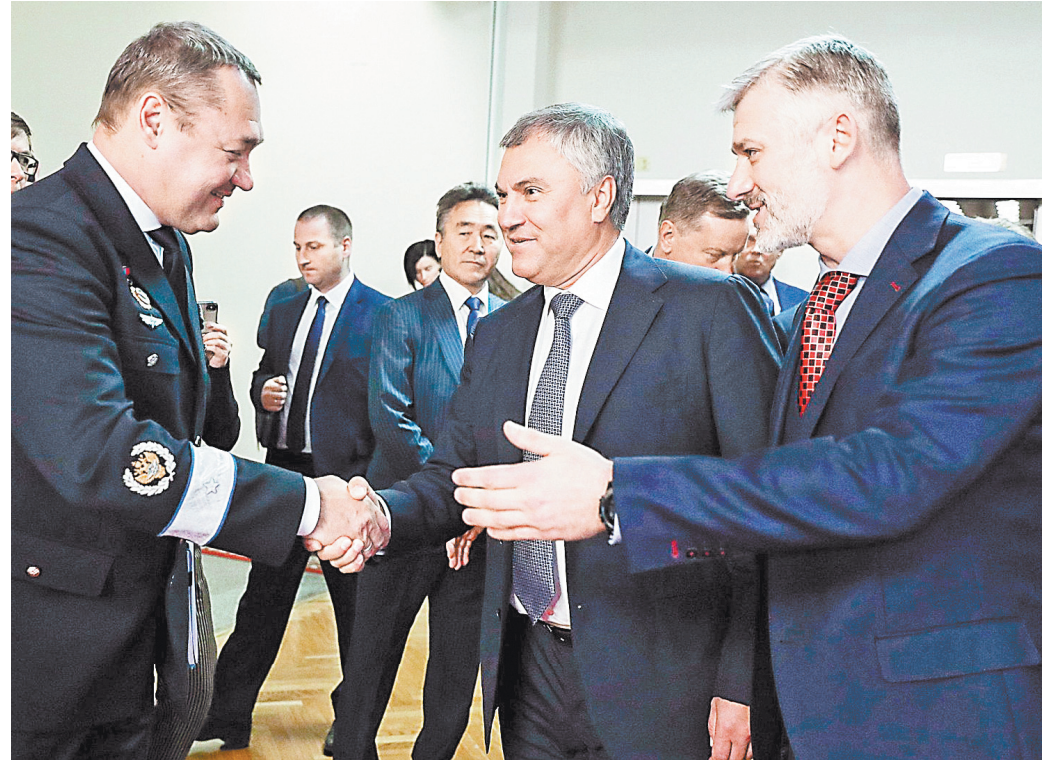
Вячеслав Володин во время посещения выставки.