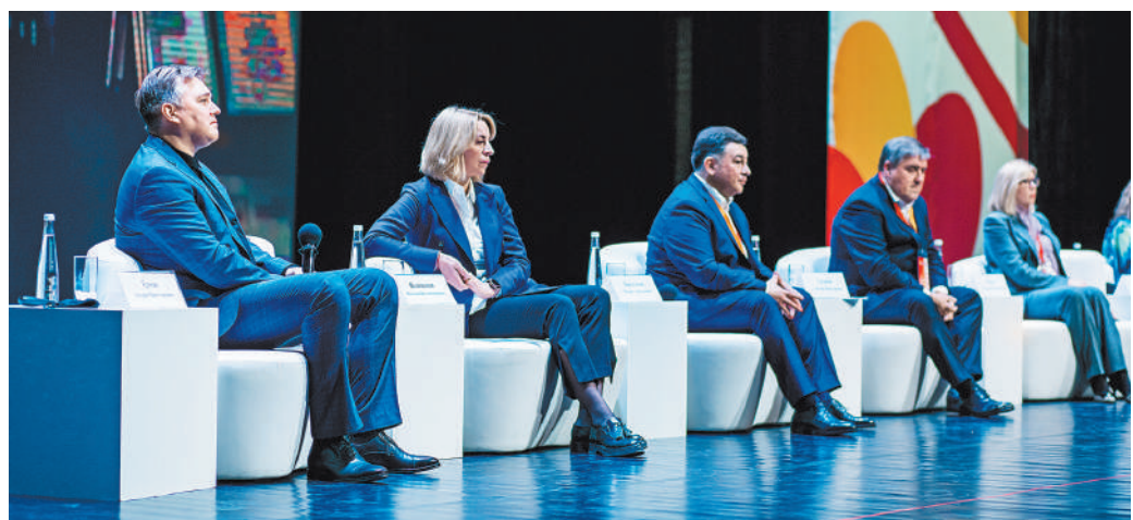
Одной из тем Балтийского культурного форума стало создание образовательных и музейных комплексов.