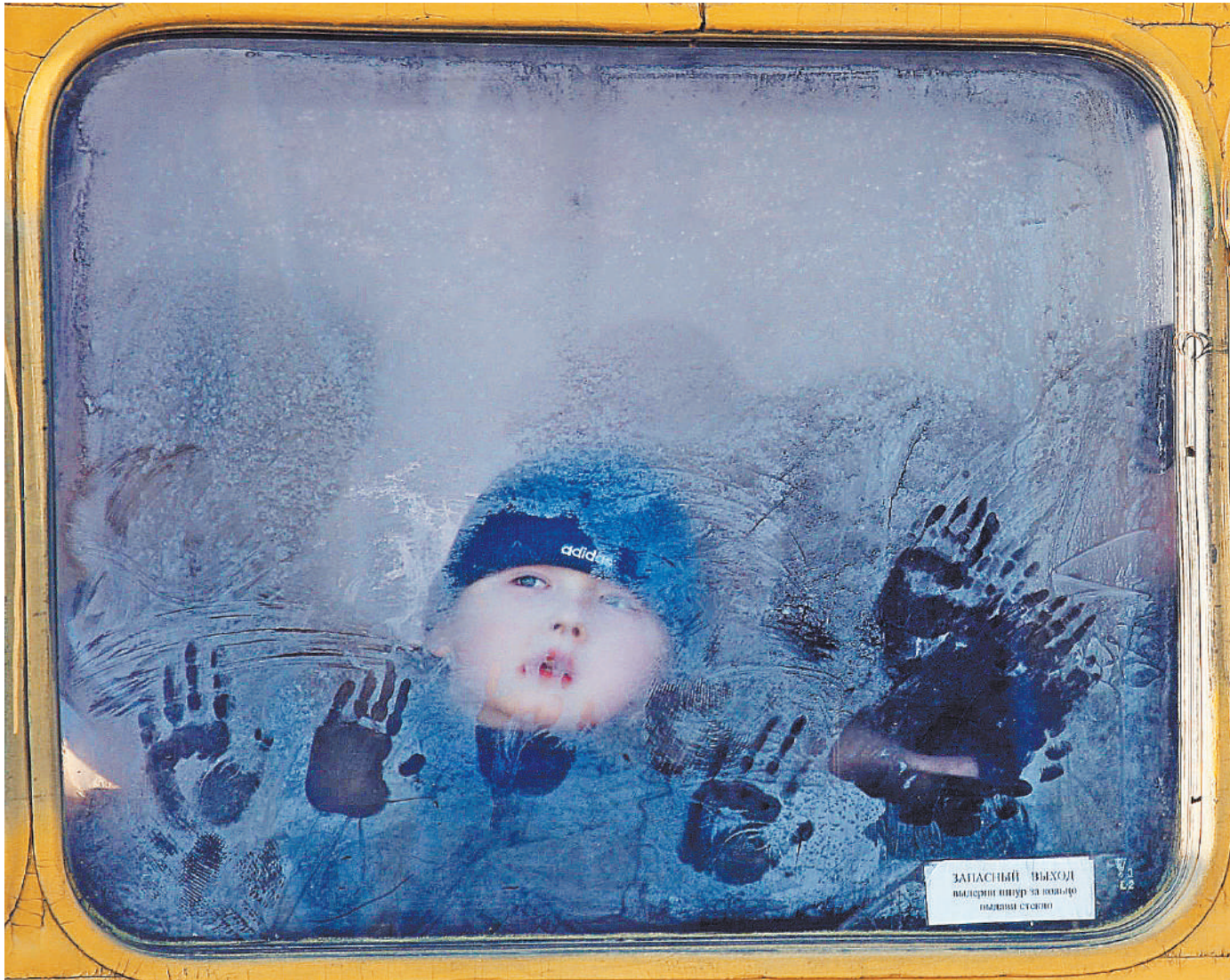
Высаживать безбилетных детей без взрослых теперь запрещено уставом автотранспорта. Правда, нужно еще внести изменения в КоАП, так как ответственность за такие действия пока не прописана. Раньше в подобных случаях приходилось применять статью УК «Оставление в опасности», но она чаще всего могла «работать» только зимой.