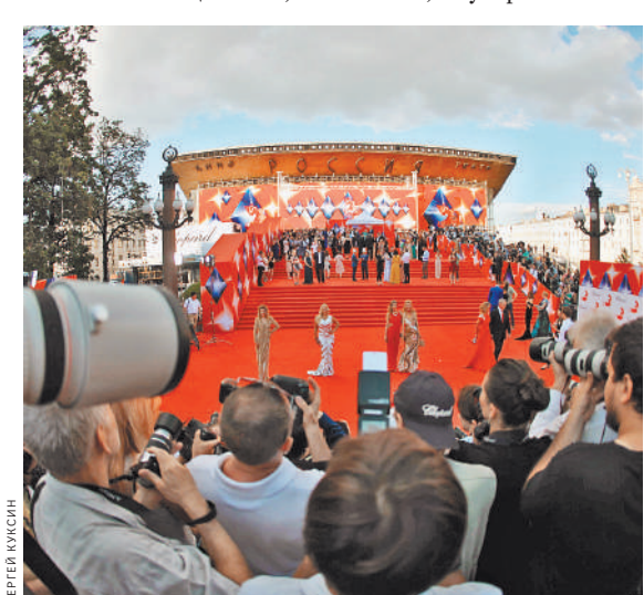
Московский международный кинофестиваль как главный киносмотр страны всегда получает поддержку минкультуры.

В список 45 рекомендованных фестивалей в 2020 году вошли 32-й Открытый российский кинофестиваль «Кинотавр», 15-й Международный кинофестиваль им. Андрея Тарковского «Зеркало», 41-й Международный студенческий фестиваль ВГИК, 29-й Фестиваль российского кино «Окно в Европу», 15-й Международный анимационный фестиваль «Большой фестиваль мультфильмов», Всероссийский фестиваль актуального научного кино ФАНК и другие. Полный список можно посмотреть на сайте минкультуры — он был опубликован в тот же день, когда и состоялось совещание. И, конечно же, не устроил всех.