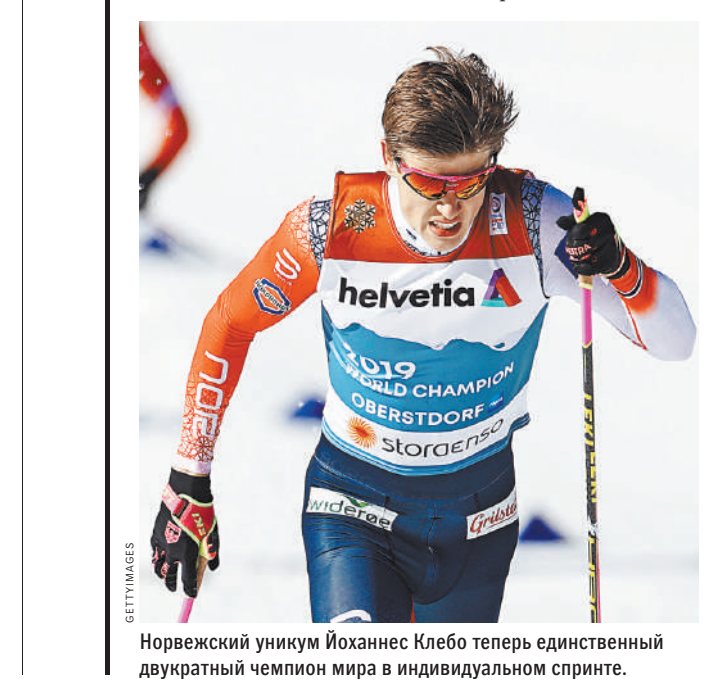
Норвежский уникум Иоханнес Клебо теперь единственный двукратный чемпион мира в индивидуальном спринте.

В решающем забеге спринта Большунов долго лидировал, но развязка наступила на последнем подъеме.