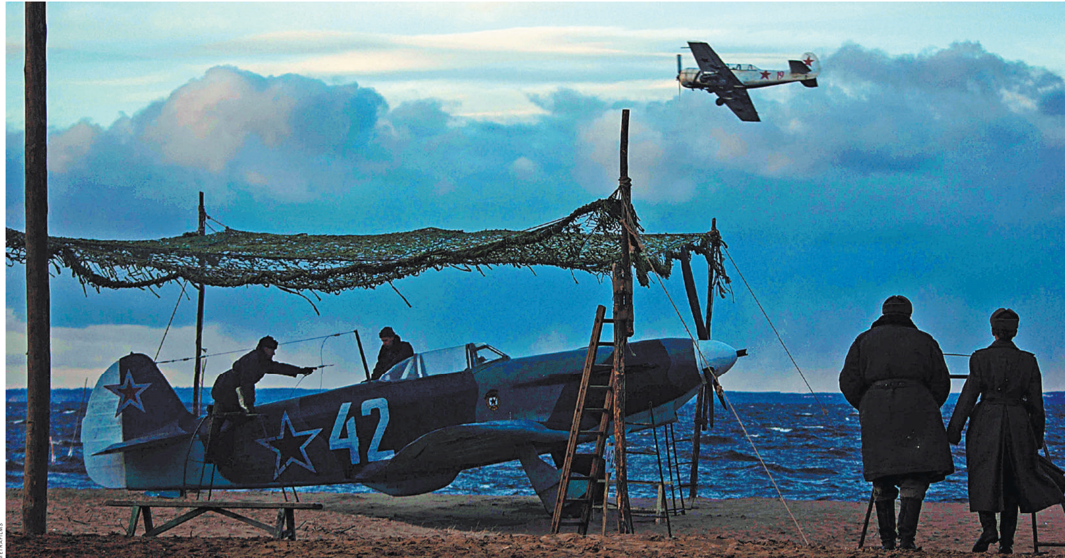
Кадр из нового фильма, над которым работает Алексей Герман, «Воздух».

Как вам кажется, ваш отец, знаменитый режиссер Алек-