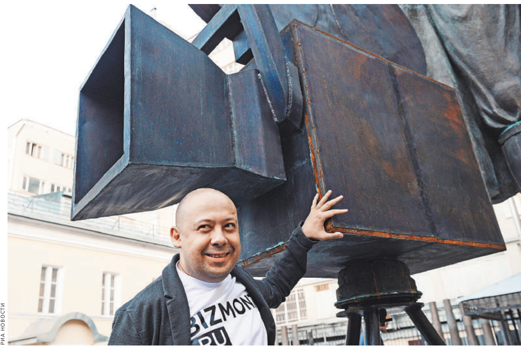
Алексей Герман: На войне было разное: и подвиги, и предательство. Но Победа народа, который прошел невероятные лишения и не сдался, — это повод для величайшей гордости.

Что такое Европа, и что такое Европа и Азия внутри нас, и как нас воспринимают европейцы, и является ли попытка создать мультикультурную Европу утопией. Послушайте, у нас уже сотни лет кто-то провозглашает, что Европа загнана. Ничего, существует. А если послушать европейцев, то мы должны были бы уже погибнуть много лет назад, распастаясь на маленькие государства