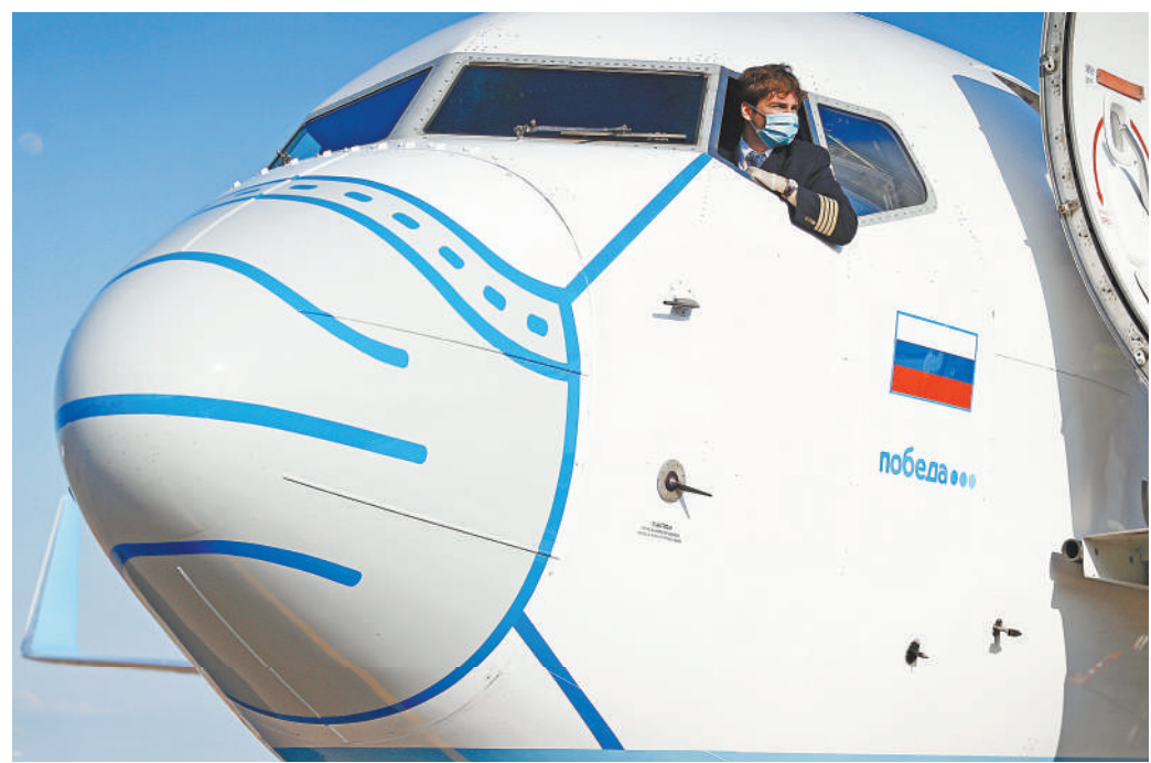
Российские авиакомпании будут подстраиваться под требования отдельных стран к въезжающим гостям.

По прогнозам минэкономразвития, в 2021 году реальные доходы увеличатся на 3 процента