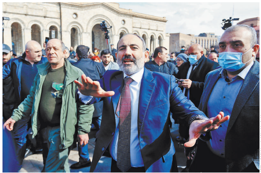
Премьер-министр Никол Пашинян вышел на площадь Республики заверить своих сторонников в том, что ситуация в Армении остается управляемой и гражданских столкновений из-за последних событий не будет.

Тем временем оппозиция организовала в центре Еревана митинг против действующего премьера — активисты с помо-