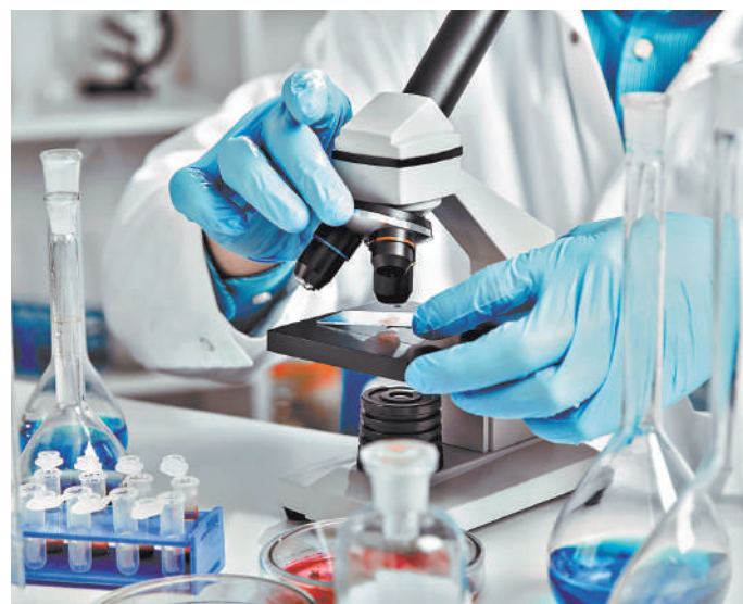
Если точность классической биопсии составляет 82 процента, то точность фьюжн-биопсии — 95 процентов.

Онкологи Национального исследовательского центра онкологии в Ростове-на-Дону