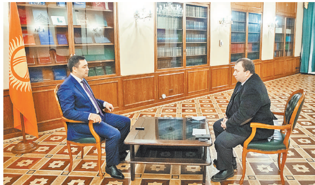
Беседа журналиста «Российской газеты» с президентом Кыргызстана Садыром Жапаровым проходила в зале «Библиотека» московского «Президент-Отеля».

САДЫР ЖАПАРОВ: Войлок имеет особую ценность для кыргызского народа, и в быту чокчинок он является незаменимым материалом. Поэтому я бы посоветовал туристам заглянуть на память изделия из натурального войлока. Что касается блюда, так как мясо занимает особое место в национальной кухне, я бы порекомендовал отведать уникальное блюдо кыргызских охотников — таш-корюк. Ну и, конечно, говоря о национальной кухне, нельзя не упомянуть наш знаменитый бешбармак. Он готовится почти во всех семьях нашей страны, и моя семья не является исключением, мы также любим это блюдо.