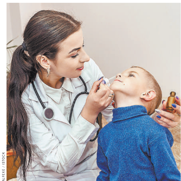
Слизистая носа — входные ворота для вируса. Именно там он встречается с иммунной системой.

Прототипы вакцин успешно прошли испытания на отсутствие токсичности и на иммуногенность (то есть способность стимулировать выработку антител). Теперь разработка будет тестироваться на наличие профилактического эффекта. Пока результаты подтверждают верность избранного подхода. Приволжский исследовательский медицинский университет заявил о готовности поддержать коллег с проведение доклинических и клинических испытаний. Если нижегородским ученым в ближайшее время удастся найти инвесторов и партнеров для внедрения проекта в жизнь, то выпуск новой вакцины не за горами.