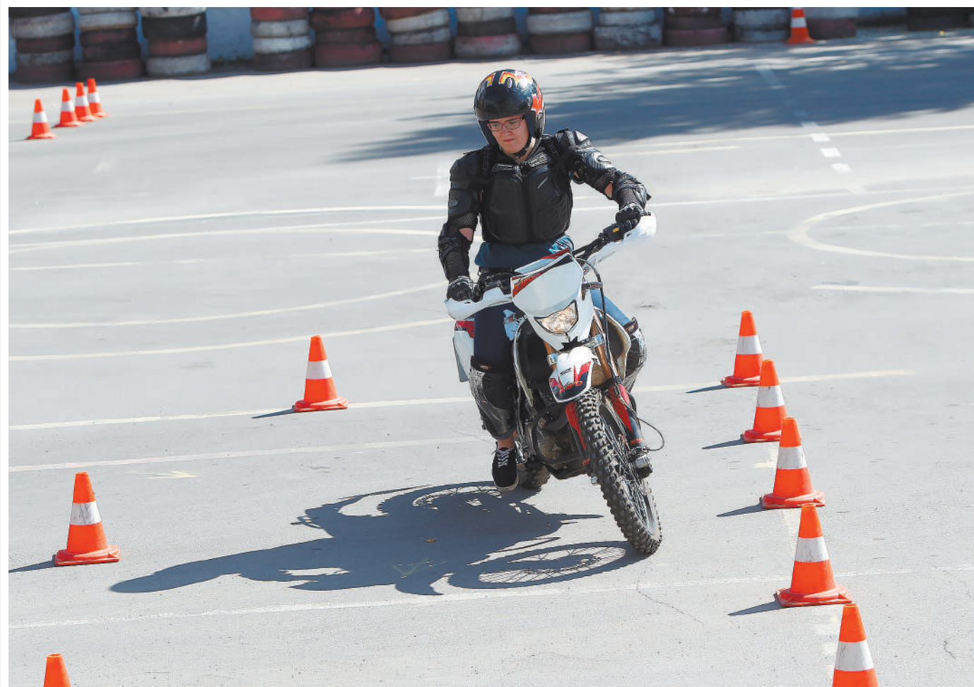
Мотоциклисты будут сдавать экзамен по-прежнему на площадке.

Материал подготовлен в рамках реализации федерального проекта «Безопасность дорожного движения» национального проекта «Безопасные и качественные автомобильные дороги».