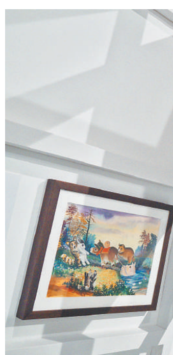
О неизвестной жизни этих картин и их оборотной стороне теперь можно будет узнать на выставке в Московском музее современного искусства.