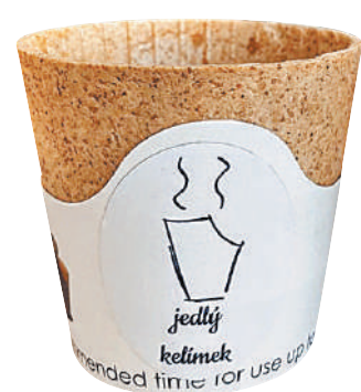
Чашка «2-в-1» — сначала выпил из нее кофе, а потом ею и перекусил.