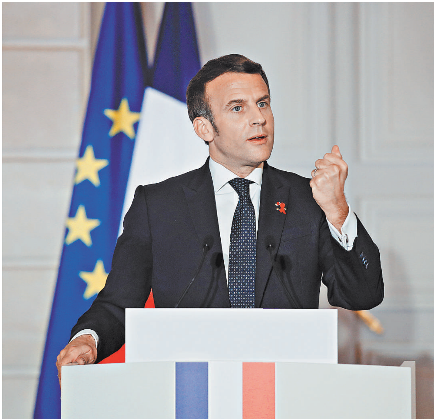
Макрон пугает сограждан внешними врагами, словно не замечая, как внутренняя междуоубица из-за нехватки вакцин разрушает ЕС.

Еврокомиссия угрожает несо- знательным производителям европейской вакцины AstraZeneca, которые не вы- полняют обязательства перед ЕС и продают препарат на сто- рону — не входящим в состав Евросоюза британцам.