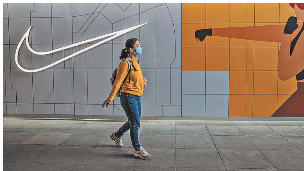
Жители Китая дали жесткий отпор попыткам западных брендов вмешаться во внутренние дела своей страны.

Напомним, что США, ЕС и Британия считают, что Китай якобы преследует мусульман- уйгуров — коренное население северо-запада страны, которое живет в СУАР. Китайские власти расценивают такие оценки как вмешательство во внутренние дела страны. Как отреагировал официальный представитель МИД КНР Хуа Чуньин, запад забывает- ся не об уйгурском народе, а о том, чтобы подорвать безопас- ность и стабильность Китая, помешать его дальнейшему раз- витию. Хуа Чуньин провела парал- лель с конфликтом 2003 года в Ираке, когда США вторглись на территорию страны на том основании, что у Ирака есть «оружие массового уничтоже- ния», наличие которого впослед- ствии не подтвердилось.