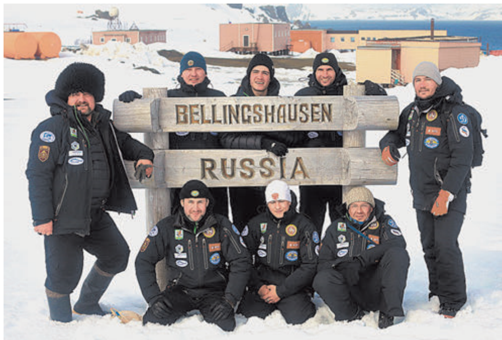
Антарктическая станция Беллинсгаузен встретила россиян обилием снега, но тепло.

чтобы в условиях высокогорья повысить физические кондиции.