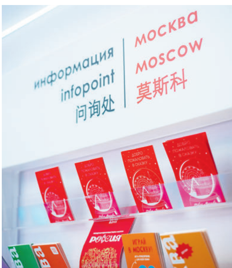
Именно Москва летом на полях ПМЭФ-2023 первой заключила с «Роснефтью» соглашение о взаимодействии в сфере туризма.

«Для создания комфортных условий автолюбителям, предпочитающим путешествовать на машине, «Роснефть» запустила специальную информационно-сервисную платформу. Проект позволяет автотуристам выбрать и спланировать маршрут по интересным местам через инфраструктуру придорожных сервисов и АЗС «Роснефти». У проекта «Горизонты России» есть ряд ключевых отличий от аналогов. Благодаря уникальному навигационному функционалу, все интересные локации становятся остановками маршрута, который автотурист может самостоятель-