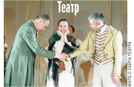
ФОТО С СМЯТА ТЕАТРА

Теперь об этом грубым, срывающимся от гнева голосом вопиет и Роман Полански. Единственные персонажи, вызывающие у него не презрение, а сочувствие, — бессловесные горничные и другая обслуга отеля. Пока богачи обжариваются и упиваются в хлам, они встречают новый век в подсобке, напевая «Интернационал». Но власть и деньги имущие это предупреждение не слышат... ■