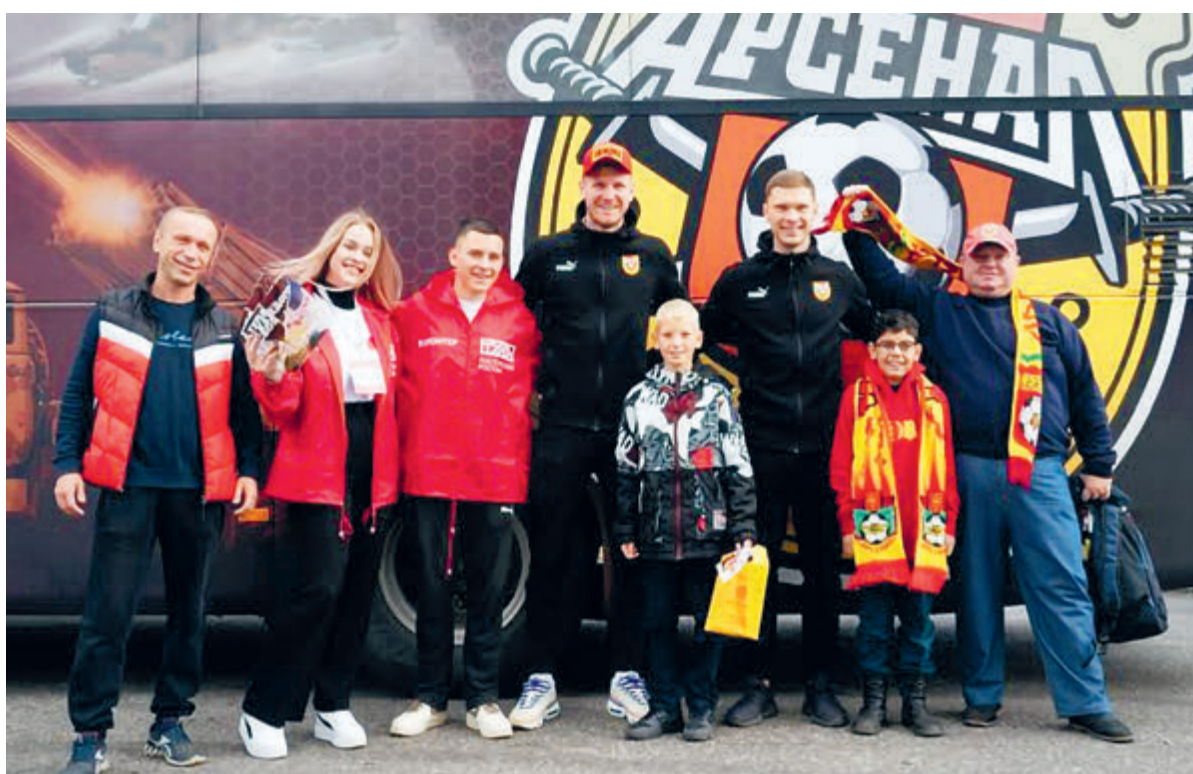
На полях выставки «Россия» объявлено о старте нового проекта «Путешествуй в Тулу с «Роснефтью».

Туристам предлагается посетить Тульский кремль, обновленную Казанскую набережную, Музейный квартал и Ясную Поляну, а также увидеть инопланетные пейзажи Кондуков, живописный Богородицк и легендарное Куликово поле