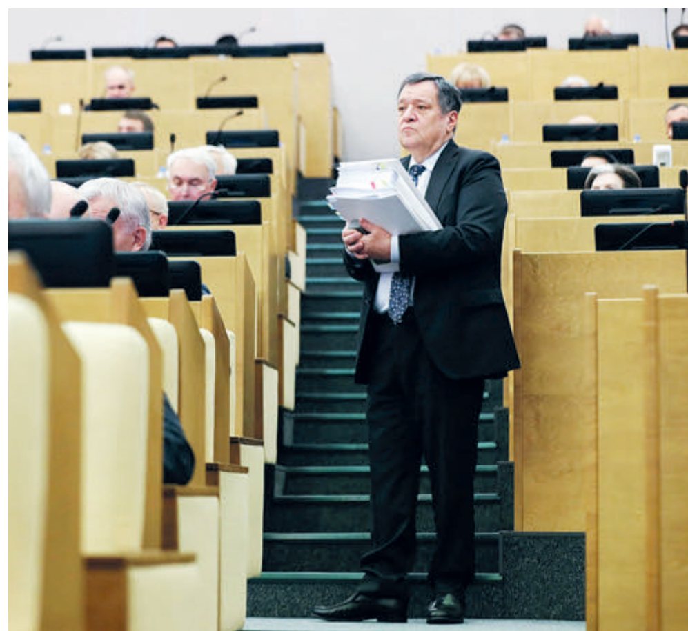
Глава комитета Госдумы РФ по бюджету и налогам Андрей Макаров ищет резервы для бюджета-2024.