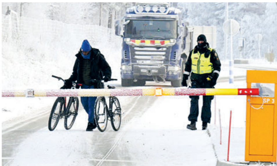
Финский пограничник и беженец на пограничном переходе в Салле на севере страны.