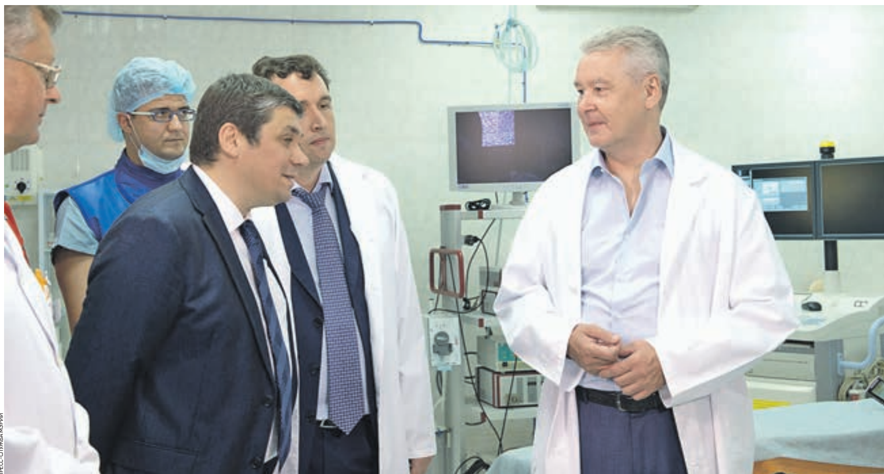
18 августа 12:50 Директор Департамента здравоохранения Севастополя Юрий Восканян (слева на первом плане) знакомит мэра Москвы Сергея Собянина (справа) с работой Городской больницы № 1 имени Пирогова. Москва помогает городу-побратиму, поставляя в Севастополь медоборудование, коммунальную технику, спортивный инвентарь

— Мы всегда активно сотрудничали с Севастополем — городом-побратимом, и наша связь насчитывает десятки и сотни лет, — подчеркнул Сергей Собянин. — В последние годы эти отношения становились все более и более интенсивными. В 2014 году по поручению президента России распределено шестство регионов страны за Крымом, за Севастополем. Мы развернули большую комплексную программу сотрудничества в области образования, социальной сферы, культуры, в части поставок коммунальной техники, транспорта. Одна из них — это программа модернизации здравоохранения.