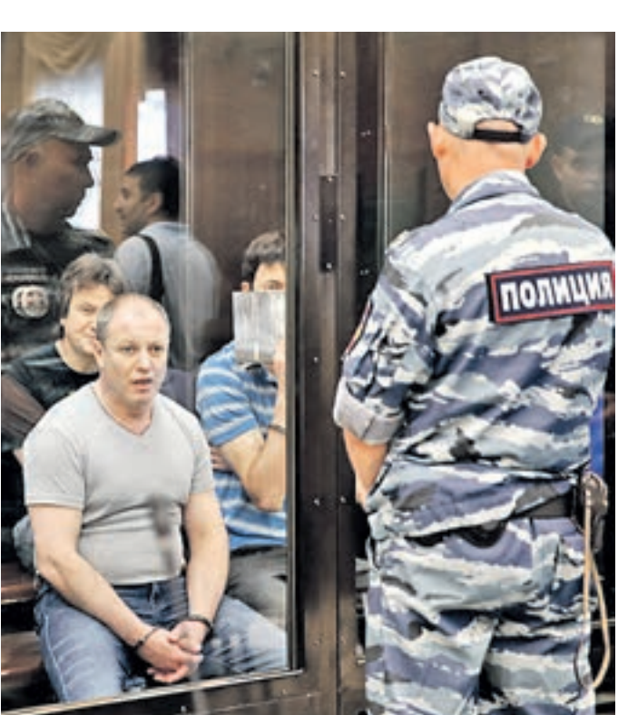
13 августа 15:00 Обвиняемые по резонансному делу банды «экстрасенсов» на сьемке подсудимых перед началом оглашения приговора