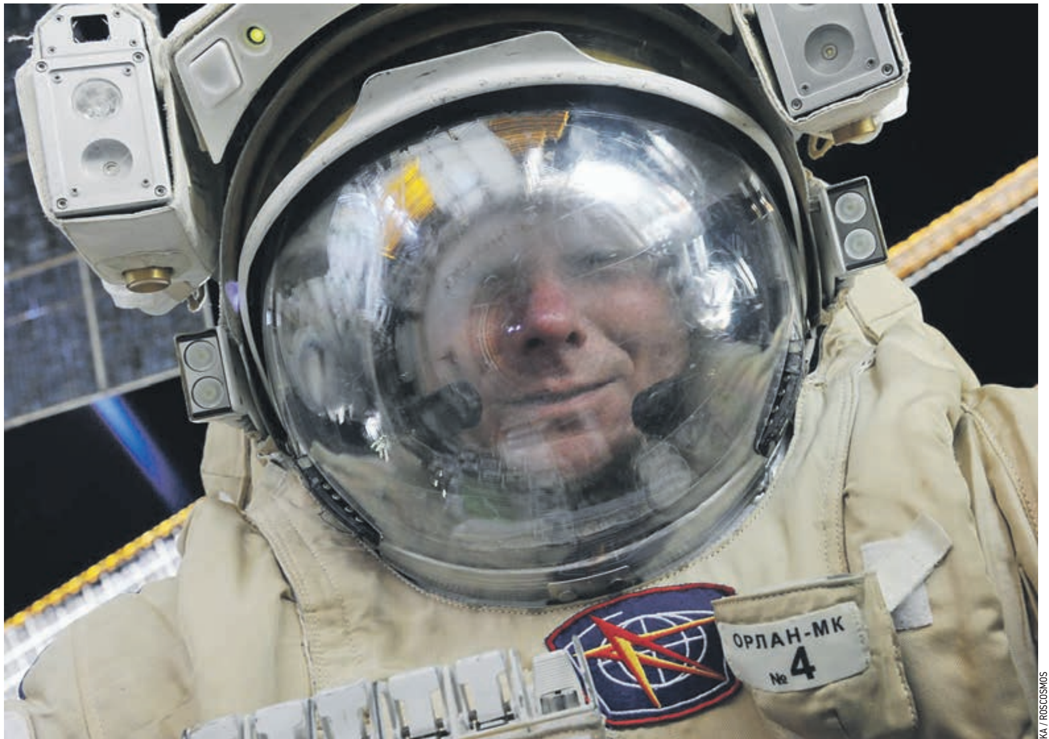
ТОЧКА Сегодня точку в номере ставит летчик-космонавт Геннадий Падалка, который сделал селфи в открытом космосе. О том, сложно ли сделать такой кадр, нам рассказал его коллега, Герой России Антон Шкаплеров: «Как я понимаю, он сделал снимок на камеру GoPro. Скорее всего, он ее закрепил на штативе. Обычно перед выходом в космос камера устанавливается в специальный бокс с толстой кнопкой, которую можно нажать в толстых перчатках». В соцсетях космический снимок активно обсуждают: так, один из пользователей заявил, что после фото Падалки любые другие селфи просто бессмысленны.

под запретом. Да, она о трагических судьбах талантливых людей, ироничная, с подтекстом, со стихами Гумилева, но без крамолы! Видимо, ирония приглянулась не по вкусу руководству страны... Картины смотрели даже в Кремле — поскольку в ней показано белогвардейское движение. Князя играл Марлен Мартьянович Хуциев, участвовавший в съемках из огромной любви к живописи — он когда-то мечтал быть художником. Но фильм не понравился тогда власти и был запрещен в нашей стране. А вот в мировой кинопрокат как-то просочился и шел с большим успехом. В Германии «Гори, гори, моя звезда» из всех советских картин по популярности занимает второе место — после фильма Андрея Тарковского «Сталкер». Откуда возникла идея фильма? Из моего страстного желания снять кино о своем любимом художнике Марке Шагале. К сожалению, в те времена Шагал был под запретом в СССР. И тогда я придумал героя Олега Ефремова — деревенского художника Федора и его историю. А уже через 40 лет моя мечта исполнилась — я снял фильм проживо, настоящего Марка Шагала «Шагал-Малевич». Но «Гори, гори, моя звезда» навсегда останется моей любимой картиной. Я часто ее пересматриваю, чего не делаю с другими картинами. Например, мне в голову не приходило пересмотреть «Экипаж», а вот «Звезду» вспоминаю.