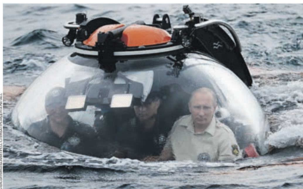
Вчера Президент России Владимир Путин (справа) погрузился в батискафе на дно Черного моря у берегов Крыма. Глава государства осмотрел корабль, затонувший в X–XI веках, и отметил, что это погружение — «очень хороший повод еще раз убедиться в том, насколько глубоки наши исторические корни, насколько глубока наша история взаимоотношений со всем миром». Владимир Путин также поздравил Русское географическое общество со 170-летием и рассказал журналистам, что ему было не страшно совершать погружение. «Мы же на Байкале опускались на глубину почти две тысячи метров на отечественных аппаратах «Мир», — напомнил президент.