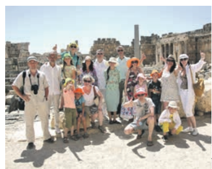
27 июня 2016 года 14:23 Ученики Московской гимназии имени Грибоедова в храмовом комплексе города Баальбека