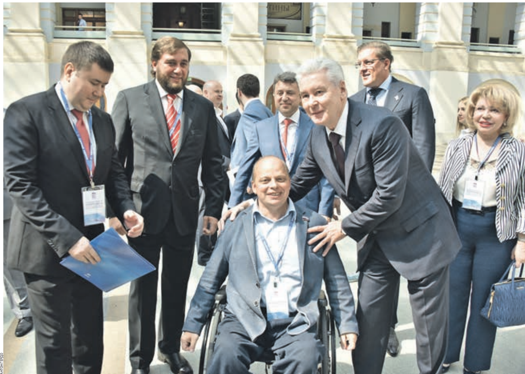
Вчера 10:45 Мэр Москвы Сергей Собянин (справа) и депутат Госдумы Владимир Кругленников (в центре) вместе с другими кандидатами от «Единой России» приняли участие в расширенном заседании политсовета Московского городского отделения партии. На нем была озвучена программа, с которой столичные единороссы пойдут на выборы

Выбор дальнейшего пути Сегодня страна, город, москвичи — каждый из нас находится перед ответственным выбором. Это не просто очередные выборы нижней палаты парламента. По большому счету это выбор нашего дальнейшего пути, это выбор, когда мы честно должны ответить на простые, но, считаю, принципиальные вопросы: поддерживаем ли мы президента России, хотим ли, чтобы наша страна была сильной и независимой державой. Хотим ли мы политической стабильности, готовы ли мы работать над выходом из кризиса, засучив рукава или верим в то, что добрый дядя принесет нам готовое решение на тарелочке с голубой каемочкой, готовы ли мы отвечать за происходящее. Те, кто готовится идти на выборы в качестве кандидатов, должны ответить: почему мы выдвинули свои кандидатуры, что мы скажем избирателям и готовы ли мы отвечать за все, что происходит, происходит и будет происходить в стране. Я скажу за себя — я готов отвечать и разделять ответственность, готов бороться и поддерживать партию. И считаю, что сегодня нет другой политической силы, которая реально, а не на словах поддерживает президента. Именно эта партия реально работала, а не болтала. И я убежден, что сегодня только она под руководством президента способна вывести страну из кризиса. Наши оппоненты, естественно, пытаются доказать обратное. Одни не прикрываются его поддержкой, они просто врут к власти. И мы с вами должны пом-