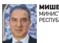
МИШЕЛЬ ФАРАХТ МИНИСТР ТУРИЗМА РЕСПУБЛИКИ ЛИВАН

Уверен, юным гостям понравится в нашей республике. Ливан встретил школьников отличной погодой и интересной программой, кроме того, у нас очень дружелюбные люди. Такие неофициальные визиты слушат укреплению дружбы между нашими странами даже дипломатических контактов. Надеюсь, в следующий раз эти ребята приедут в Ливан вместе со своими друзьями.