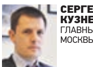
СЕРГЕЙ КУЗНЕЦОВ ГЛАВНЫЙ АРХИТЕКТОР МОСКВЫ

Мэром Москвы Сергеем Собяниным поддерживается инициатива повысить уровень архитектуры инфраструктурных объектов. Достойный уровень качества проектирования должен стать нашей градостроительной идеей на ближайшее будущее.