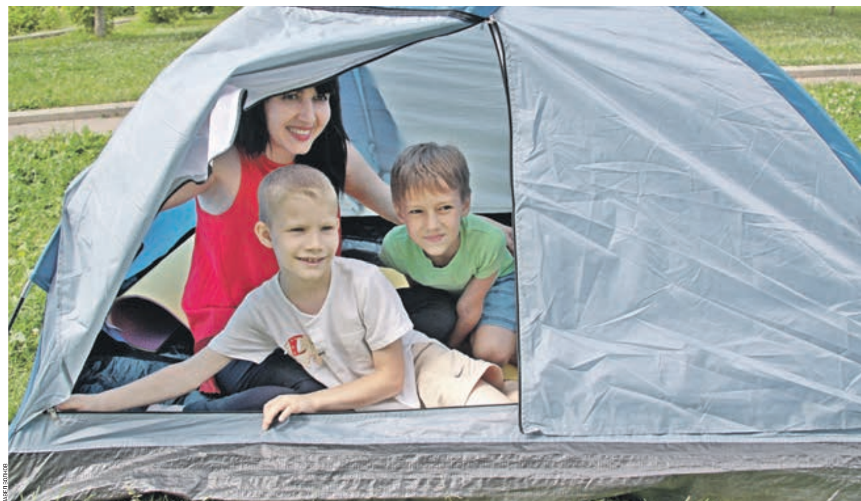
28 июня 16:03 Более 50 ребят, которые отдыхают в летнем лагере, организованном на базе Центра образования № 1601, посетили Станцию юных натуралистов эколого-туристического центра. Одна из задач городской программы «Московская смена» — сделать летний отдых школьников интересным и, конечно же, безопасным