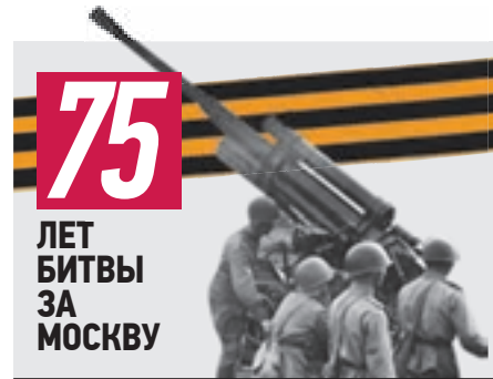
75 ЛЕТ БИТВЫ ЗА МОСКВУ

На самом высоком холме, выбить их оттуда было очень трудно. В ходе боев здесь погребено более 70 тысяч красноармейцев.