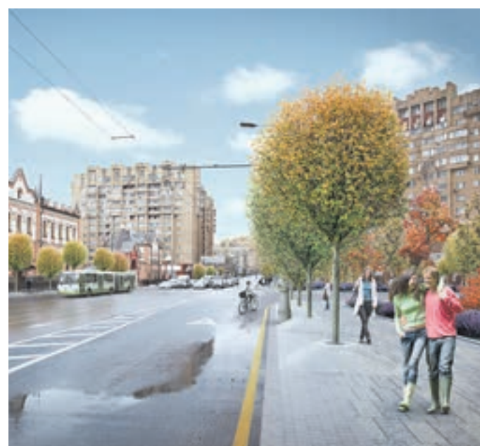
Проект благоустройства территории перед Абельмановской Заставой по городской программе «Моя улица»