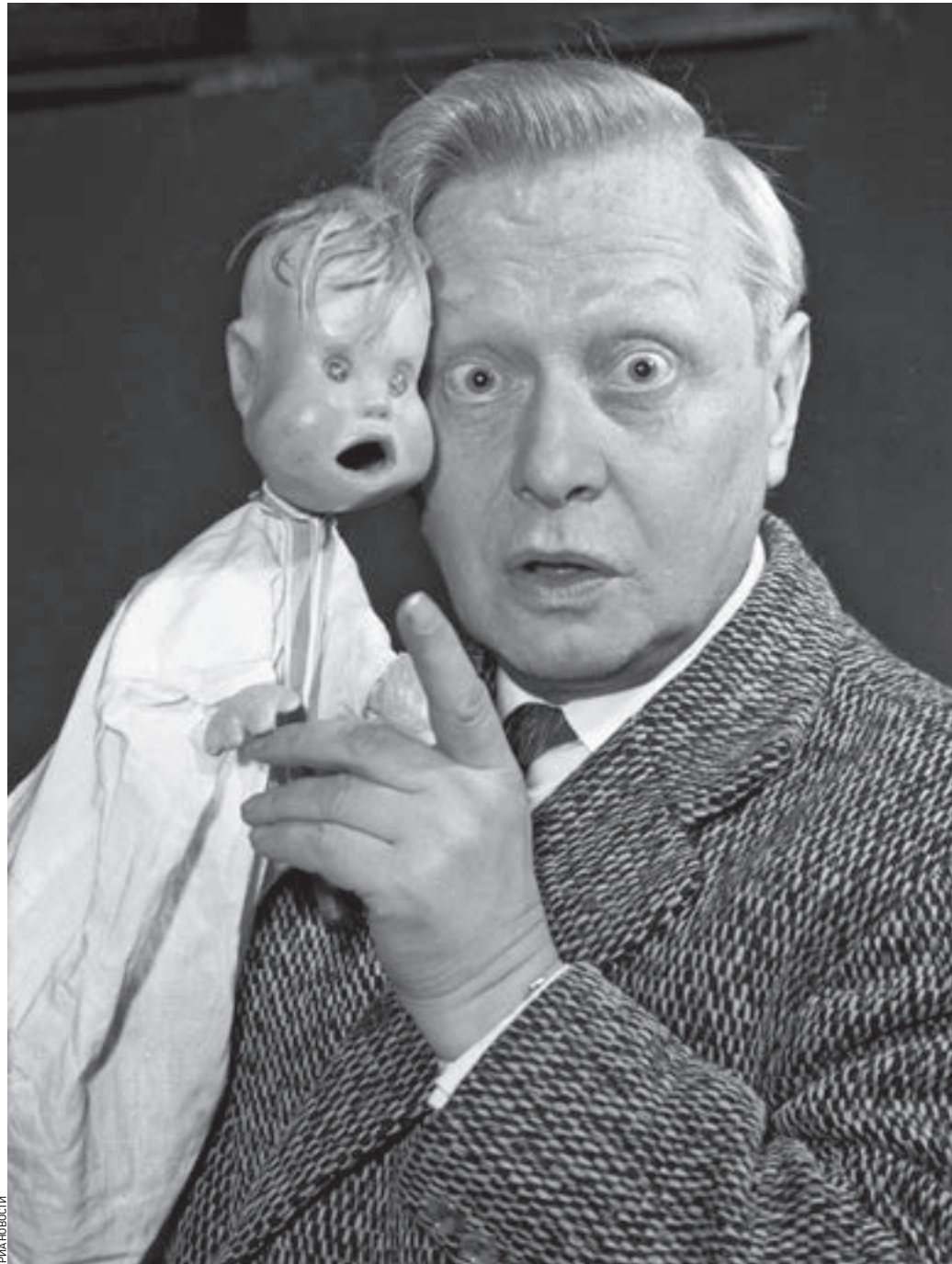
28 сентября 1955 года. Народный артист СССР, главный режиссер Государственного центрального театра кукол Сергей Образцов со своей любимой куклой Тяпой

ЮБИЛЕЙ Сегодня исполняется 115 лет мастеру кукол Сергею Образцову. Он был не только великим кукольным театром, известным на весь мир. Спектакль «Необыкновенный концерт» внесен в Книгу рекордов Гиннеса как самый посещаемый.