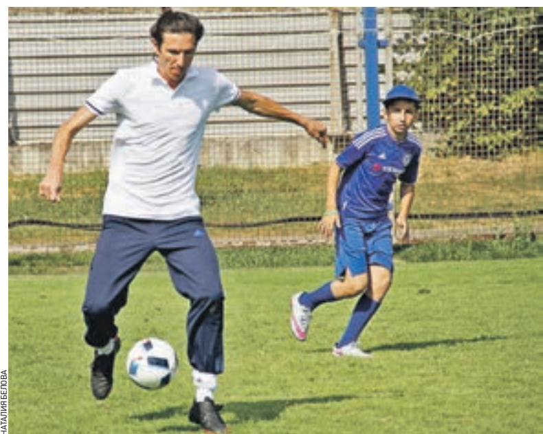
Вчера 16:35 Алексей Смертин (слева) провел мастер-класс для учеников столичных средних школ

16:40 Впервые за всю историю детского футбола России в понедельник английский футбольный клуб «Челси» и спортивный директор «Динамо» и игрок сборной Алексей Смертин открыли молодежный «Лагерь чемпионов». Отныне российские ребята будут включены в большую международную программу знаменитого английского клуба.