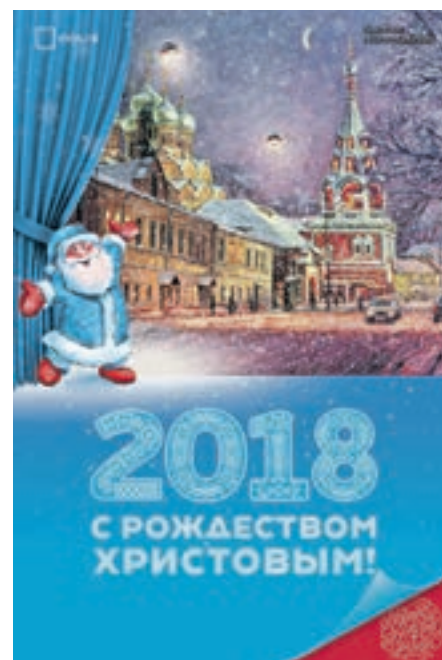
Элементы праздничного оформления города напоминают старинные рождественские открытки