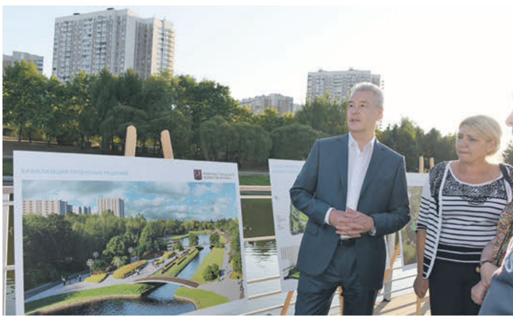
27 августа 2018 года. Мэр Москвы Сергей Собянин обсудил с жителями благоустройство поймы реки Битца, где будет сделан природно-ландшафтный парк

— Благоустройство и создание качественной городской среды — это один из очевидных приоритетов нашей работы, — сказал мэр Москвы Сергей Собянин, обратив внимание на то, как преобразился исторический центр города. Только за последние три года по программе «Моя улица» благоустроены и приведены в порядок более 200 улиц, площадей и главных магистралей столицы. Улицы стали не только красивыми и комфортными, но и зелеными. Везде, где прошло благоустройство, высадили новые деревья и кустарники. Так, на Тверскую вернули легендарные липы, а Садовому кольцу — былую славу. Здесь вновь растут роскошные клены и «победная» сирень. — Благоустроенные улицы стали новой визитной карточ-