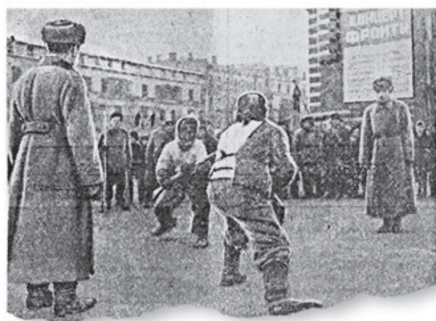
«Вечерка» за 9 ноября 1942 года. Состязания по штыковому бою на Пушкинской площади

Каждый гражданин должен уметь читать, писать и, если надо, защищать родину. Такую задачу поставили в СССР с первых лет его существования. Миллионы людей были «охвачены» (типичное советское слово) дополнительным образованием. В 1931 году газета сообщила о результатах «драки» (это слово тогда использовалось чаще, чем «борьба») за «сплошную грамотность». А в 1942 году написала о настоящем побое — состязаниях «всеобщего военного обучения» (членов добровольного Общества содействия обороне, авиационному и химическому строительству).