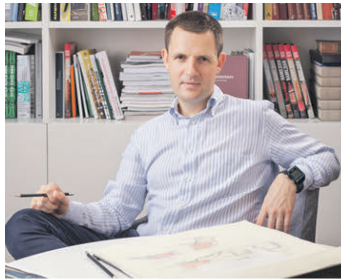
Главный архитектор Москвы Сергей Кузнецов впервые станет художником-постановщиком театрального спектакля

скульптурами, которые выставлялись не только в России, но и в Турции, Болгарии, Италии и Германии. Посетить выставку можно будет с 10 по 18 ноября. Премьера «Волшебной флейты» проходит в 29-м сезоне «Геликон-опера». В этом сезоне москвичей ждет еще три премьеры: опера Георга Генделя «Орландо», запланированная на март грядущего года, оперетта Жака Оффенбаха «Синяя борода», которая состоится в мае, и спектакль «Золотой петушок», открывающий новый сезон и посвященный столетию Московского музыкального Театра имени Станиславского и Немировича-Данченко. В 29-м сезоне «Геликон-опера» отправится на гастроли в Грецию (в сентябре), в Санкт-Петербург (в октябре), а затем в Берлин, Южно-Сахалинск, Вену и Эстонию. Помимо этого, в течение нового сезона в столичном музыкальном театре также будут проходить исторические экскурсии для взрослых и детей.