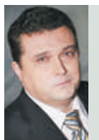
ВЛАДИМИР СОЛОВЬЕВ ПРЕДСЕДАТЕЛЬ СОЮЗА ЖУРНАЛИСТОВ РОССИИ