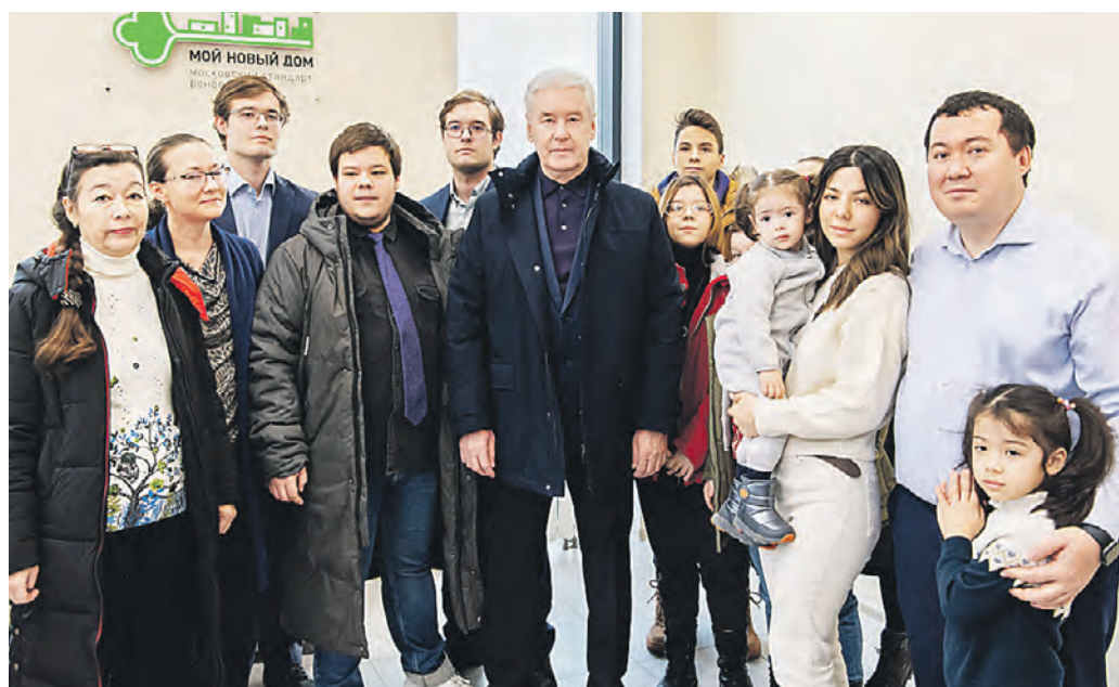
29 ноября 2022 года. Мэр Москвы Сергей Собянин (в центре) поздравил москвичей с новосельем. Семьи получили квартиры по программе реновации

— В «Свиблово» появятся школа искусств и храм. В «Северянин» — гостиница и торговый центр. Общий объем инвестиций в проекты — больше 69 миллиардов рублей, — сказал мэр столицы. Благодаря реорганизации трех промышленных зон получится создать около 11 тысяч новых рабочих мест. В мэрии города отметили, что реорганизуемая территория «Дегунино-Лихоборы» площадью 15,34 гектара расположена на севере Москвы, между путями Октябрьской железной дороги, улицы