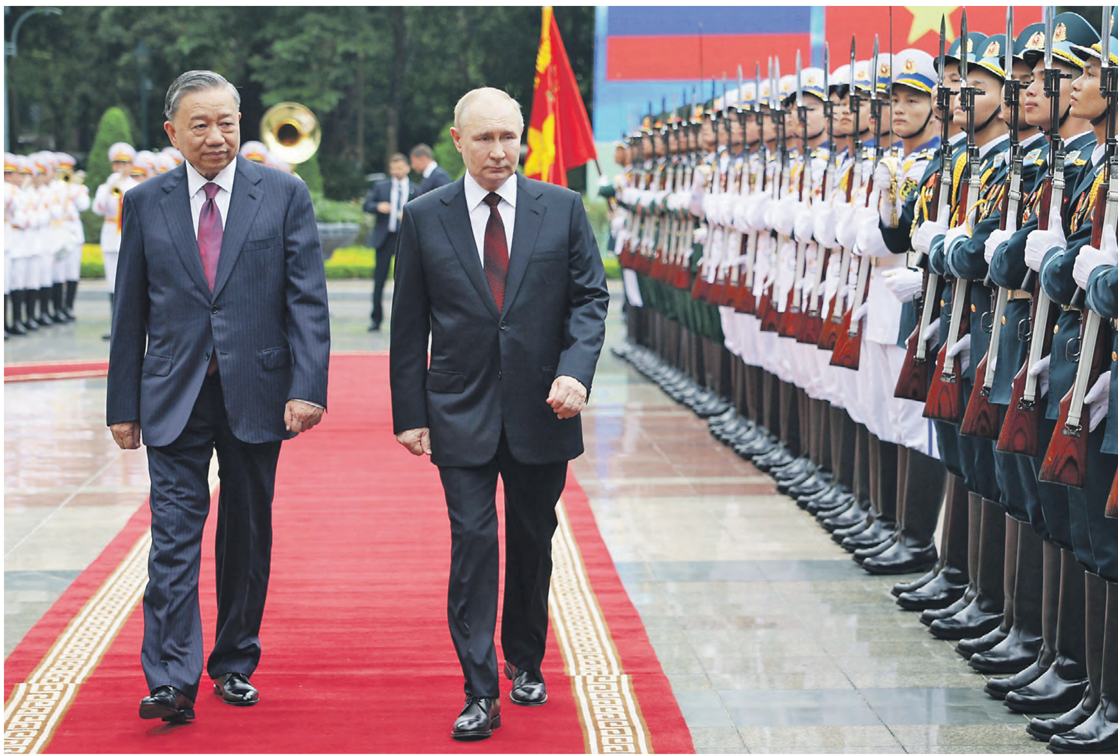
20 июня. Президент России Владимир Путин и президент Социалистической Республики Вьетнам То Лам (слева) на церемонии официальной встречи на площади у Президентского дворца в Ханое

— Россия пытается перехватить в этом регионе инициативу. США, обратите внимание, сейчас сколачивают антикитайский блок: Филиппины, Япония, Южная Корея и, конечно, Тайвань, — рассуждает эксперт. — Россия, в свою очередь, формирует свой блок — Китай, КНДР, Вьетнам. Последний, конечно, не военный партнер, но наша задача скромнее — вывести страну из-под влияния США, сделать ее как минимум нейтральной. Такой же, как Индия, которая Китай не любит, но воевать с ним за интересы США точно не станет. Шансы перетянуть Вьетнам на свою сторону у нас велики. Все помнят, что творили в этой стране американцы, сжигая деревни напалмом. И все помнят, что в борьбе с этими «светочами демократии» им помогали русские.