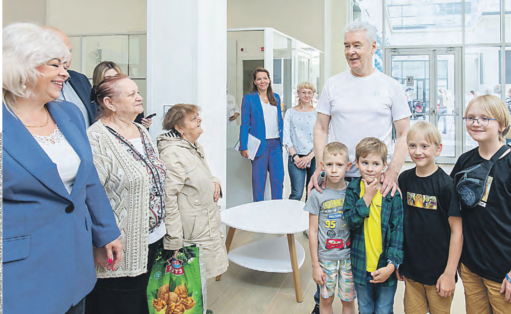
28 августа 2023 года. Мэр Москвы Сергей Собянин (справа) на открытии новой поликлиники на улице Твардовского в Строгине. Всего с 2011 года в столице построили 81 поликлинику, больше половины новых учреждений возведено за счет средств города

Мэр рассказал, что в поликлинике два изолированных блока с отдельными входами — для взрослых и детей. — Здесь будет современное диагностическое оборудование. Сделаем комфортные зоны ожидания и интуитивно понятную навигацию. Все — по новому московскому стандарту, — сообщил он.