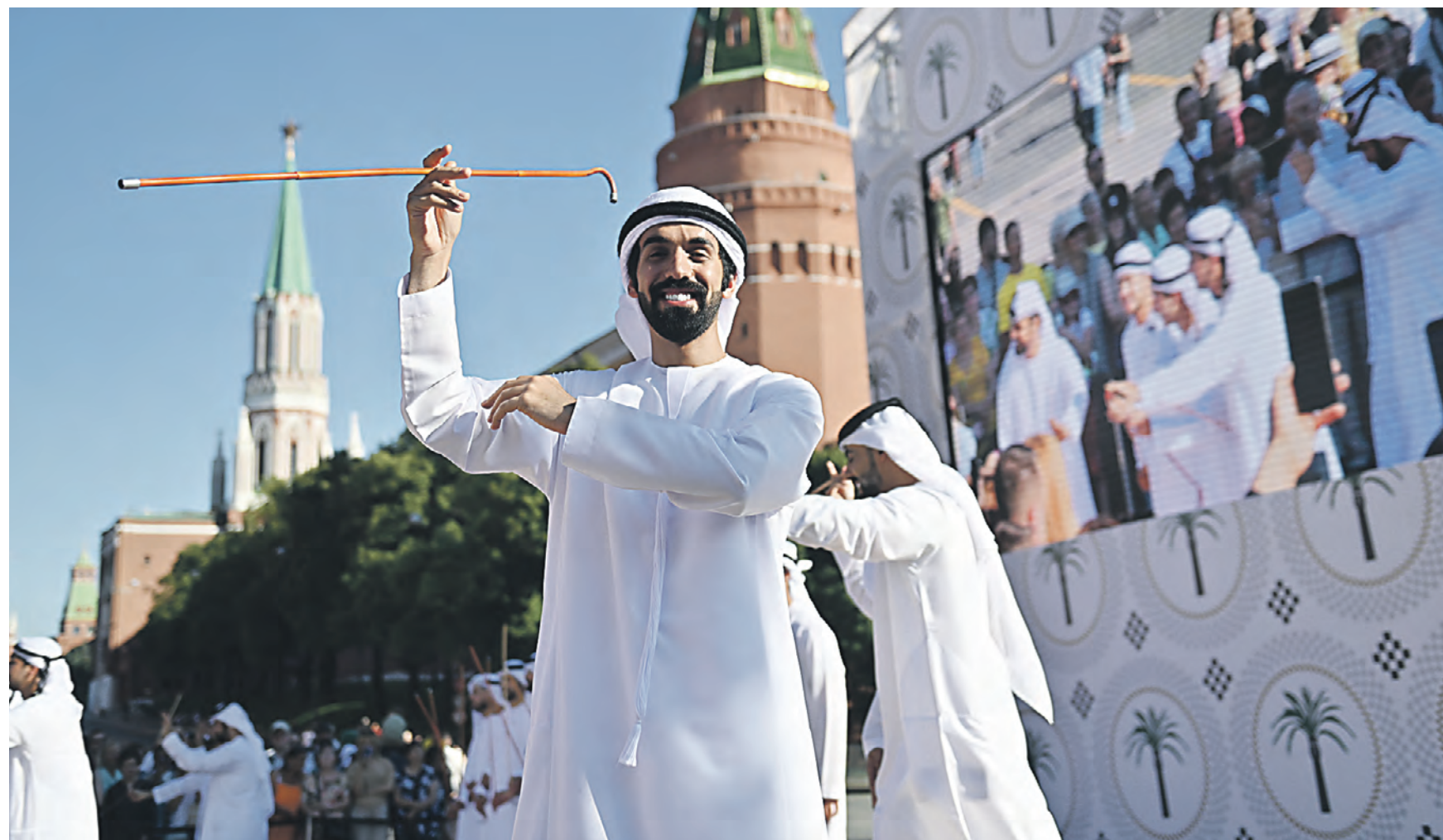
28 июня. Дни культуры Объединенных Арабских Эмиратов в Москве открылись грандиозной концертной программой на Манежной площади. До 2 июля можно посетить площадку и узнать больше о традициях и культуре ОАЭ.