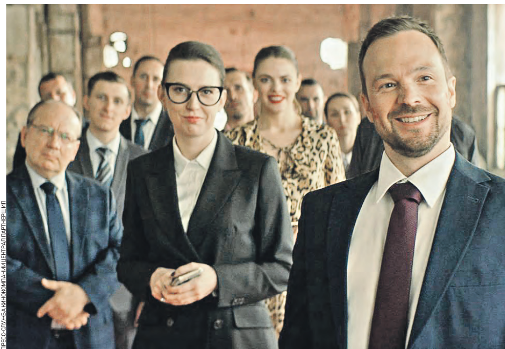
Кадр из фильма «Культурная комедия»: Алексей Чадов (справа) в роли чиновника Виктора Летаева, которому придется примерить на себя непривычную роль