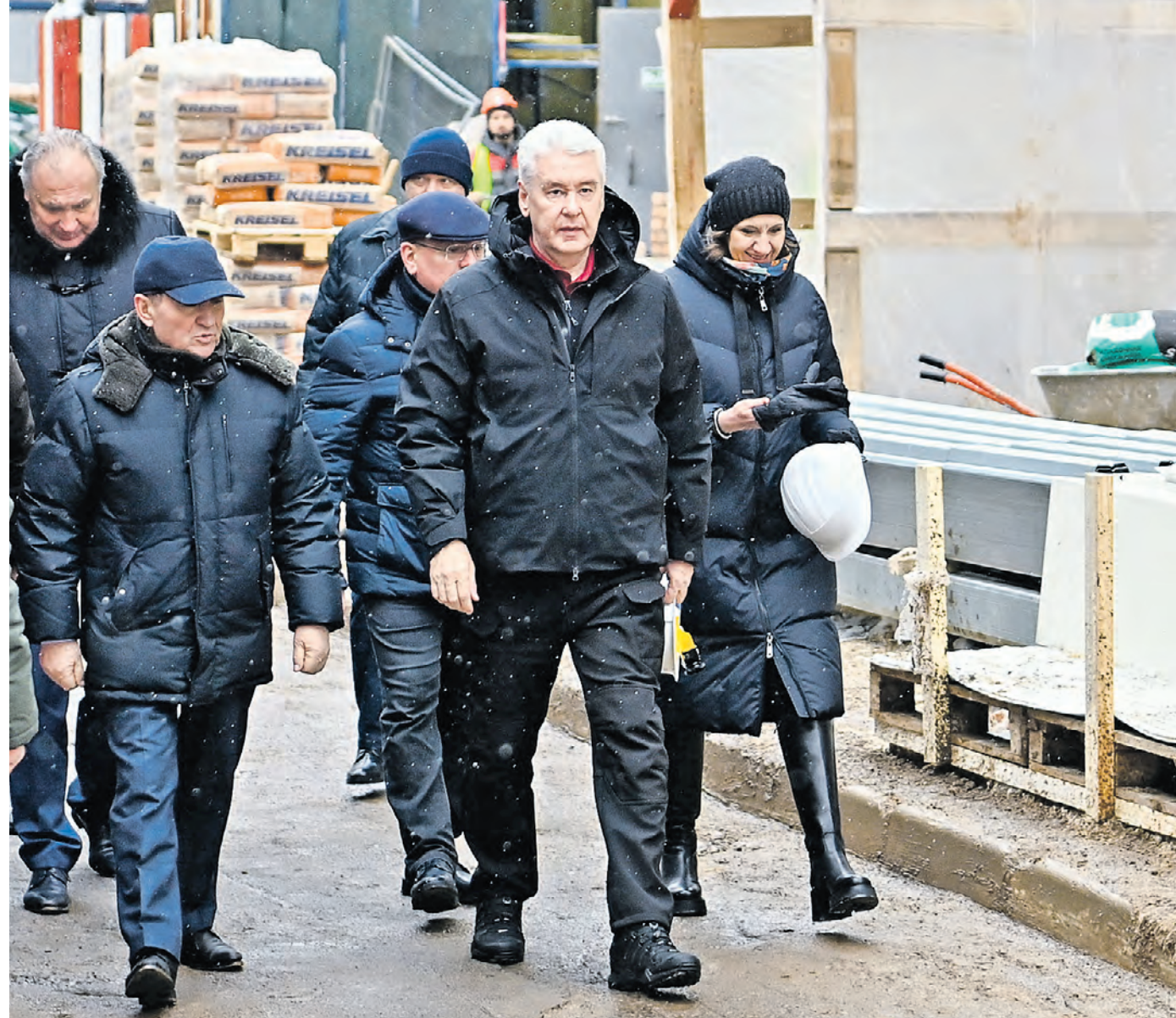
31 января. Мэр Москвы Сергей Собянин (в центре) вместе с заммэра столицы Петром Бирюковым (слева от мэра) и главным врачом поликлиники № 8 Оксанией Одарюк (справа от мэра) на строительной площадке медицинского учреждения в Тропарево-Никулине

— Приступили ко второму этапу масштабной программы реконструкции поликлиник. Делаем это в короткие сроки, без ущерба качеству. В этом году планируем запустить 100 поликлиник, — сообщил глава города.