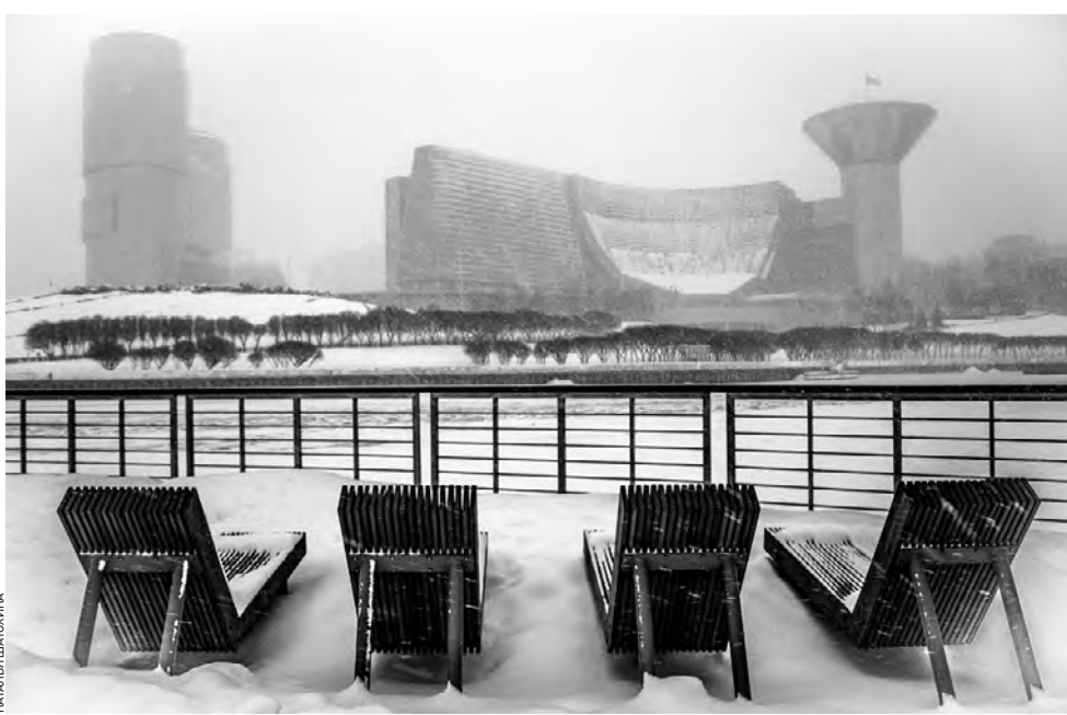
Декабрь 2023 года. Этот снимок фотокорреспондента «ВМ» Натальи Шатохиной вошел в шорт-лист российского конкурса «АРГУС-2023. Фотография среди искусств» в номинации «Звук. Ритм. Музыка. Время». На переднем плане — Живописная набережная, а на другой стороне реки — здание Московской областной думы (слева) и Дома правительства Московской области.