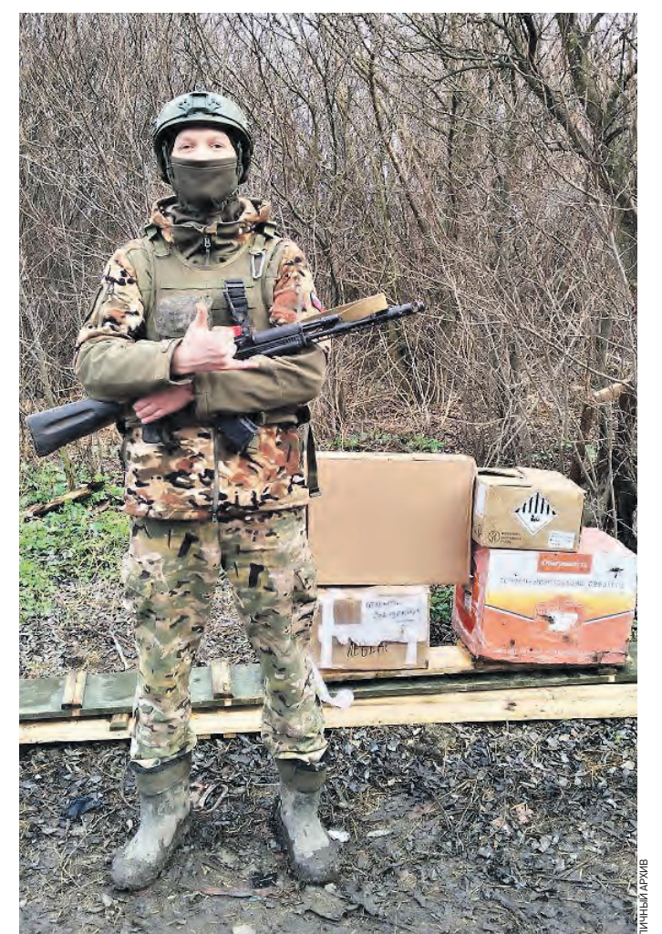
Ноябрь 2023 года. Российский военнослужащий принимает гуманитарную помощь от волонтеров АНО «Солидарность»