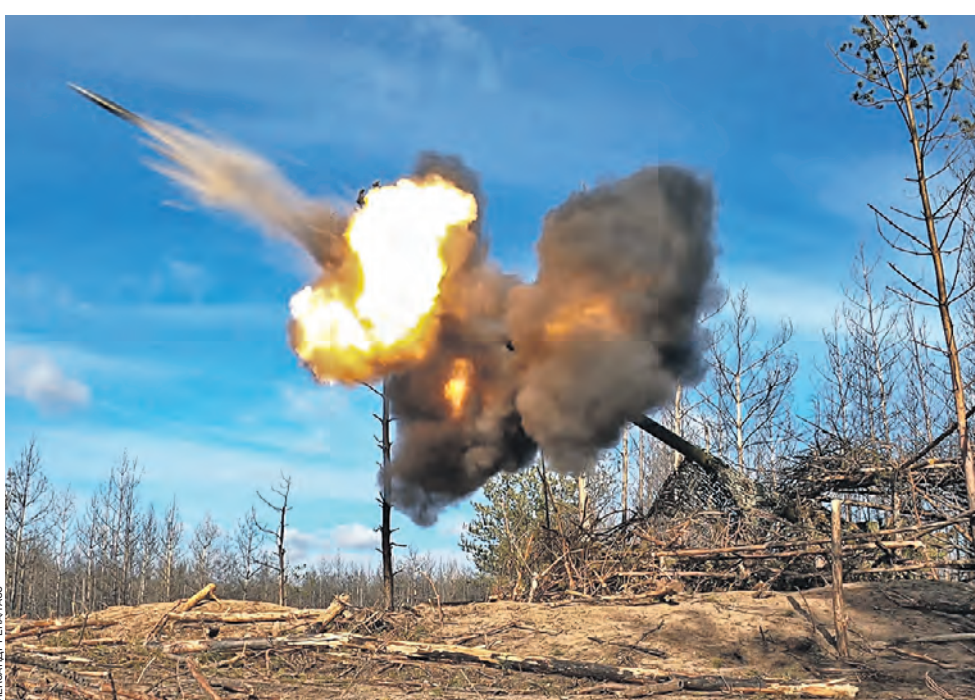
31 января. Работа расчета гаубицы «Гиацинт-С» на краснолиманском направлении в Луганской области. Там за минувшие сутки, по данным Министерства обороны России, бойцы ВС РФ заняли более выгодные рубежи и позиции и нанесли огневое поражение живой силе ВСУ, и отразили три атаки украинских штурмовиков. Потери противника составили до 280 военнослужащих, две боевые бронированные машины и семь автомобилей, уточнили в Минобороны России.