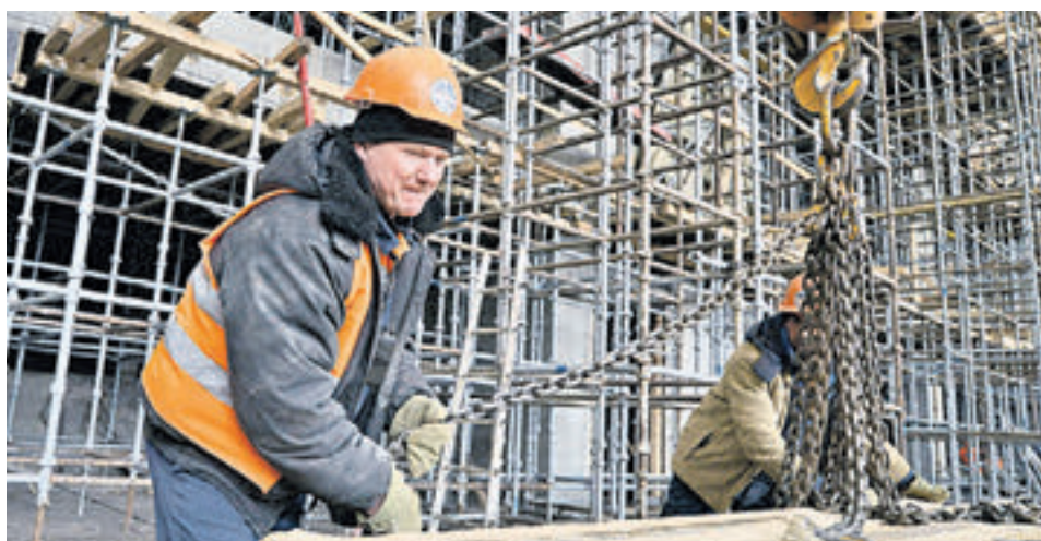
▶ 26 марта 2015 года. Реконструкция стадиона в разгаре. Арену укрепляли изнутри

На стадионе есть три варианта архитектурного освещения: подсвечены фасад, крыша и колонны. Это подчеркивает глубину сооружения.