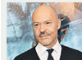
Федор Бондарчук, режиссер, актер