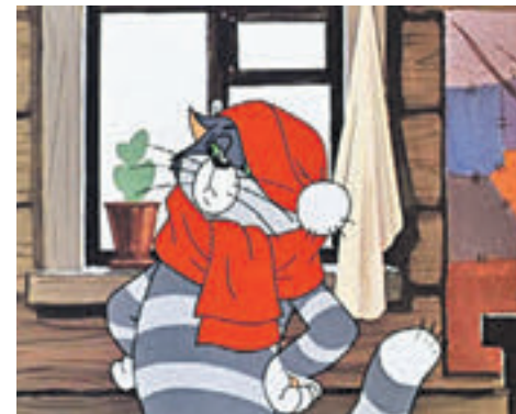
► Кадр из мультфильма «Простоквашино» и кот Матроскин, озвученный Табаковым

Появившиеся вчера в СМИ сообщения, что артист рассматривает возможность снова отдать свой голос Матроскину из Простоквашино, в Московском Художественном театре назвали подделкой.