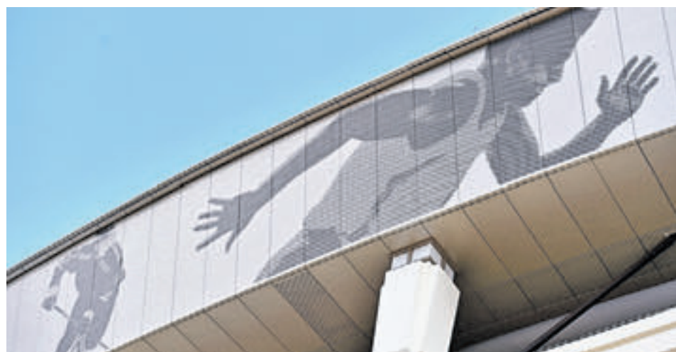
► Исторические фасады Большой спортивной арены бережно сохранили