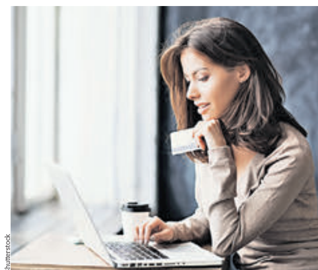
► Социальная карта москвича среди прочего позволяет проводить платежи в интернете