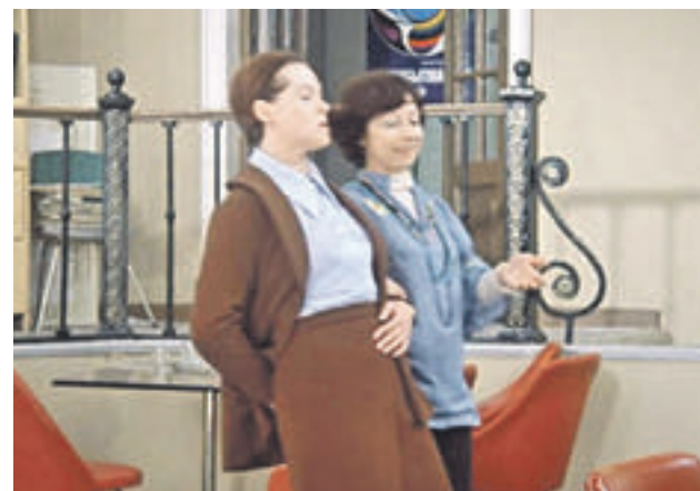
Кадр из фильма «Служебный роман» с актрисами Алисой Фрейндлих (слева) и Лией Ахеджаковой