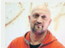
Гоша Куценко, актер

По мнению российских женщин, многим мужчинам лысина придает внушительность и шарм.