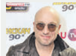
Дмитрий Нагиев, актер, телеведущий

Именно точный математический расчет и является преимуществом перед руками хирурга. Хотя работа человека тоже требуется: врач контролирует все действия робота и, кроме того, вручную вставляет подготовленные ростки-волосы в лунки для пересадки. Такой робот уже работает в различных клиниках мира, а стоимость трансплантации волос колеблется от 2 до 8 тысяч евро.