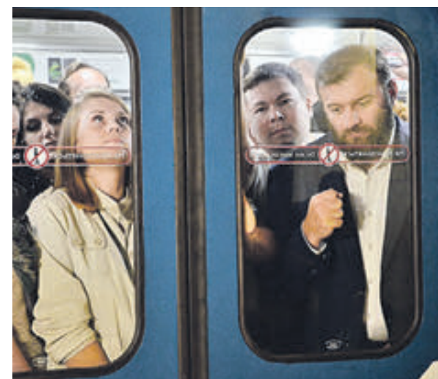
► Кадр из нового фильма «Тень» с Михаилом Пореченковым (справа) в главной роли