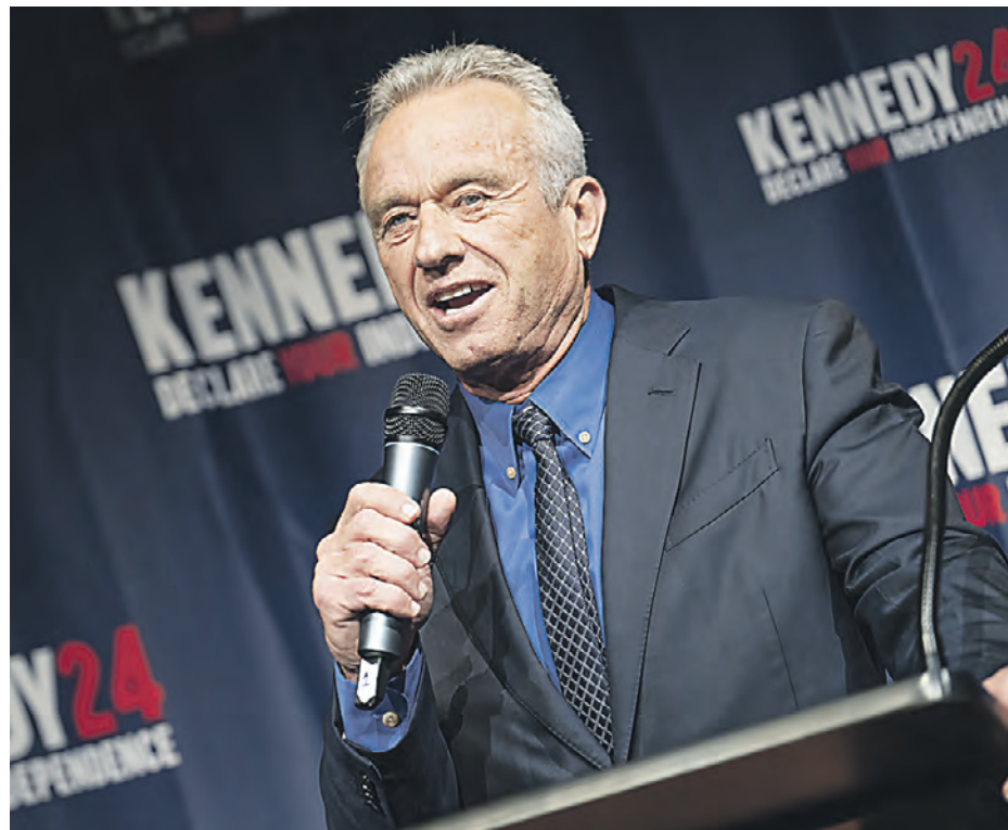
12 октября. Кандидат в президенты США от Демократической партии Роберт Кеннеди-младший во время предвыборного митинга в Майами

Saxo Bank сделал шокирующие предсказания на 2024 год