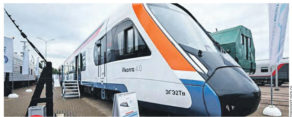
Поезд «Иволга 4.0» на выставке техники и технологий «PRO//Движение. Экспо»

На Тверском вагоностроительном заводе приемочная комиссия завершила работу и подписала акт приема нового поезда. Теперь «Иволга 4.0» получила сертификат соответствия требованиям Технического регламента Таможенного союза. Это главный документ, позволяющий начать серийное производство поездов.