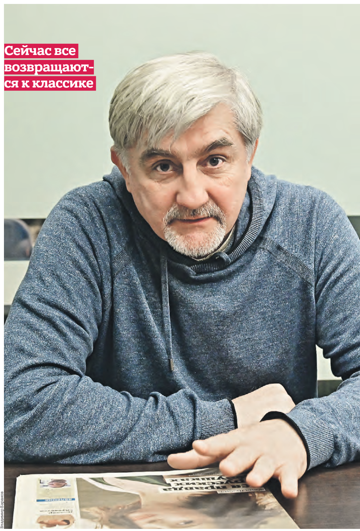
Сейчас все возвращаются к классике

Когда в спектакле не хватает интеллектуальной насыщенности, чтобы удивлять публику, то режиссеры переходят на более низкий уровень и показывают различные непристойности. На такое народ очень охот-