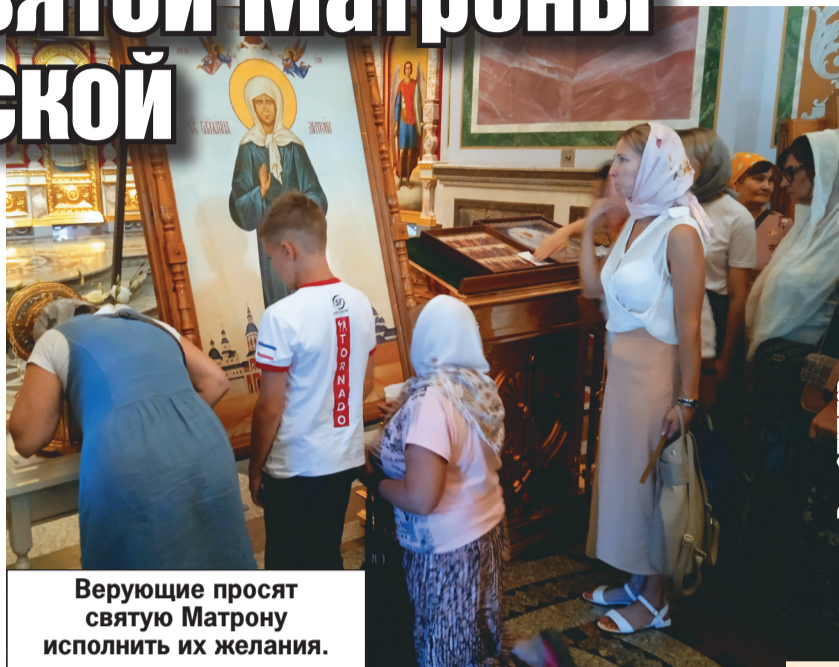
Верующие просят святую Матрону исполнить их желания.

Матронушке, - рассказала одна из прихожанок в крымской столице. - Два года тому назад специально в Москву летала, чтобы побывать на ее могиле и вымолить себе счастливое замужество, хорошего мужа и семью. Вернулась в Симферополь, и уже через неделю познакомилась с замечательным парнем. Мы поженились, у нас родился ребенок. Мечта-