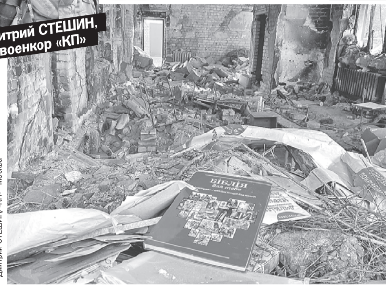
Дмитрий СТЕЩИН/«КП» - Москва

- Чтобы их запитать, надо линии ЛЭП разминировать. Саперам не до нас сейчас... - Чиновник на секунду задумывается и находит решение: