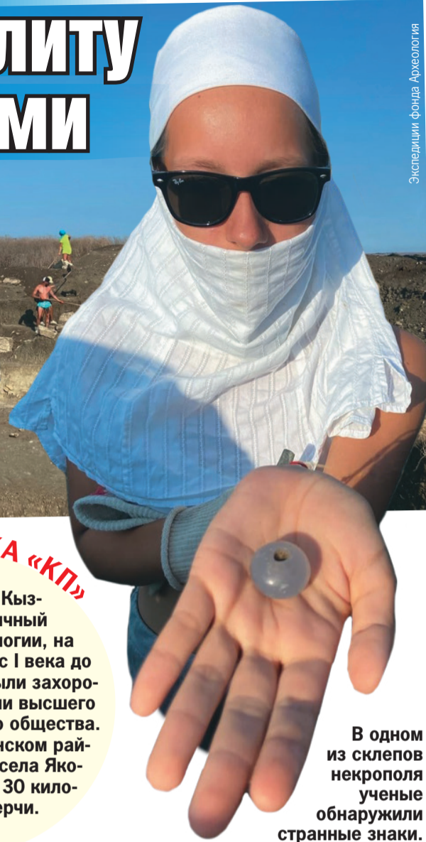
Экспедиция фонда «Археология»