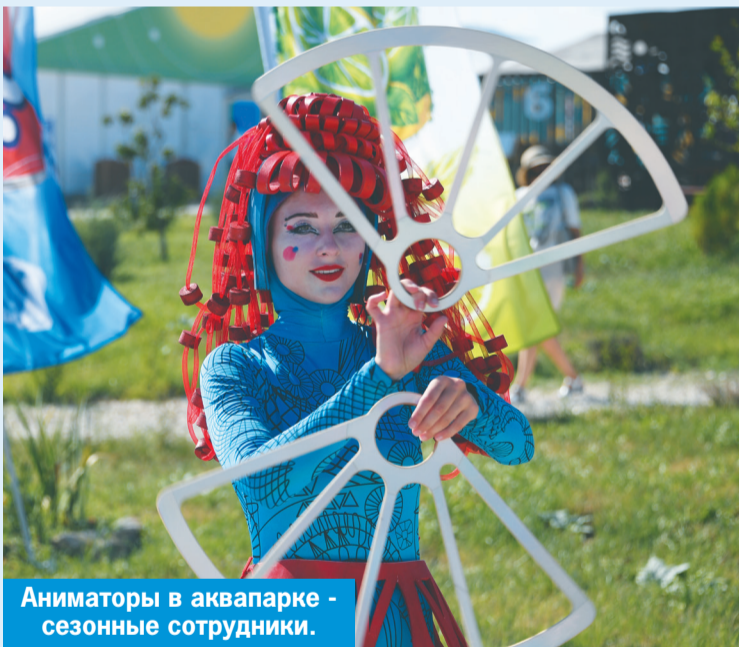
Аниматоры в аквапарке - сезонные сотрудники.