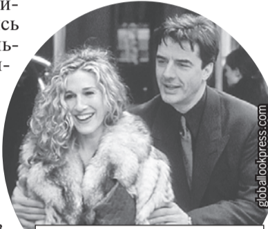
Сара Джессика Паркер в сериале была от Нота без ума, но в жизни его в трудную минуту не поддержала.

чиной того, что коллеги его не поддержали, Крис называет страх - дескать, люди боятся сказать то, что идет вразрез с общественным мнением. Впрочем, подробно разбирать каждое из обвинений артист не стал: «Не хочу оправдываться, иначе завтра таблоиды выдернут мои слова из контекста и мои дети это увидят».