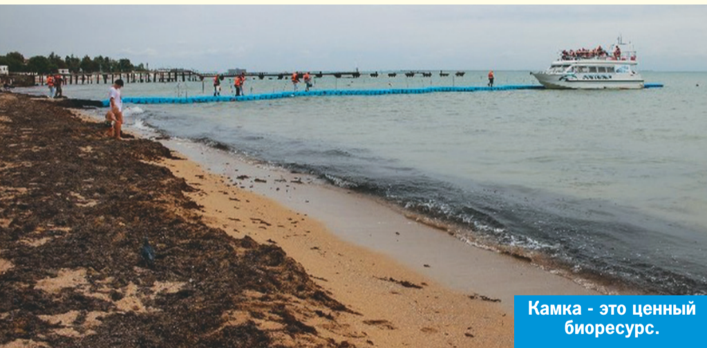
Камка – это ценный биоресурс.