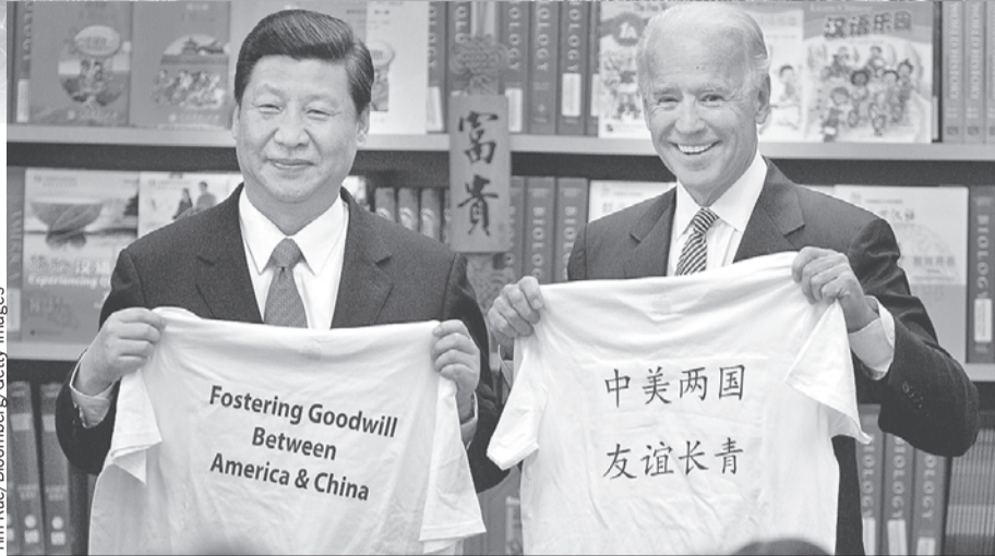
Эта фотография была сделана больше 10 лет назад, когда Си Цзиньпин был вице-премьером Китая, а Джо Байден - вице-президентом США. Тогда казалось, что между странами царит дружба. Но Штаты не привыкли делить с кем-то место на вершине, а мощь Китая не позволяла ему довольствоваться вторым местом. Столкновение двух систем всегда было лишь вопросом времени.

только корпорации - от тесного сотрудничества с Китаем?