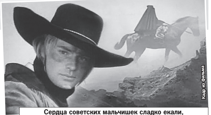
Сердца советских мальчишек сладко екали, когда кинотеатры вывешивали афиши с Видовым. И зловещим силуэтом на заднем плане...

С точки зрения идеологической нагрузки фильм должен был осуждать насилие, расо-