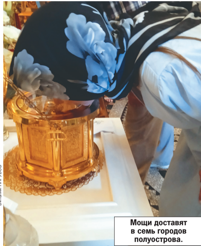
Мощи доставят в семь городов полуострова.

Ковчег будет находиться на полуострове до 30 сентября, что позволит всем жаждущим совершить молитвенное поклонение.