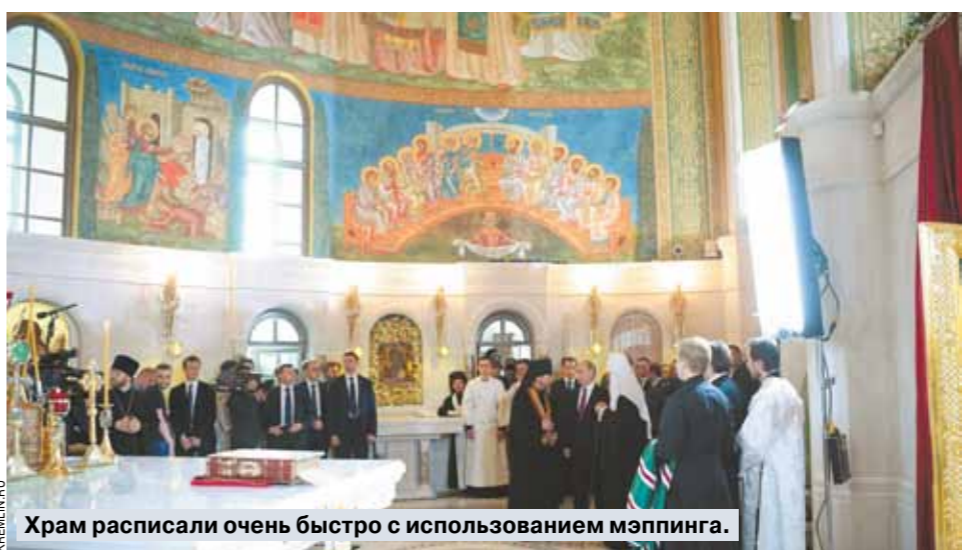
Храм расписали очень быстро с использованием мэппинга.

Епископ Тихон (Шевкунов) построил храм на Сретенке