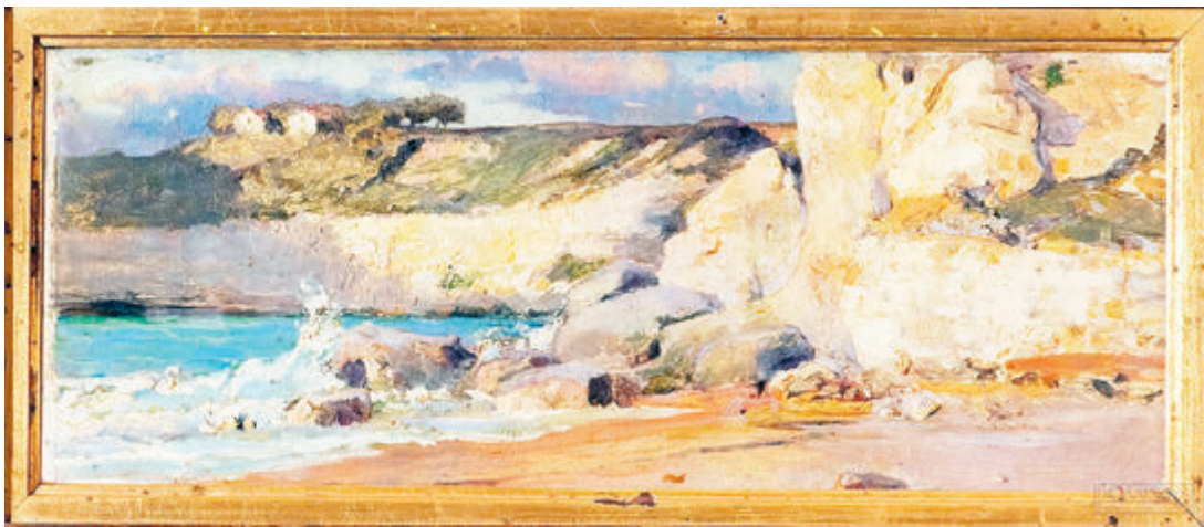
Илья Остроухов. Уголок близ маяка. Биарриц. 1890-е.

Сотрудничая много лет с Остроуховым как тонким экспертом, охотно покупая остроуховские пейзажи, Третьяков доверил ему продолжать свое дело жизни – создание музея национального искусства. Почти 14 лет Остроухов фактически возглавлял галерею, приезжал в нее ежедневно. Именно он настоял на капитальном ремонте здания и перестройке фасада, переделанного в красный кирпич. По его инициативе Виктор Васнецов в неорусском стиле разработал эскиз центрального входа, а скульптор Николай Андреев увенчал его барельефом с изображением святого Георгия Победоносца, небесного покровителя Москвы.