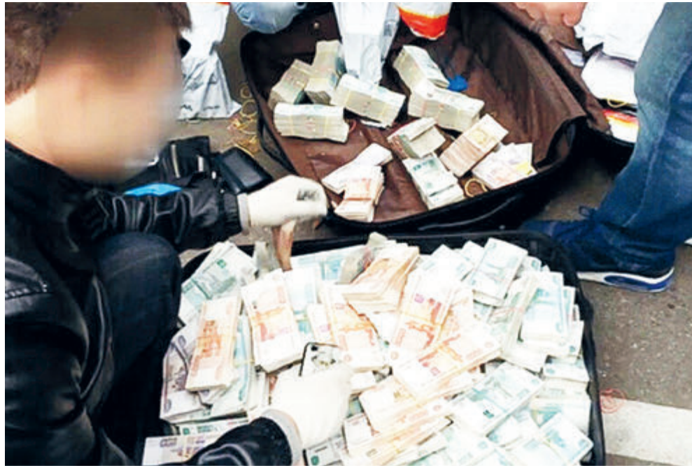
Бывает взятка в 10 тысяч, а бывает и такое...

В сентябре 2022 года военные следователи вместе с сотрудниками ФСБ вычислили «группировку расхитителей продуктов питания», действовавшую в элитной дивизии имени подмосковной Балашихи. По версии следствия, за три месяца трое поваров-инструкторов, завскладом и начальник столовой похитили, вывезли из части на автомобиле с надписью «Полиция» и продали на ближайшем рынке более полутора тонн говядины, трески и сливочного