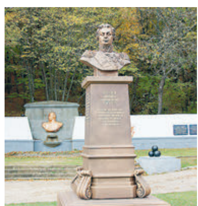
Мемориальный комплекс «Кутузовский фонтан» в Крыму.

зов получил тяжелое ранение: пуля через левый висок вышла у правого глаза. К удивлению лекарей, Кутузов выжил. Екатерина II распорядилась выдать герою тысячу червонцев и «уволить для излечения ран к теплым водам на год без вычета жалованья». Несмотря на увечье, Кутузов вернулся на службу. В 1812 году после вторжения Наполеона в Россию царь Александр I назначил Кутузова главнокомандующим Российской армией.