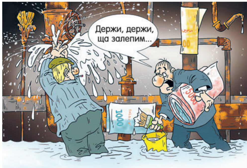
ИЛЛЮСТРАЦИЯ СЕРГЕЯ САРГИНА

«Кроме огромной общественной опасности, которую несет в себе такая коррупция, создавая у нечестных на руку чиновников иллюзию вседозволенности и открывая тем самым путь к многомиллиардным взяткам, зачастую такие преступления