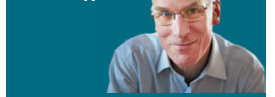
СЕРГЕЙ БИРЮКОВ ЧЛЕН ЭКСПЕРТНОГО СОВЕТА «ЗОЛОТОЙ МАСКИ»