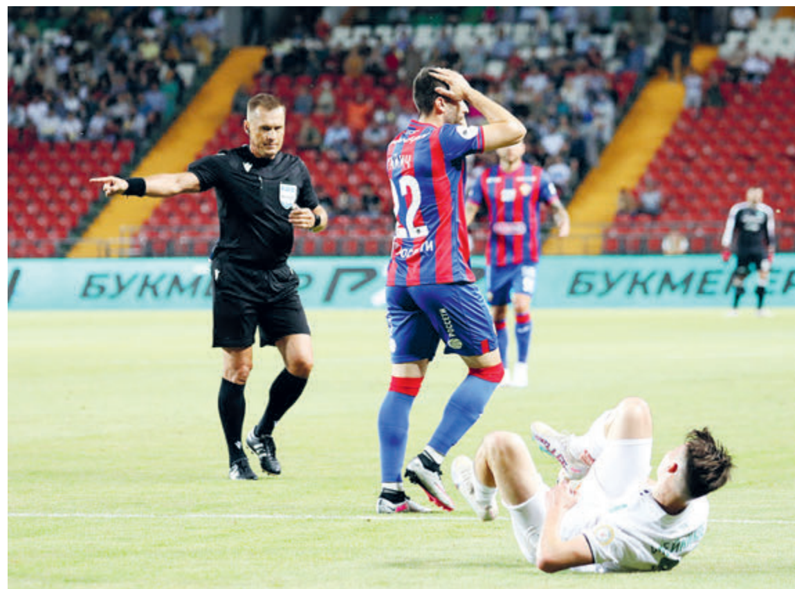
ФОТО ПИК «АХМАТ»