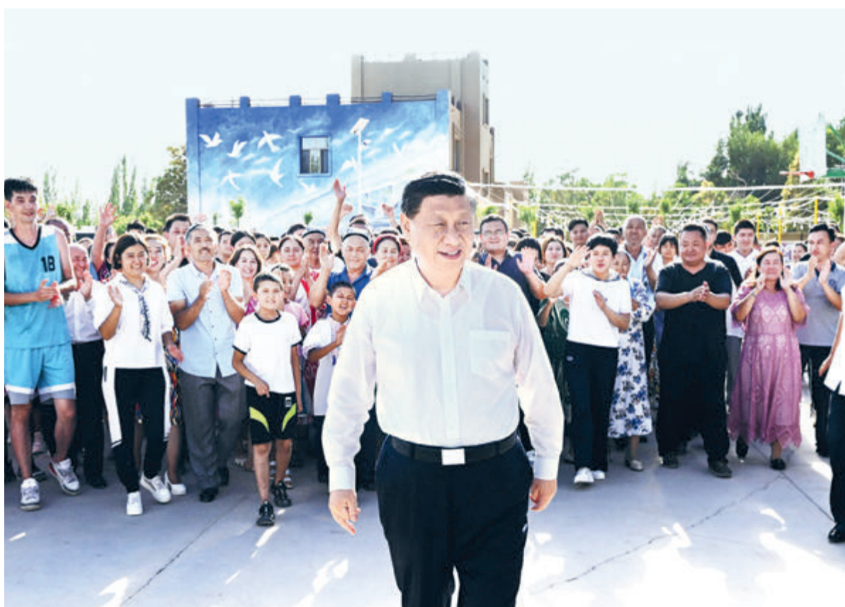
Председатель КНР Си Цзиньпин всегда стремится быть в гуще народа.

Именно под научным руководством идей Си Цзиньпина о социализме с китайской спецификой в новую эпоху и в особенности важных идей генерального секретаря Си Цзиньпина о партийном строительстве наша