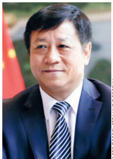
ФОТО ПОСОЛСТВА КНР В РОССИИ

Важные идеи генерального секретаря Си Цзиньпина о партийном строительстве задают новое направление сотрудничества между китайскими и зарубежными политическими партиями