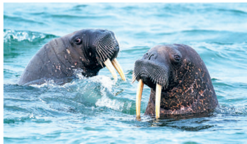
При участии «Роснефти» организованы масштабные экспедиции по изучению краснокнижных видов животных и птиц.