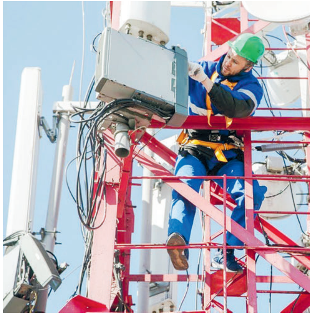
А долетит ли сигнал до соседней деревни?

Если говорить честно, то связь у нас в последние годы не развивается. Монополисты объясняют это сложностями с закупкой нового оборудования, да и с обслуживанием старого не все в порядке. А отечественное в явном дефиците. При этом цены на мобильную связь растут.