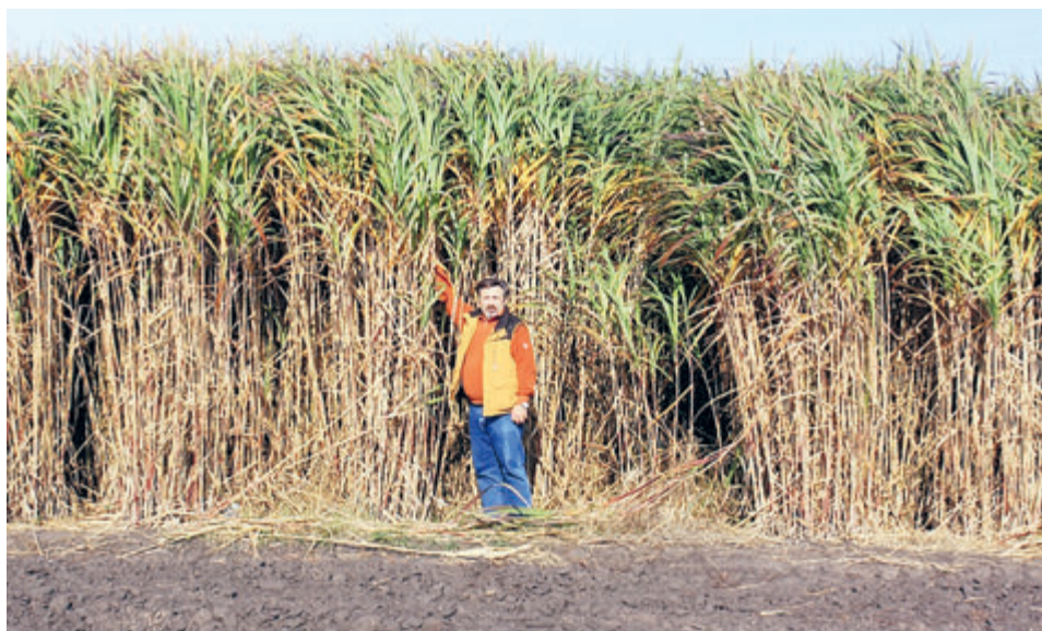
В дебрях мискантуса легко заблудиться.

Но реальность оказалась катастрофической. Коровы давали горькое молоко, гибли от новой кормежки. Фермы попытались вернуться к традиционному