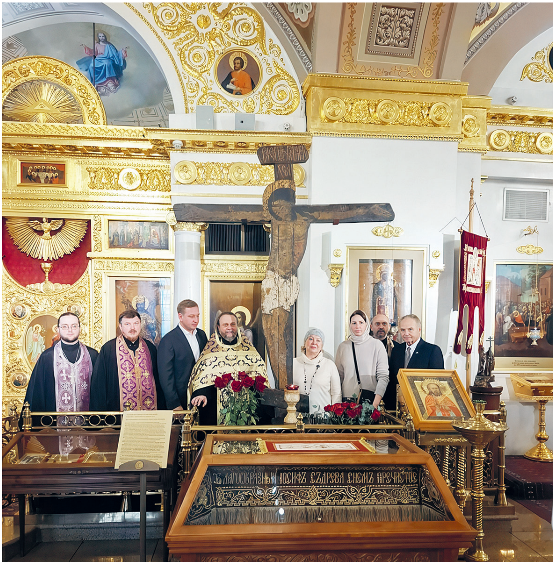
Голгофский Крест из собора города Дмитрова (конец XIII века).

Когда РПЦ вернула себе «Троицу», музейный мир был охвачен тревогой. Давно из-