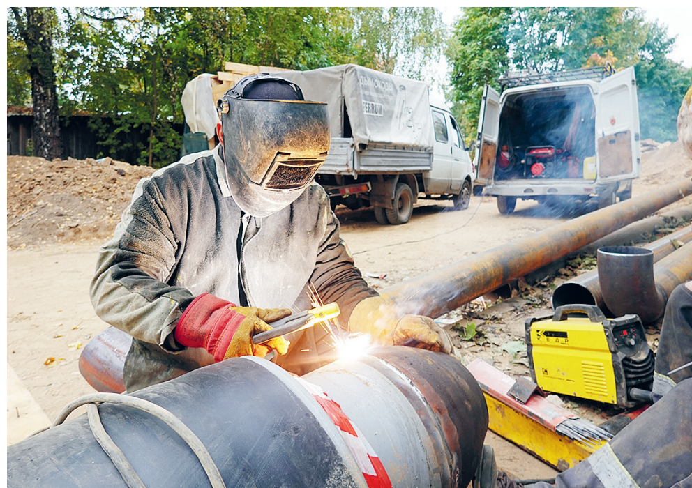
Сварщик сегодня – профессия уважаемая и высокооплачиваемая.

Члены совета директоров и правления Газпромбанка за тот же период получили 36,4 млрд. Третьим идет Т-Банк, который выплатил своему руководству и руководству «дочек» 26,6 млрд. Правлению и наблюдательному совету ВТБ достались 17,1 млрд рублей. Пятерку лидеров замыкают топ-менеджеры Альфа-банка (14 млрд). Один член правления или совета директоров банков из топ-50 в среднем получал в 2023–2025 годах по 8,4 млн рублей в месяц – в 90 раз больше средней зарплаты по стране. А из топ-5 банков – по 15–30 млн. Эти денежки банкиры, разумеется, держали на депозитах в своих же банках и получали еще миллиарды пассивного дохода. По некоторым подсчетам, около 45 млрд за 2,5 года. В итоге 90% всех доходов от депозитов в стране получают