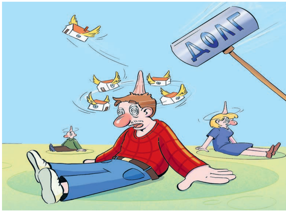
ИЛЛЮСТРАЦИЯ НАСТАСИ НОВАЛЕСКОЙ

Теоретически, учитывая среднюю стоимость ипотечной квартиры в 5,6 млн, у должников требуется изъять более 50 тысяч квартир. Но коллекторское агентство «Долговой Консультант» сообщает: всего 2082 такие квартиры были проданы на торгах в 2025 году. Причины разные: у многих ипотечные квартиры оказались единственным жильем, отобрать которое даже по суду невозможно, а другим правдами и неправдами удалось продлить свою «жилищную кабалу». В итоге кредиторы вернули себе за минусом издержек всего 6,75 млрд – по 3,2 млн с изъятых квартир.