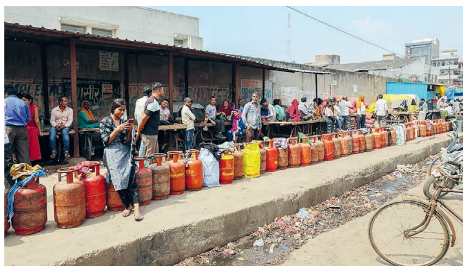
Индия. Дикие очереди за газом.

А тем временем Пентагон перекидывает морпехов и готовит наземную опе-