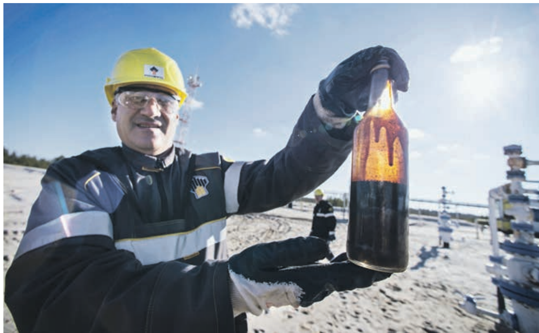
26 сентября 2016 года. Оператор по добыче нефти и газа одного из нефтедобывающих предприятий демонстрирует пробу жидкости, которая поступает из скважины на Ново-Пурпейском месторождении в Ямало-Ненецком автономном округе