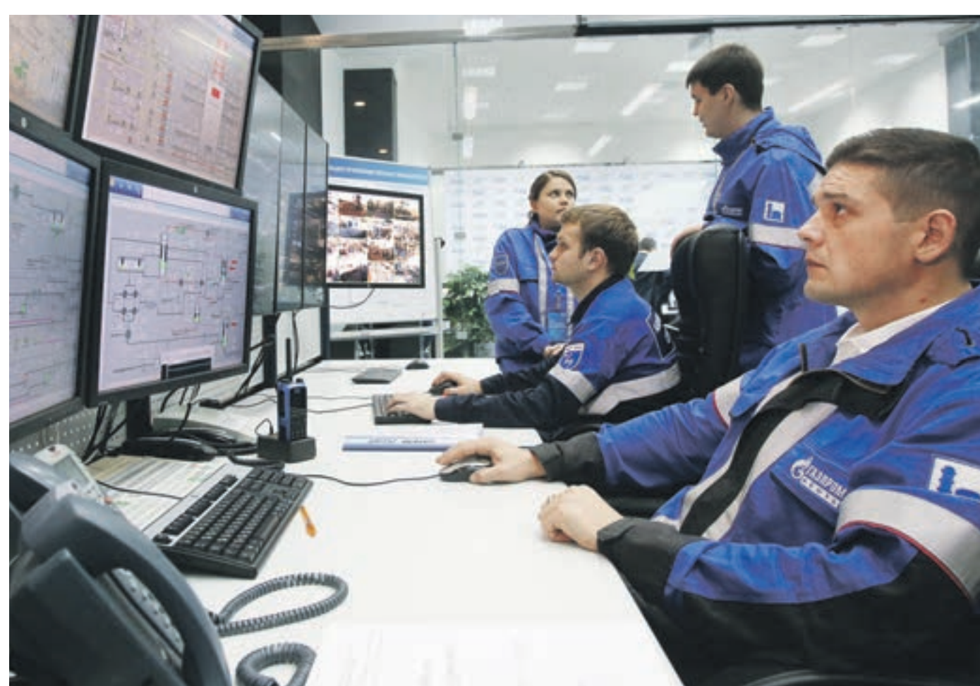
Диспетчеры Московского нефтеперерабатывающего завода дистанционно контролируют все производственные циклы

— На Московском нефтеперерабатывающем заводе проделана большая работа. Сегодня это одно из самых передовых предприятий отрасли, которое прошло модернизацию и перешло на современные технологические процессы. К 2020 году его с полным правом можно будет назвать «зеленым» предприятием. На МНПЗ сегодня производятся топливо и продукция, соответствующие самым высоким экологическим стандартам, — сказал вице-премьер правительства России Александр Хлопонин. В работе «Биосферы» применяются самые современные технологии и оборудование. Проект разработан отечественной компанией, и более половины используемого оборудования — российского производства. Сочетание технологий и методов очистки, используемое в «Биосфере», не применяется больше нигде в России. На сегодня это самая эффективная технологическая схема из всех доступных. — Система «Биосфера» обеспечит высокие экологические параметры работы комплекса, и она соответствует уровню наилучших доступных технологий. При этом запуск установки в эксплуатацию осуществлен раньше того, как заработают соответствующие требования завода. Совершенствование за-