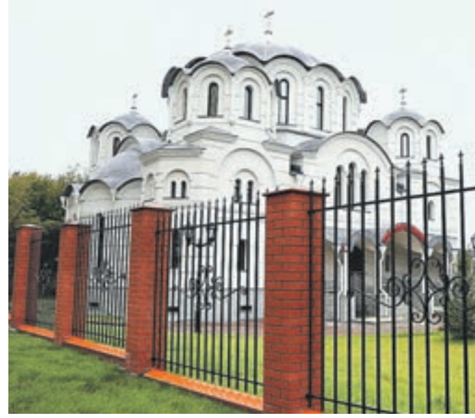
17 сентября 2017 года. Новый храм стал украшением района Некрасовка

В Москве продолжается активное строительство храмов и церквей, входящих в «Программу-200». Недавно первый храм по этой программе был построен в столичном районе Некрасовка. Сейчас он готовится к освящению и скоро примет первых прихожан.