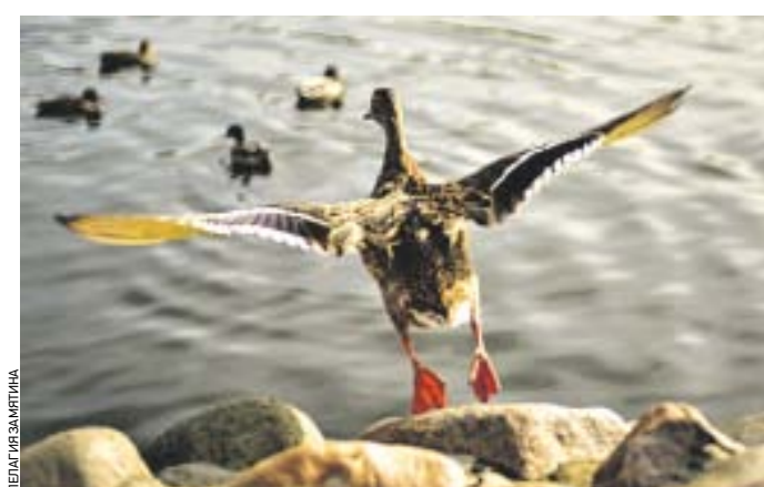
Вчера 11:07 Кряква расправляет крылья, чтобы через несколько секунд присоединиться к другим уткам

НАТАЛЬЯ ТРОСТЬЯНСКАЯ n.trostyanskaya@vm.ru