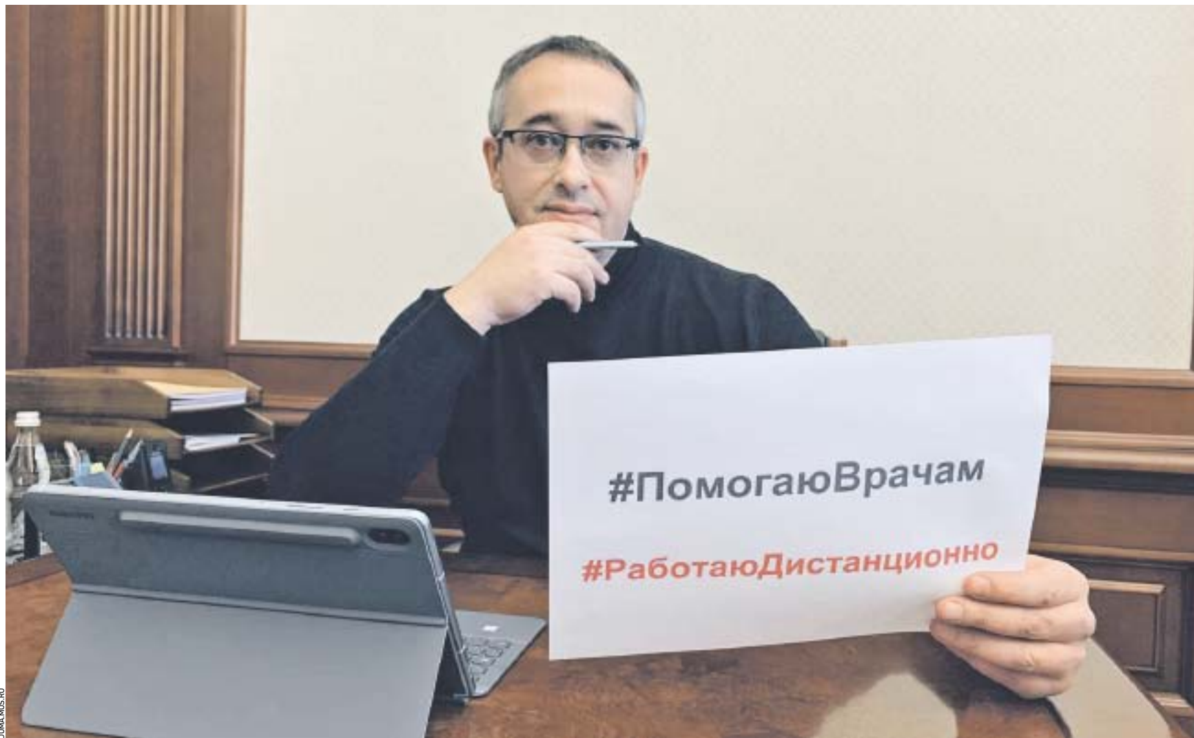
25 марта 19:34 Председатель Московской городской думы Алексей Шапошников призывает жителей столицы переходить на дистанционный режим работы и оставаться дома. Сам депутат столичного парламента ведет прием горожан онлайн и по телефону