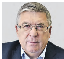
ВАЛЕРИЙ РЯЗАНСКИЙ ПРЕДСЕДАТЕЛЬ ПРЕЗИДИУМА ОБЩЕРОССИЙСКОЙ ОБЩЕСТВЕННОЙ ОРГАНИЗАЦИИ «СОЮЗ ПЕНСИОНЕРОВ РОССИИ»

Предложение требует серьезной доработки. В конце концов кто-то должен будет покрыть эти дни отдыха. Любой отпуск должен быть оплачиваемым. Но это финансирование совсем неинтересно для работодателя. Здесь должны прийти на помощь социальные фонды, что тоже необходимо будет включить в законопроект. Также важно отметить, что проследить кровно-родственные связи между взрослыми людьми крайне сложно. Работодатель не знает, кто кому приходится ребенком и какой у него статус, а выяснить это частному предпринимателю почти невозможно. Получается, что у сотрудников просто появляется дополнительный повод соврать и уйти в отпуск за свой счет. Вероятно, причина обсуждения этого вопроса следующая. По одной гипотезе, в расширенной семье количество детей больше. Расширенная — значит, что хозяйства ведут не только родители и дети, но и бабушки и дедушки. Такой формат придает родителям уверенности, потому что они надеются не только на свои силы, но и на поддержку старшего поколения. Миграция в Москву и Санкт-Петербург серьезно понижает коэффициент рождаемости, поскольку молодые семьи становятся оторванными от корней. Но стратегия в целом должна быть направлена на повышение этого показателя. Нужно принимать комплексные меры, не ограничиваясь одной идеей.