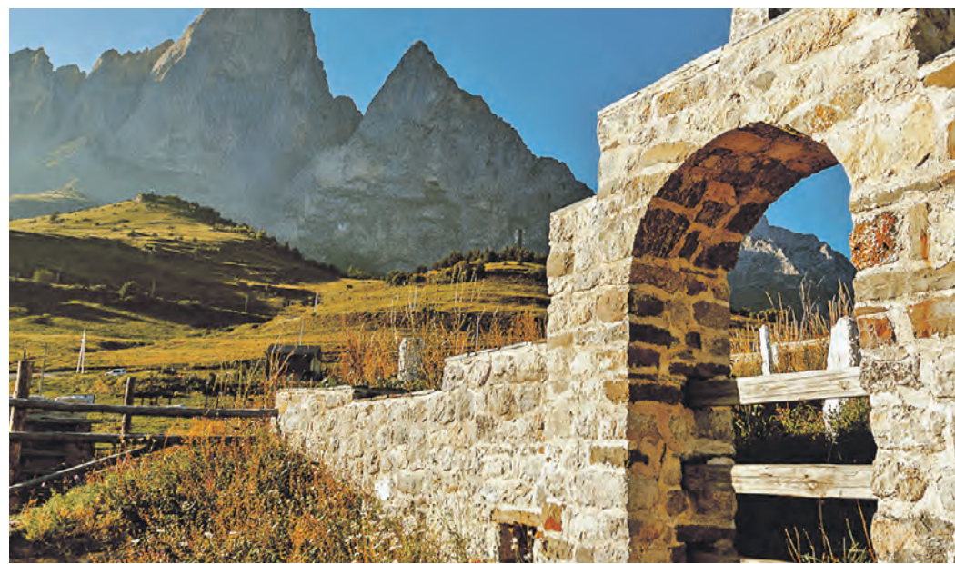
Фрагмент средневековой постройки на фоне горы Цей-Лоам — одной из главных вершин региона