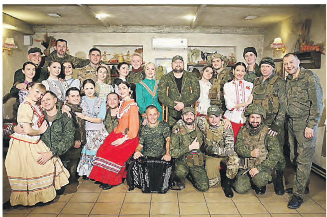
Артисты Луганского академического украинского музыкально-драматического театра на Оборонной выступают перед бойцами СВО. Фото 2022 года

Сегодня Луганский академический украинский музыкально-драматический театр на Оборонной в рамках международного театрального форума «Золотой Витязь» покажет на сцене московского театра «Школа драматического искусства» спектакль «Спаси камер-юнкера Пушкина».